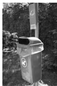
Další krok k čistší obci.