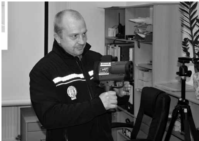
Představení nového radaru při otevření služebny.

Další významnou změnou pro obecní policii je nákup nového radaru. Dosud si obecní strážníci radar půjčovali. Ročně tak musela obec vynaložit na pronájem přístroje kolem 100 tisíc korun. „Půjčování ale bohužel neumožňovalo pružný plán kontrol kterýkoliv den v týdnu a také v libovolnou hodinu,“ vysvětluje Rudolf Sedlák. Nákup nového mobilního měřiče rychlosti za 375 tisíc korun představuje další