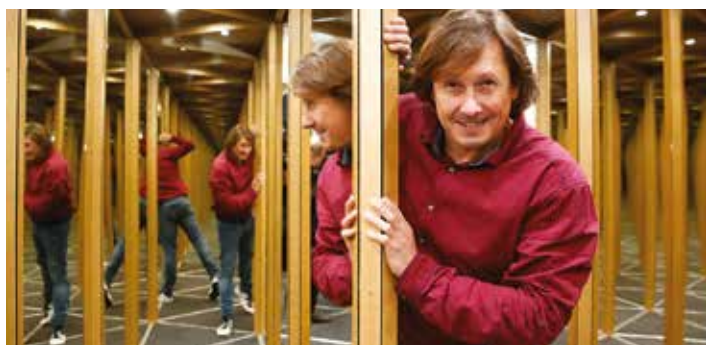
Zrcadlový labyrint v Líbeznicích