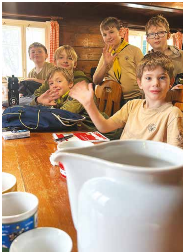
Zdraví vlčátka ze Zlonína