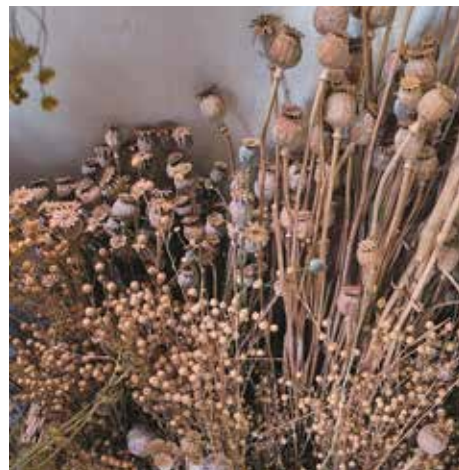
Pěstované kulturní rostliny – len, mák

Uplynuly tisíce let, než šikovné ruce, které s jehlou pracovaly, nahradil stroj. Za počátek strojového šití je považován konec 18. století, kdy si první šicí stroj nechal patentovat Angličan Thomas Saint v roce 1790, jeho vynález však nebyl plně využit. Až později v roce 1830 francouzský krejčí