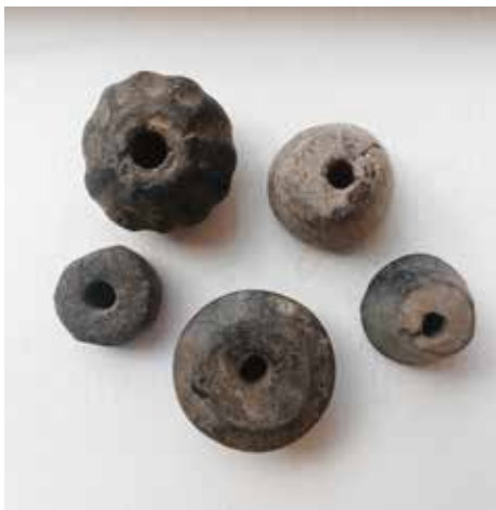
Soubor pravěkých přeslenů – nález ze Srbovky

Ve druhé polovině 18. století, za panování Marie Terezie, došlo k významným reformám školského vzdělávacího systému, které významně ovlivnily vědomosti a praktické dovednosti obyvatelstva. Průkopníkem zavádění nových vyučovacích metod technického charakteru, tzv. industriálního vyučování, byl významný reformátor školství habsburské monarchie, probošt Ferdinand Kindermann (1740–1801). Roku 1774 ho císařovna Marie Terezie jmenovala vrchním školním zemským dozorcem v Čechách. Podnikl studijní cesty po Evropě a poté vytvořil nový typ základní katolické školy podle německého vzoru. V takovýchto školách byla zavedena i výuka šití, předení, pletení, chovu včel, kuchyňských prací a prací na zahradě. Ferdinand Kindermann viděl smysl industriální výchovy v tom, že získané znalosti mohli žáci uplatňovat v nově vznikajících manufakturách, jež se měly stát prostředkem k hospodářskému povzne-