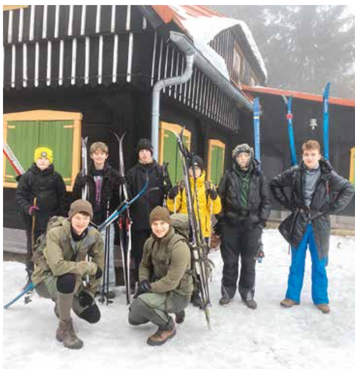
Společné foto skautů z Vlčího dolu

Marek Červenka – Robinson foto Jáchym Blažej „Bába“