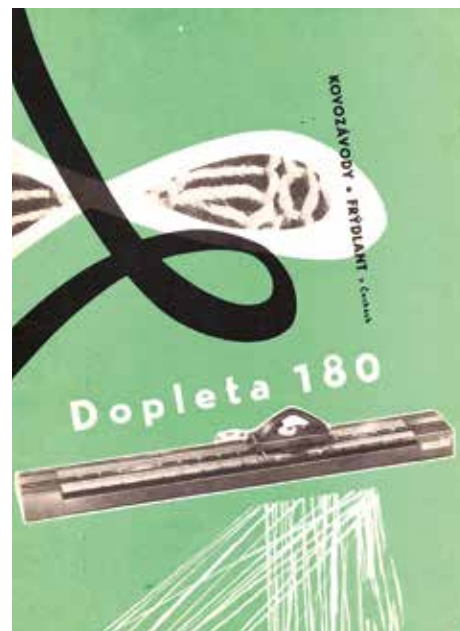
Pletací stroj Dopleta 180 – návod k použití

Jesté počátkem 20. století se většina oblečení denní potřeby vyráběla doma. Také jste si je mohli nechat ušít u místních švadlen, krejčích, ševců nebo si je koupit již hotové v blízkých městech. Často se stávalo i předmětem dědictví. V minulosti si lidé oblečení vážili, běžné bylo jeho spravování,