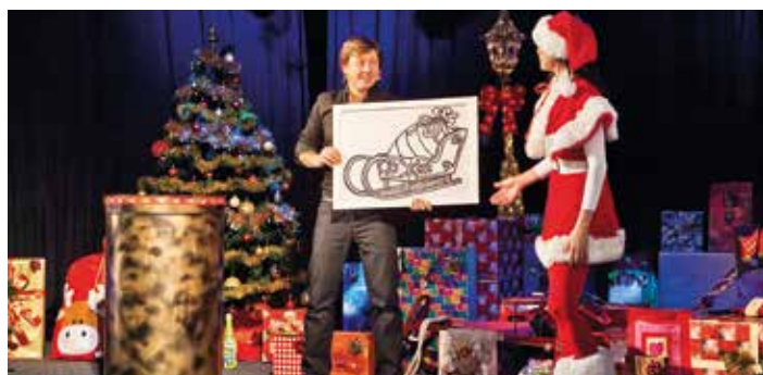
Představení Divadla kouzel