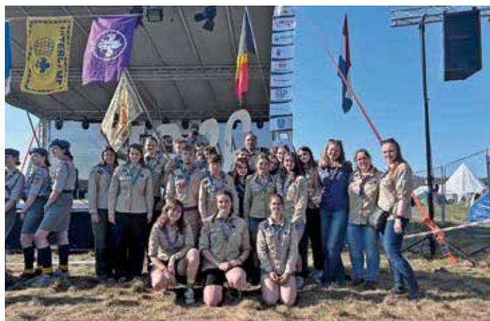
Společná fotografie členů našeho střediska po setkání všech skautů z Česka na Intercampu