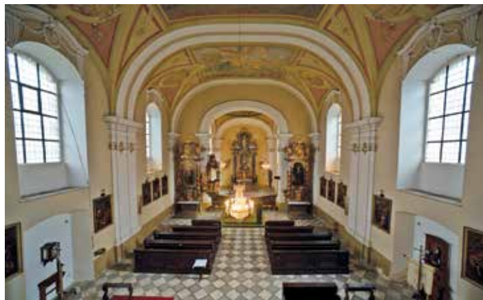
Okna z konce 18. století v kovových rámech v kostele sv. Martina