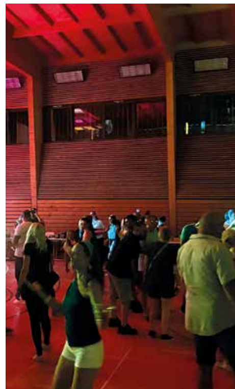
Darina Sokolíková