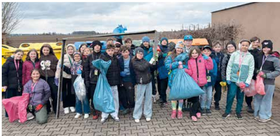
Akce Uklidíme Česko

Na líbeznické škole máme za sebou další školní rok. Rok s číslem 69 od otevření nové školní budovy na kraji obce v roce 1956 byl bohatý na události, inovace i novinky. Tak pojďme na to.