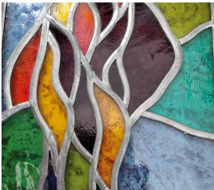
Detail práce Stanislava Krbce

Od středověku v Líbeznicích stával kostel sv. Martina, pravděpodobně s klasickými hrotovými okny. Zachoval se nám jeho popis před zbouráním v roce 1788 a náčrt vyhotovený o několik století později, s již patrnou barokní rekonstrukcí: „Na severní straně se nacházela okna, z nichž jedno osvětlovalo presbytář (prostor, kde je hlavní oltář a místo pro kněze – pozn. aut.), ostatní dvě loď, prostřední bylo vykládáno skleněnými kolečky.“ Nejspíše pozůstatek staršího zasklení, které se opět použilo.