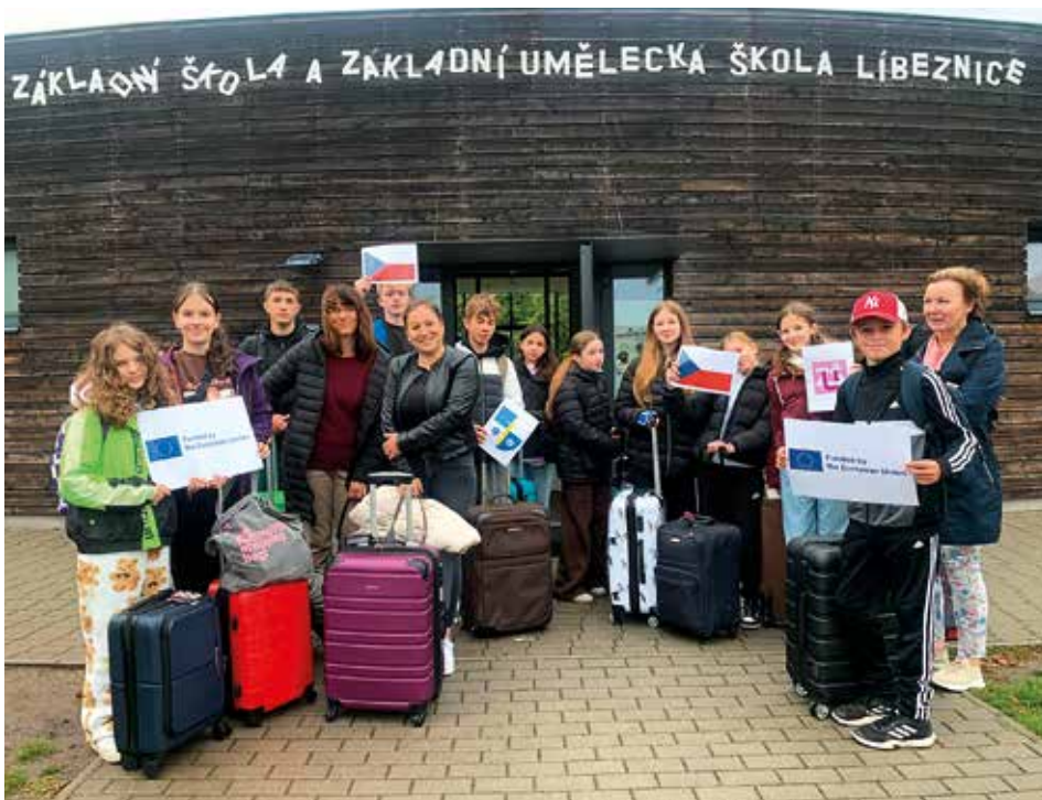
Žáci školy před výjezdem do Francie