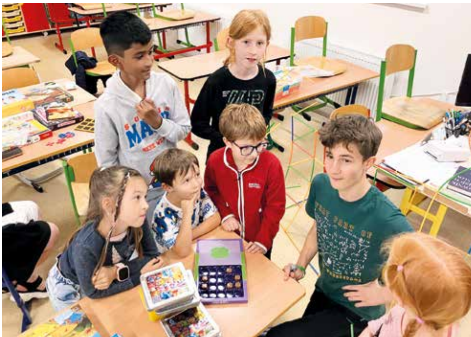
Klub nadaných a zvědavých dětí

František Grunt, ředitel školy