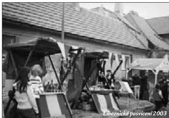
Líbeznické posvícení 2003

To si myslí jistě nejen členové VKSV, ale i jejich příznivci v obci.