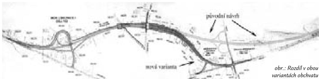
obr.: Rozdíl v obou variantách obchvatu