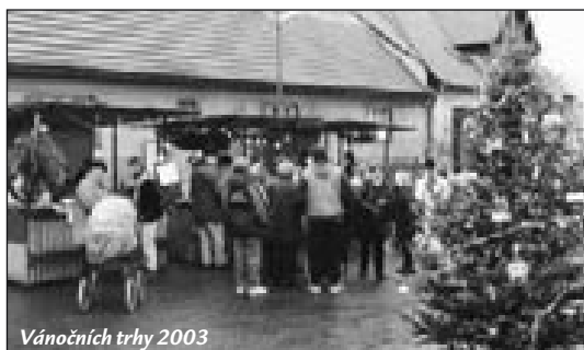
Vánočních trhy 2003

Ať už to je na cokoliv, každý jistě potvrdí, že pocit těšení vyvolává u člověka velmi příjemné rozpoložení mysli. Celý život se rádi na něco těšíme, snad nejintenzivněji se těší děti, to každý člověk prožil. Ale také v dospělosti je fajn se těšit, doba těšení je čas snad ještě lepší, než, když už se samotná věc uděje, kdy jakoby skončí. Myslíme si, že doba, kdy se na něco těšíme se všemi možnými pochybnostmi, je vzrušivější a někdy i hodně napínavá.