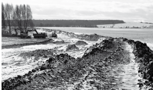
Odstranění zeminy v místě budoucího obchvatu