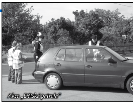
Akce „Dětská patrola“

Obecní policie Líbeznice za uplynulý rok zadržela tři pachatele různých trestných činů, tři osoby v celostátním pátrání a našla pět odcizených motorových vozidel. V šestnácti případech zajišťovala místa dopravních nehod v obci, provedla 22 odchytnů zvířat, vyřešila 610 přestupků porušujících obecně závazné