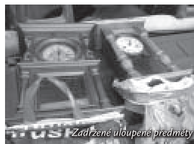
Zadržené uloupené předměty

zákona č. 140/1961 Sb. Věc dále šetří služba kriminální policie a vyšetřování. Hlídka OP zajistila dva agresivní muže, kteří pod vlivem alkoholu ohrožovali jiné osoby a veřejný pořádek. Muži byli převezeni hlídkou OP do záchytné protialkoholní stanice a následně byli vyřešeni v blokovém řízení pokutou pro přešlapky proti veřejnému pořádku. Hlídkou OP byli zadrženi také dva řidiči, kteří řídili motorové vozidlo bez řidičského oprávnění. Tito byli předáni Policii ČR a následně v zkráceném trestním řízení obvinění z trestného činu dle § 180 d trestního zákona.č.140/1961 Sb., řízení motorového vozidla bez řidičského oprávnění. Naše obecní policie také úzce spolupracuje s Obvodním oddělením PČR Odolena Voda a ostatními obecními policiemi v našem regionu. Ve smíšených hlídkách s policisty Obvodního oddělení PČR Odolena Voda provádíme bezpečnostní akce, zaměřené na osoby v celostátním pátrání, řidiče pod vlivem alkoholu a jiné závadové osoby, které se pohybují v našem obvodu. Při poslední bezpečnostní akci, která se konala