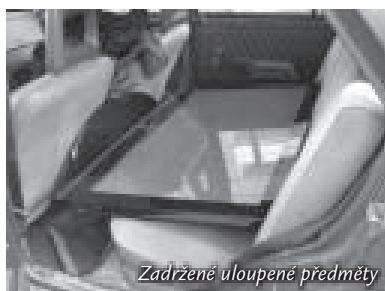
Zadržené uloupené předměty

Vážení spoluobčané, nejprve bych rád touto cestou poděkoval všem občanům, kterým není lhostejné dění v naší obci a svými informacemi nebo poznatky pomohli obecní policii ustanovit pachatele trestných činů, např. krádeže, poškození cizí věci a vloupání do domu, nebo jen „prostých“ přešlapků, které nám všem ztrpčují život. Máme za sebou již