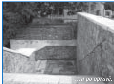
...a po opravě.

zakonzervování již probíhajících staveb by bylo až poslední (a podle mého názoru i nejhorší) ze všech možných řešení.