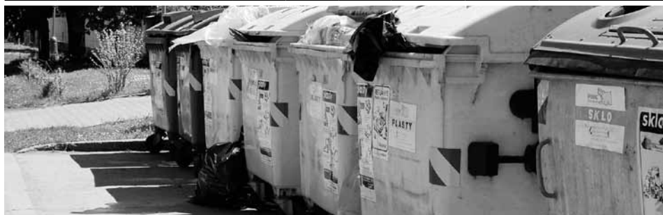
Tříděný odpad šetří obci peníze.