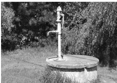
U Studánky.

Místa zdrojů pitné vody byla v minulosti důležitými společenskými centry, kde se lidé setkávali, předávali si informace. Většina líbeznických obyvatel neměla svou studnu ještě v první polovině 20. století, a proto vodu museli nosit do svých domovů