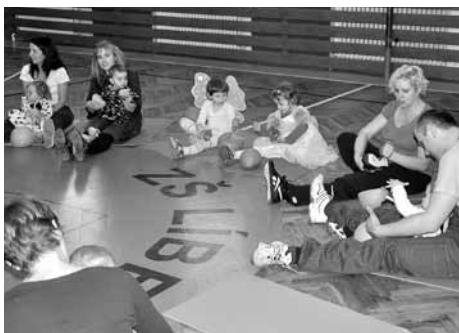
Při cvičení vládne rodinná atmosféra.

Standardní cvičení je po uvítacím pozdravu zahájeno řadou básniček a rozvíčkou, kdy děti s rodiči cvičí v kroužku. Následují hry se švihadly, malými míčky, apod., které zvládnou i ti nejmenší. Pochopitelně nesmí chybět ani soutěže v běhání. Když jsou nožky unavené a vyběhané, další část cvičení probíhá vsedě na podložkách při druhé sérii básniček a říkadél spojených s konkrétními cviky. Závěrečná část je věnována jednoduché překážkové dráze a řízené volné zábavě. Hodina je zakončena tradičním rozloučením. Cvičení probíhá nenásilnou