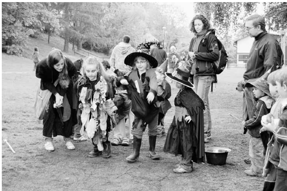
Přesvědčivé líbeznické čarodějnice.