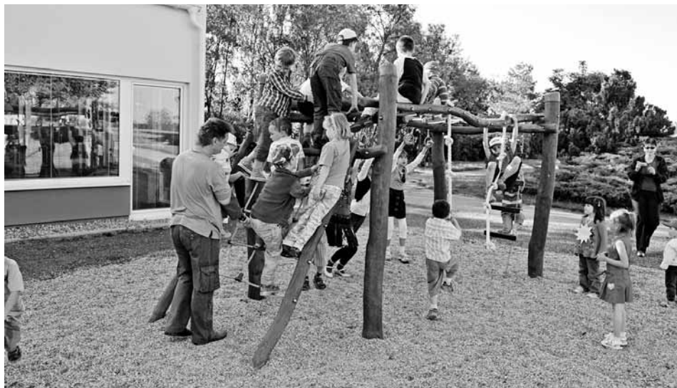
Zatěžkávací zkouška nové prolézačky při školní Zahradní slavnosti.