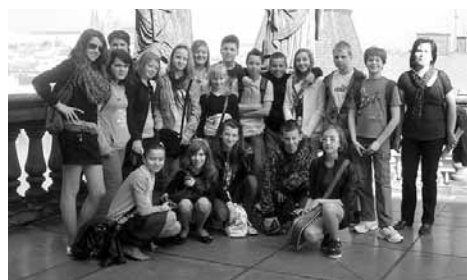
Na střeše Národního divadla.

Cesta rychle uběhla a už jsme stáli před budovou naší Zlaté kapličky. Ve vestibulu nás mile přivítala paní průvodkyně, která svým výkladem všechny zaujala. Dozvěděli jsme se mnoho informací o osobnostech, historii, technickém zázemí starého divadla i Nové scény. Prohlédli jsme si základní kameny, které byly na stavbu