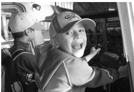
Nadšený pilot – modelář.

Posádky byly dvě – do „Anduly“, tj. vzpěrného dvouplošníku Antonov AN-2 se vešlo najednou 12 lidí. Počasí nám velice přálo, obloha byla bez mráček a my jsme netrpělivě čekali na start. Let byl nádherný. Poté, co jsme se odlepili od země, jsme již nadšeně sledovali, jak se blížíme k Líbeznicím. Seshora jsme se snažili rozpoznat naše domečky,