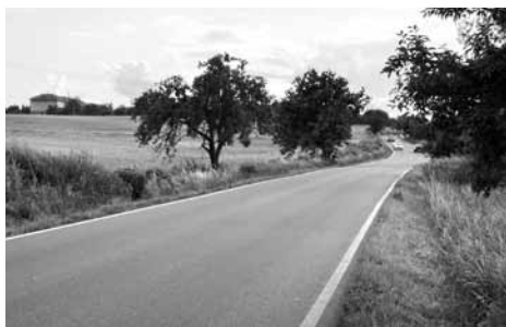
Pohled k Líbeznicím z Nádražní ulice.

Technický vývoj Evropy ve druhé polovině 19. století se zrychlil. Zásadní podíl na změně životního stylu tehdejší doby měly stroje poháněné párou. Nutnost přemísťovat lidi, věci snadněji a rychleji vedly