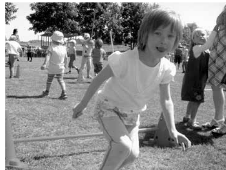
Pepinka z Libeznic závodila jako o život.

Úspěšnému průběhu napomohlo nejen krásné slunné počasí, ale především organizátoři – MŠ Libeznice, Obecní policie a 1. FC Libeznice. Deseťtičlenná družstva (5 chlapců a 5 dívek) se utkali v šestiboji: překážkový běh, slalom, skoky v pytli, hod na cíl, skok do dálky a chůze na chůdách. K nejlepším výkonům družstev chlapců a dívek a báječné atmosféře pomáhalo „fandění“ jejich kamarádů.