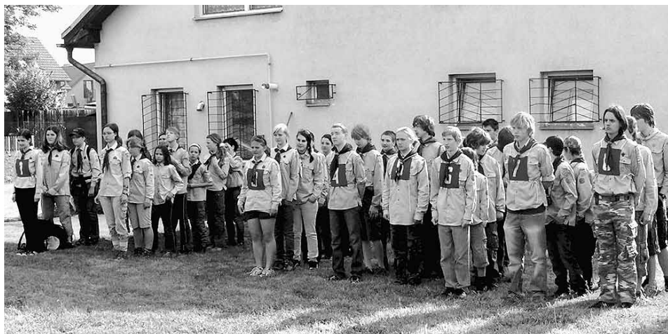
Nástup skautského oddílu.