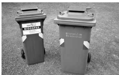
Velká a malá – nádoby na bioodpad.

Po dohodě se společností IPODEC-ČISTÉ MĚSTO, a. s., která v naší obci zajišťuje odvoz komunálního odpadu, včetně vytríděných složek, spouštíme pilotní projekt sezónního sběru bioodpadu.