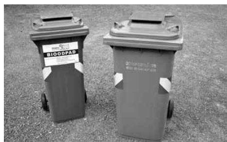
Velká a malá – nádoby na bioodpad.

Po dohodě se společností IPODEC-ČISTÉ MĚSTO, a. s., která v naší obci zajišťuje odvoz komunálního odpadu, včetně vytríděných složek, spouštíme pilotní projekt sezónního sběru bioodpadu.