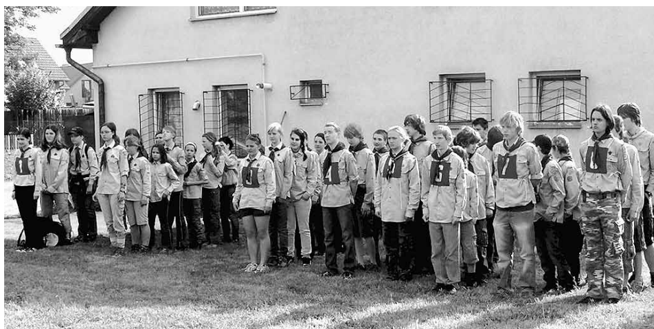
Nástup skautského oddílu.