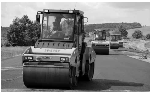
Práce na obchvatu finišují.

Ředitelství silnic a dálnic i stavební firmy potvrzují, že slíbený termín provozování obchvatu Libeznice dodrží. V režimu předběžného užívání by tak stavba měla sloužit motoristům od přelomu července a srpna. Práce na obchvatu v posledních týdnech běží opravdu rychlým tempem. Začneme také řídiče na novou dopravní situaci připravovat. Už v průběhu června vyvěsíme na obecní úřad první billboard ke zprovoznění obchvatu. Další potom umístíme přímo na dálnici před sjezdem na Březiněves v srpnu, abychom co nejvíce řídičů na obchvat odvedli.