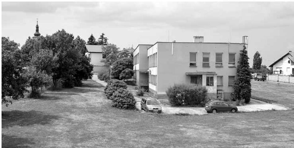
Pohled z místa, kde se kdysi skladovala řepa.

Řepné bulvy byly uloženy na velkých haldách. V blízkosti ulice Východní byly dvě váhy, které sloužily k vážení povozů a později nákladních automobilů naložených cukrovkou. V místě schodiště v Areálu zdraví nebyl svah jako nyní, ale kolmá cihlová zeď a pod ní vedly koleje vlečné dráhy Mratínky. Ještě v 60. letech po nich mašina jezdila. Vlákem zastavil pod kolmou zdí a do vagonů se shora nakládala řepa. Pro nás děti byla úžasná podívaná na kouřící mašinku Věru, jak v podzemním čase jede k Měšicím, a pak dále do cukrovaru Čakovice, ve kterém tehdy pracovali lidé z obce. Cukrovar Čakovice tehdy zásoboval kvalitním cukrem (bílým