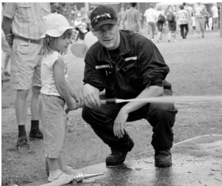
Na Dětském dni zkoušeli hasiči nové talenty.

20. 4. Naše jednotka vyjela k likvidaci požáru vzniklého samovznícením komunálního odpadu ve sběrném dvoře v Libeznicích.