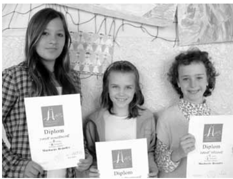
Úspěšní recitátoři z líbeznické školy.