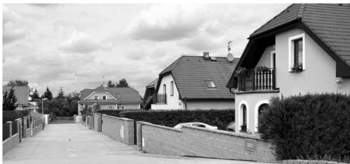
Dřívější podobu místa připomíná název ulice.

Čerstvě načesaná jablka se nechávala na hromadách na zemi tzv. vyrosit. Než si je lidé odvezli domů, kde je ukládali do chladných sklepů, nebo do slámy. Takto ošetřené ovoce vydrželo i do další úrody. Chladný a vlhký sklep byl pro domácnost základním vybavením. Ovoce bylo jednou z nejdů-