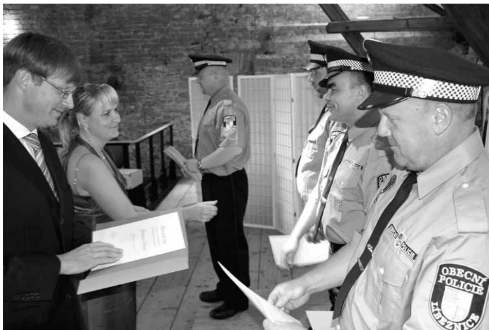
Gratulace po slavnostním slibu obecních strážníků.

„Už jen samotná přítomnost policistů v obci zvyšuje respekt vůči zákonům,“ přidala se starostka Baště lva Cucová.