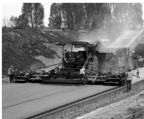
Obchvat před dokončením.

Od prvního plánu na výstavbu obchvatu v roce 1966 se vystřídal ve funkci ministra dopravy