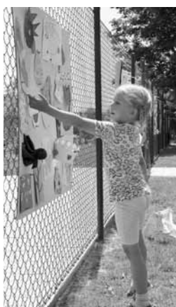
Netradiční výstava na plotě u Bezinky.