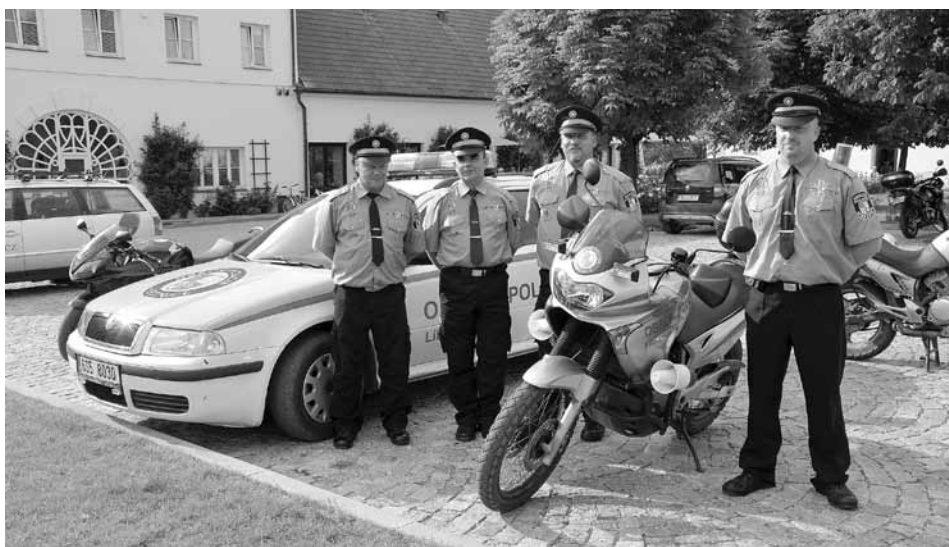
Obecní policie v nové sestavě.

Obecní policie Líbeznice má od čtvrtka 16. června 2011 o dva nové strážníky více. Čtyřčlenný sbor svou působnost rozšířil také na obec Předboj.