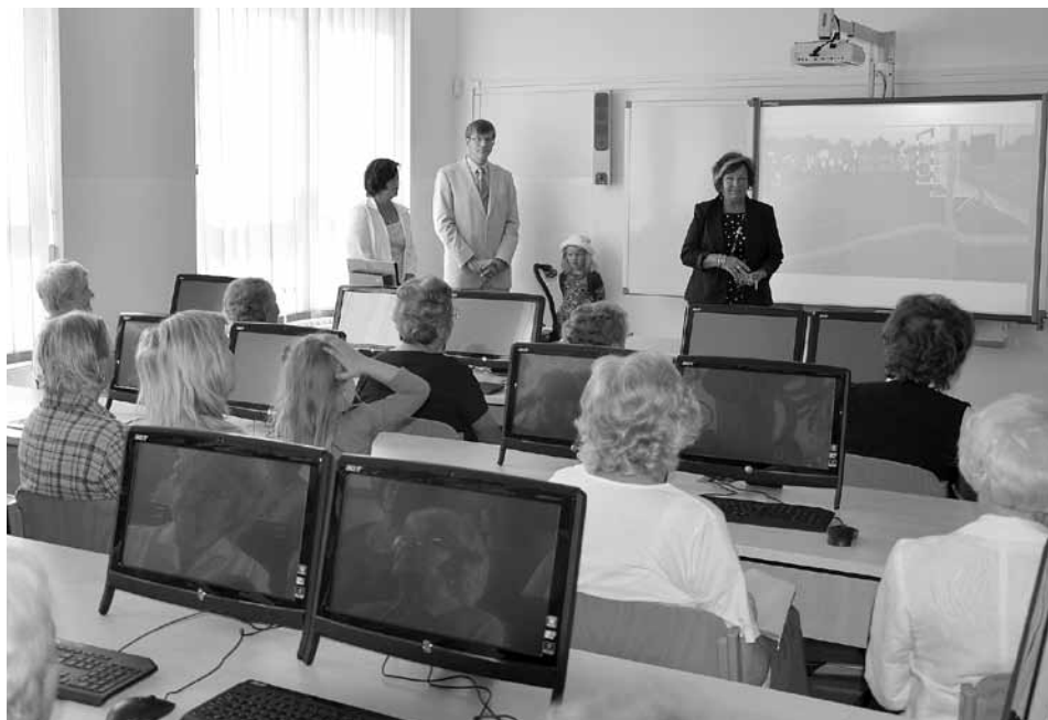
Při oslavě narozenin školy se poprvé otevřely dveře moderně vybavené učebny.