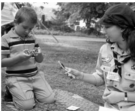
Skauti připravili pro děti na posvícení hry s hla-volamy.