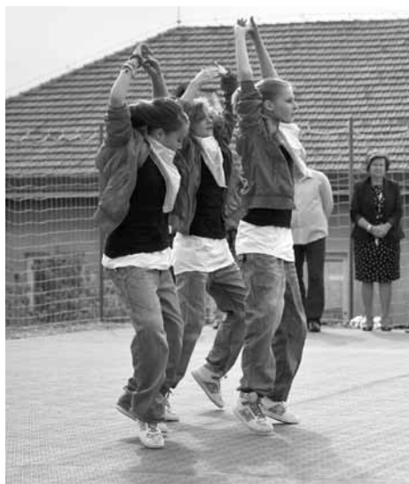
Jako první vyzkoušela hřiště taneční skupina SC Nextyle.

Stavební práce začaly ve středu 27. července 2011. Realizovala je na základě výběrového řízení líbeznická firma Oltex. Kvůli nepříznivému počasí musela nakonec většinu prací stihnout za rekordních 14 dnů. Umělý povrch ze švédských dlaždic Bergo dodala společnost Precol. Na hřišti bude možné provozovat volejbal, nohejbal, basketbal, streetball, malou kopanou, tenis a další sporty. Povrch je vhodný dokonce i pro in-line bruslení.