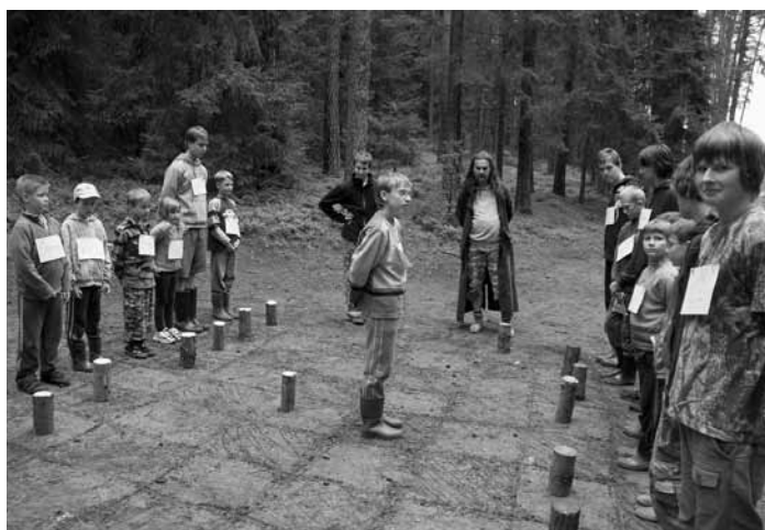
Lidské šachy na břehu Ploučnice.

Rozhořel se i slibový oheň. V jeho září složilo slib několik vlčat i skautů. To vše probíhalo