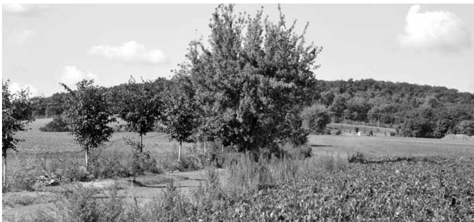
Cesta k Beckovu.

Západním směrem od obce se rozprostírá les nazývaný Beckov. Je významným krajinným prvkem. Zaujímá plochu 150 ha a je jedním z nejvyšších bodů v krajině s výškou 303 metrů nad mořem. Z původních pralesů nám zbyly jen části, tím je i Beckov, Bořanovický háj, Ládví. Jsou domovem nejbohatšího živočišného a rostlinného společenstva. Na jaře, když se zazelenají staleté duby, lípy a rozkvetou koberce konvalinek, petrkličů, sasaneček, podléšek a dymnivek, je zde nejkrásnější. Na starých dubech žijí brouci roháčci. Husté křoviny na okrajích jsou velmi důležité, stejně jako les samotný, poskytl by zvířatům úkryt a potravu, zejména ptactvu a drobným živočichům. Rostou zde i rekordmanky mezi houbami, například vatovec obrovský ( Langgermannia gigantea ), jehož váha může být i 10 kg. Vatovec je považován za neplodnější organismus na světě. Čerstvá plodnice o váze 4 kg obsahuje 1500 bilionů výtrusů. Kdyby se seřadily vedle sebe do řady, řada by měla délku 625 000 km. Druhou rekordmankou mezi houbami Beckova je bedla vysoká ( Macrolepiota procera ), naše nejvyšší houba s výškou až 40 cm.