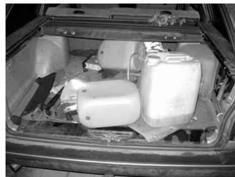
Kanystry v ukradeném autě.

Další pachatele krádeže se smíšené hlídce Obecní policie Líbeznice a Policie ČR podařilo zadržet v nočních hodinách z 10. na 11. 9., kdy se hlídka PČR pokoušela zastavit vozidlo, jehož řidič odmítal zastavit na výzvu. Po dramatické honičce zastavil řidič podezřelého vozidla v obci Líbeznice v ulici Srbovka, odkud s další osobou utekl. Na místě bylo zjištěno, že vozidlo, kterým pachatelé ujížděli, bylo odcizeno předešlého dne v Praze. Ve vozidle se nacházely plastové kanystry na naftu a „nádobíčko“ k užívání drog. Společná hlídka na místě a v okolí provedla pátrání po výše uvedených osobách s negativním výsled-