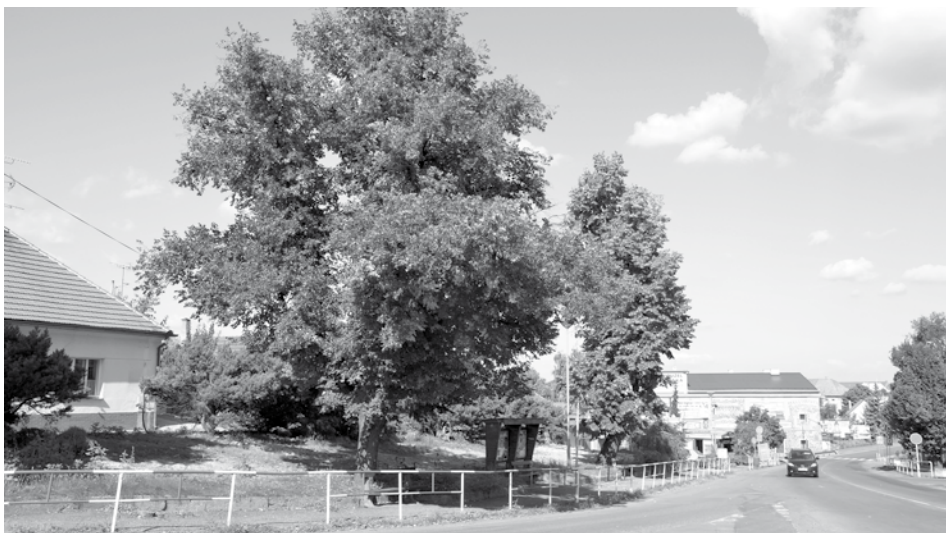
Do Vánoc to bude trochu jiné Mírové náměstí.

V rámci přípravy projektové žádosti rada obce přehodnotila původní návrhy parkových úprav v lokalitě Na Chrupavce. Nový návrh více odpovídá charakteru české vesnické krajiny a nabízí také vhodnější a pestřejší druhovou skladbu. Dává vyniknout soliterním stromům. Naopak upouští od terénních valů, které by nepůsobily přirozeně a komplikovaly by údržbu. Novým prvkem prostranství by měl být