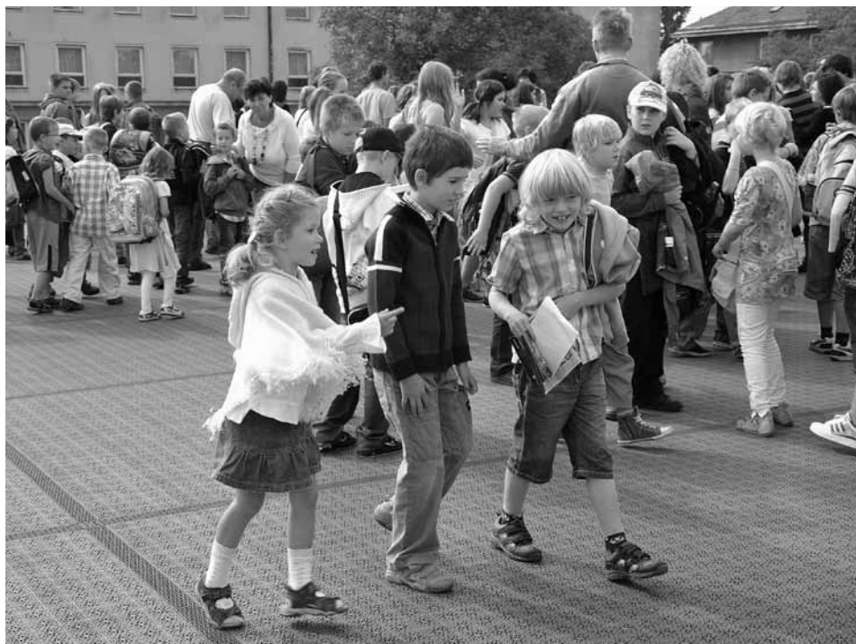
První kroky po novém hřišti. Foto -na-