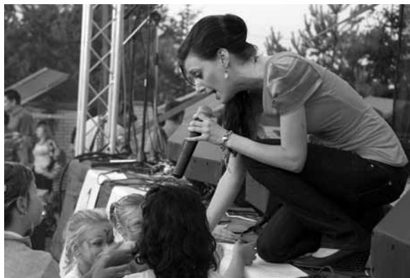
Zpěvačka Dasha se při vystoupení málem ztratila v publiku.

Výběr místa u zdravotního střediska byl prý sice z nouze ctnost, ale mám pocit, že nemohl být lepší. Travnatý prostor ideální pro děti, žádná frekventovaná komunikace nebezpečná pro všechny, pódi-um jako by tu stálo odjakživa, a toho místa okolo!