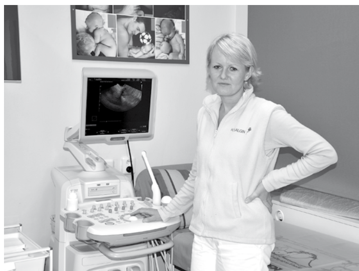
Moderní vybavení gynekologické ordinace.