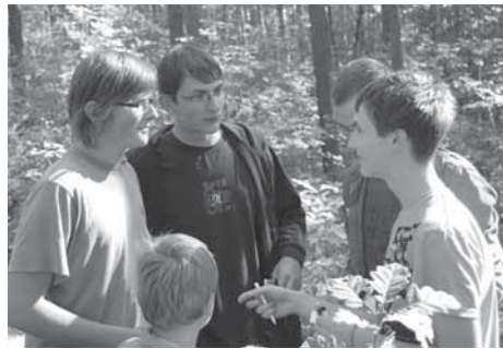
Rybolov byl překvapivě napínavý.

taci fotek z našich letošních táborů. Byl to zábavný a pohodový večer.