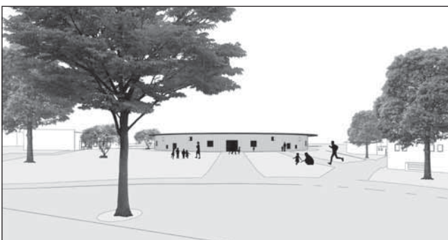
Vizualizace nové budovy školky