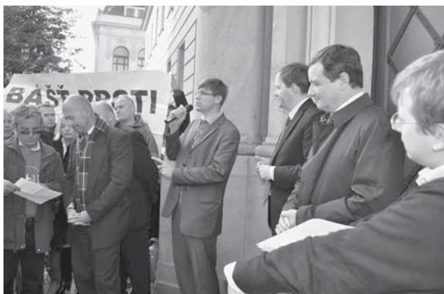
Před krajem bylo rušno.

„I třetí verze EIA přehlíží několik zásadních problémů, například součet všech negativních vlivů na životní prostředí. Též poctivě nezohodnotila negativní dopady na nejmladší část populace – děti. Ukazuje se, že společnost Penta věcné problémy vyřešit ne-