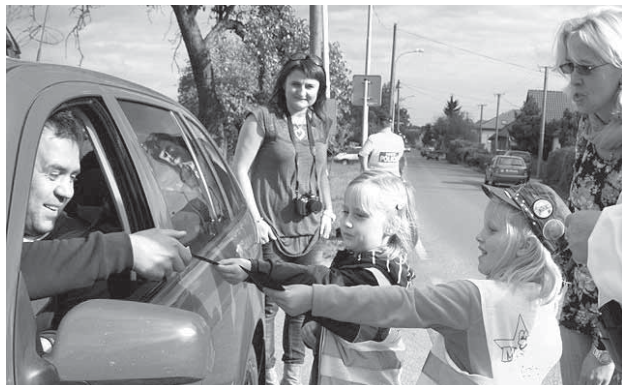
Tak takhle ne, pane řidiči.

Speciální preventivně bezpečnostní akce proběhla v Líbeznicích ve čtvrtek 22. září 2011. Zapojily se do ní v doprovodu obecních policistů děti z mateřské školy. Řidičům pokládaly zcela nezáludné otázky. Správných odpovědí se bohužel dočkaly spíše