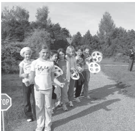
Branný den na dopravním hřišti ZŠ Líbeznice.

Největší nadšení vzbudilo dopravní hřiště, které pro žáky 1. stupně připravila líbeznická Obecní policie.