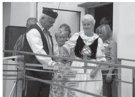
Svoji pásku k nové Arše přestřihli i baráčníci.

V sobotu 10. září se veřejnosti otevřelo nově rekonstruované komunitní centrum Archa. Od té doby slouží jako společenský prostor pro setkávání místních spolků, jako klubovna pro skauty, místo pro dětské kroužky a do budoucna i pro klubové večery a třeba i mateřské centrum. Je to také první zcela bezbariérový prostor pro tělesně postižené.