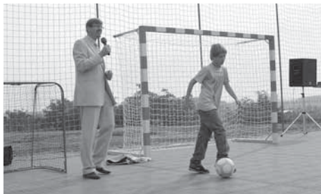
Nové hřiště otevíraly přímé kopy na branku.

Několik přímých kopů na bránu otevíralo ve čtvrtek 1. září první líbeznické multifunkční hřiště. Sportoviště s moderním umělým povrchem o rozměrech 36x18 metrů vzniklo díky podpoře Nadace ČEZ. Celkové náklady na stavbu a umělý povrch dosáhly výše 1,23 miliony korun. Pomoc Nadace představuje 1 milion korun. Zbývajících 230 tisíc Kč hradí obec ze svého rozpočtu. Stavba začala na konci července.