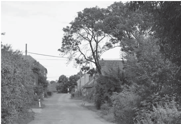
Cestou z Baště.

V nových pražských částech (Čakovice, Letňany, Vysočany, Karlín, Libeň, Kbely) se začaly stavět továrny, které potřebovaly dělníky, řemeslníky. Lidé v nich našli nový, o málo lehčí způsob obživy než v tradičním zemědělství. Jejich úbytek při práci v hospodářství dokázala vyrovnat mechanizace.