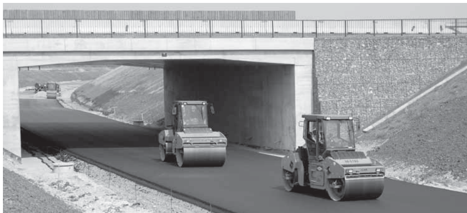
Z posledních týdnů výstavby obchvatu.

Obec Líbeznice po letech velké dopravní zátěže mění tvář. Proměnou prochází Mírové náměstí i Chrupavka. V úterý 22. listopadu 2011 zahájilo zasazení prvního stromu Na Chrupavce parkovou úpravu lokality u zdravotního střediska a zároveň Mírového náměstí. Ještě do Vánoc přibude v Líbeznících celkem 28 nových vzrostlých stromů v obou parcích. Úpravě lokality Na Chrupavce předcházelo na konci léta odklizení více než jednoho tisíce tun navážky.