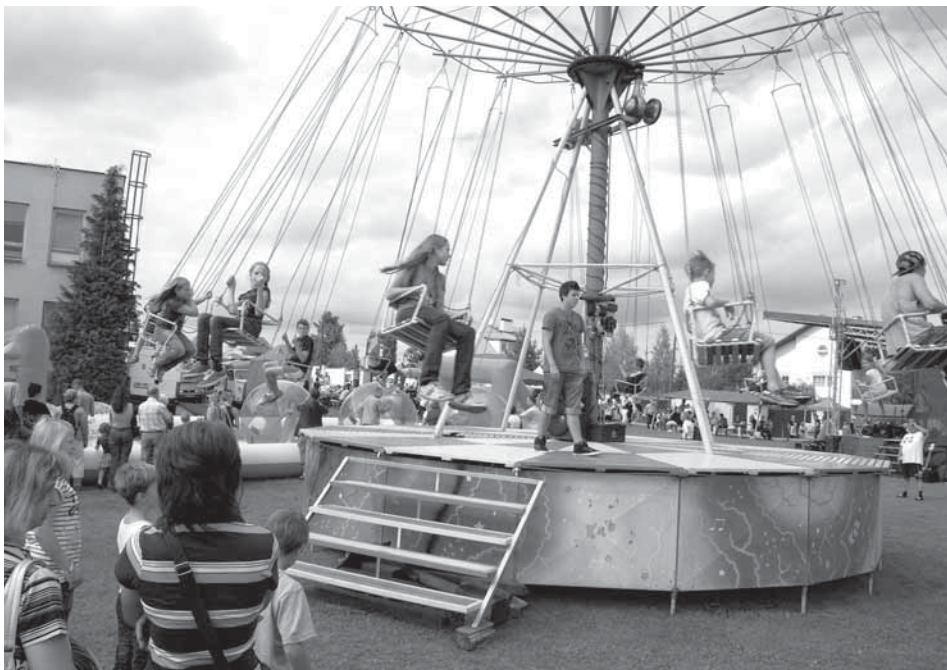
Posvícení přesídliho Na Chrupavku.