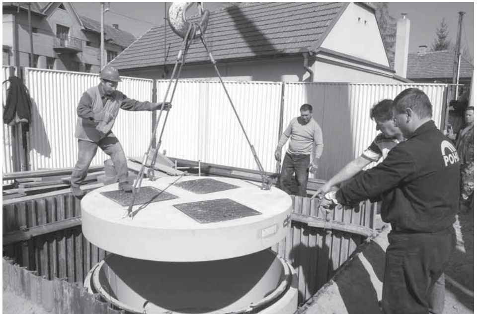
Usazení přečerpávací jímky Na Rybníčku.

Dlouho očekávaná dostavba kanalizace začala v lokalitě Na Rybníčku ve středu 9. března. „Díky dotaci Ministerstva zemědělství bude možné podmínky pro život v obci pro všechny občany zlepšit. Další investice pak budou směřovat do viditelnějších úprav komunikací a veřejného prostranství,“ hodnotí starosta obce Martin Kupka.