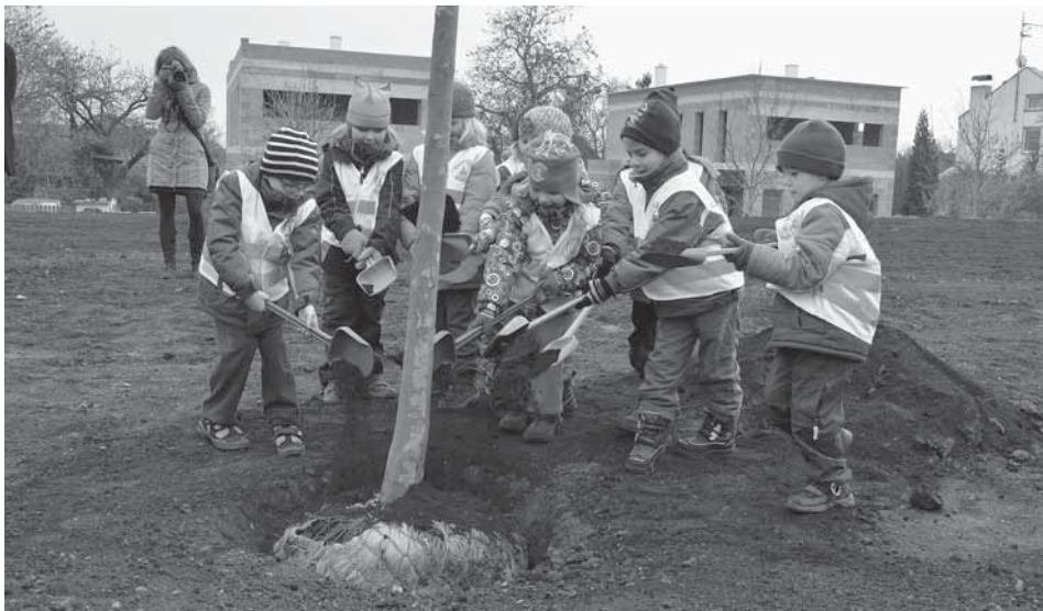
Osud hlavního stromu je v rukách líbeznických dětí.

Obec Líbeznice po letech velké dopravní zátěže mění tvář. V úterý 22. listopadu 2011 v 10 hodin zahájilo zasazení prvního stromu Na Chrupavce parkovou úpravu lokality u zdravotního střediska a zároveň Mírového náměstí. O symbolické zasazení prvního stromu se postaraly líbeznické děti spolu s aktivními seniory místních spolků. Ještě do Vánoc přibude v Líbeznících celkem 28 nových vzrostlých stromů v obou parcích.