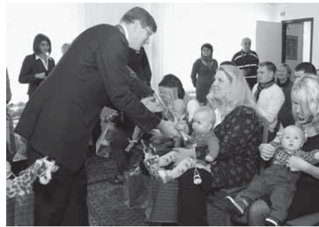
Přání šťastným maminkám.