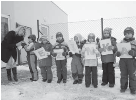
První kroky dětí v Bezince.

Obec Líbeznice nový pavilon vybudovala ze svého rozhodnutí a ze svých vlastních prostředků v rekordně krátkém čase 5 měsíců. Stavba si vyžádala náklady 8 mil. Kč. Podařilo se tak rozšířit kapacitu místní mateřské školy o dalších 25 dětí. Stejný počet dětí bude využívat také školní družinu.