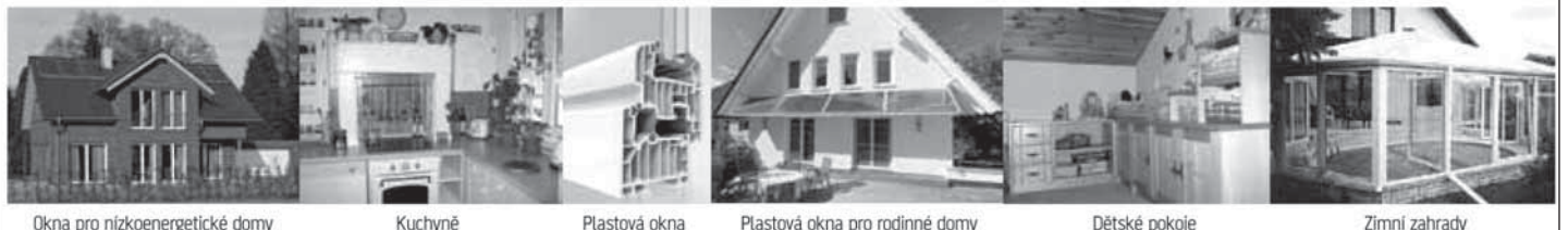
Okna pro nízkoenergetické domy

Plastová okna: 608 808 508, 608 240 808, info@plastova-okna-praha.cz , www.plastova-okna-praha.cz Zakázkové truhlářství: 602 668 024, info@truhlarstvi-cervenka.cz , www.truhlarstvi-cervenka.cz