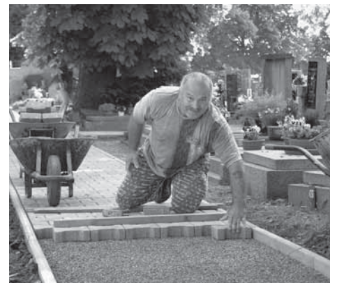
Nový chodník na hřbitově.

Na líbeznickém hřbitově se podařilo dokončit další metry chodníku. Obec do vybudování nového chodníku ze zámkové dlažby na hřbitově vložila necelých 100 tisíc kroun. Nový povrch položil správce hřbitova Václav Vašenda.