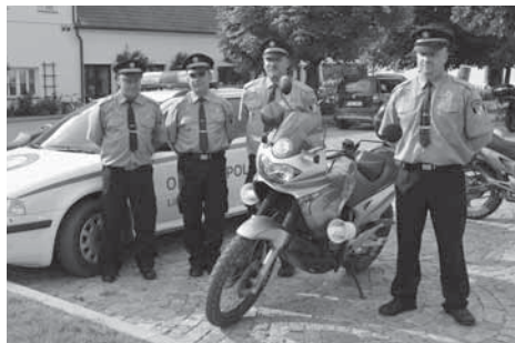
Obecní policie Líbeznice v nové sestavě.

Díky této změně v obecní policii bylo možné rozšířit služby strážníků i o víkendech, kdy v obcích probíhají kulturní akce. Bylo možné rozšířit také vozový park o motocykl Honda Transalp.