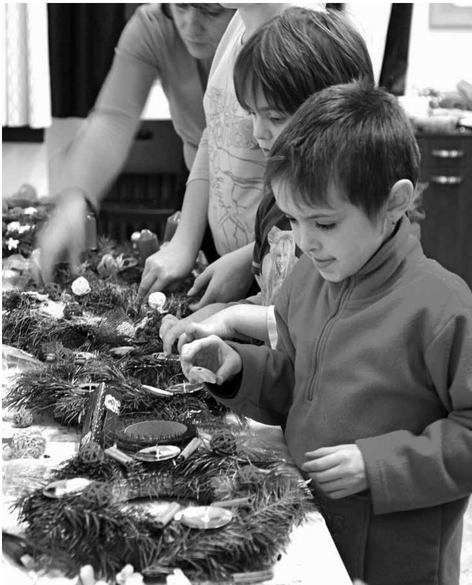
Tradice se do Líbeznic vrací.

Poslední částí Štědrého dne byla půlnoční mše v místním kostele. Začínala přesně o půlnoci se začátkem Božího hodů vánočního. Návštěva kos-