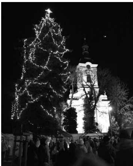
Slavnostní rozsvícení vánočního stromu.