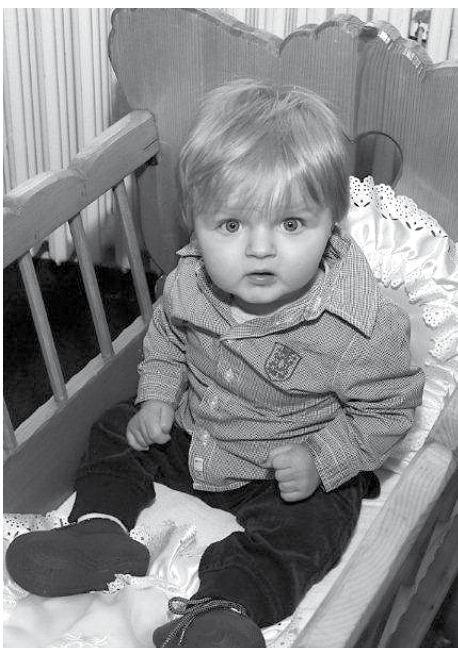
Očima občánkovými.

Začalo to tím, že večer přijela babička s dědou, což není u nás obvyklé, zatím se objevili od mého narození tak jednou, dvakrát, takže asi nějaká výjimečná situace. Ráno jsem poprvé viděl tátu v obleku a kravatě, máma zase nasadila krásné nové vínové šaty, a když i mě začali navlíkat do kalhot a košilky, začal jsem tušit nějakou slávu. Vyrazili jsme ven, tolik lidí kolem mého kočárku snad nepamatují, procházka ale nebyla dlouhá a všichni jsme vlezli do velkého šedého baráku. Hned dole byl trochu problém s parkováním, bylo tady trochu překočárkováno, tak mě vynesli do prvního patra, kde byly hezky oblečené tety, které se na mě celou dobu smály. Spolu s maminkou mě usadily do první řady v takové docela pěkně nazdobené místnosti. Postupně přišla ještě další mimina s rodiči, ne všichni ale byli tak slavnostně oblečení jako my. Nebyly tam ale žádné hračky, takže trochu nuda, než přišly děti a začaly moc hezky zpívat. Když skončily, přišel takový vysoký, hezky oblečený pán s medailí na krku a začal něco povídat. Moc jsem tomu nerozuměl, tak jsem se mu to snažil říct, všichni okolo se ale tvářili spokojeně a důležitě, tak nevím. Pořád žádné hračky, i dudlíka mi vyndali. Pak šli máma s tátou něco podepsat a mně přinesli velkou tašku s hračkami, konečně. Jenže mi je hned zase sebrali a musel jsem se nechat fotografovat. Všichni se moc usmívali, taky jsem nahodil úsměv, abych jim ty