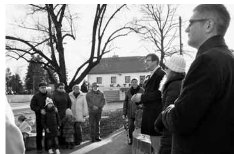
Místo pro sousedské vztahy.

Na jaře příštího roku začne druhá etapa úprav parku, která rozšíří zeleň do významné části nynější vozovky a ve výběžku proti kostelu vznikne také kašna s typicky libeznickou ruční pumpou,