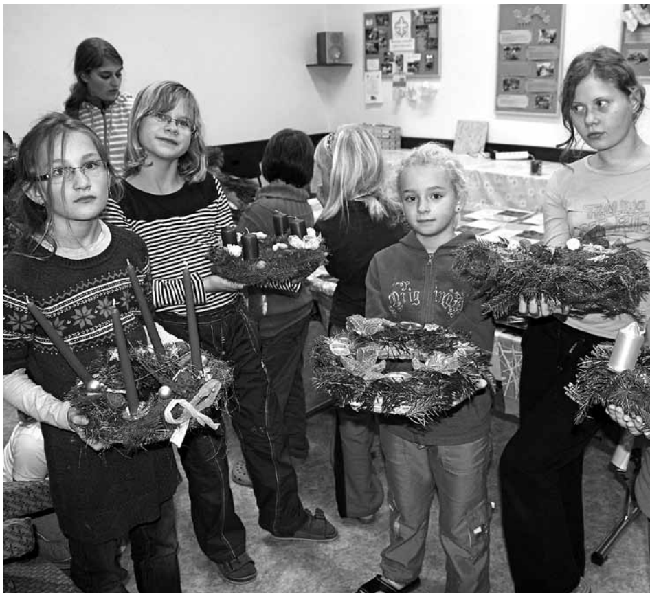
Adventní věnce vznikaly pod rukama dětí.

Poslední páteční podvečer před začátkem adventu se Archa rozvoňovala jehličím a perníčky. Pod záštitou Skautského střediska WILLI a díky dotaci MŠMT se dveře Komunitního centra otevřely dětem a jejich rodičům či prarodičům, kteří si přišli vlastnoručně uvázat a nazdobit svůj adventní věnec. Nutno říci, že účast byla velká a mnohé výtvary tak originální, že by se za ně nemusel stydět ani zkušený florista.