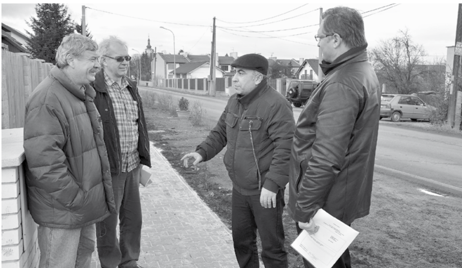
Předání nového chodníku v Hovorčovické ulici.