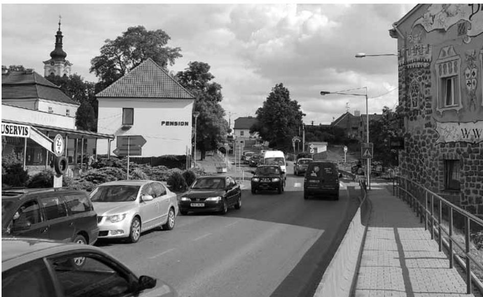
Ve špičkách je doprava pořád hodně hustá.