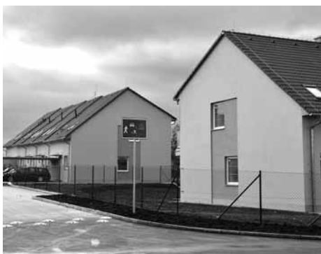
Nová ulice Plukovníka Nováka.

Žil v č. p. 89. Narodil se 25. 4. 1894 v Skřenčích. Vystudoval reálné gymnázium v Táboře. V období I. světové války byl povolán do zbraně (15. 10. 1915). Poslali ho na ruskou frontu, kde se stal rozvědčíkem u 7. roty 82. pěší divize. Byl raněn. Zúčastnil se bojů čs. legií na ruské a sibiřské frontě, přímo se účastnil i bitvy u Zborova. Po skončení I. světové války sloužil u různých vojenských posádek.