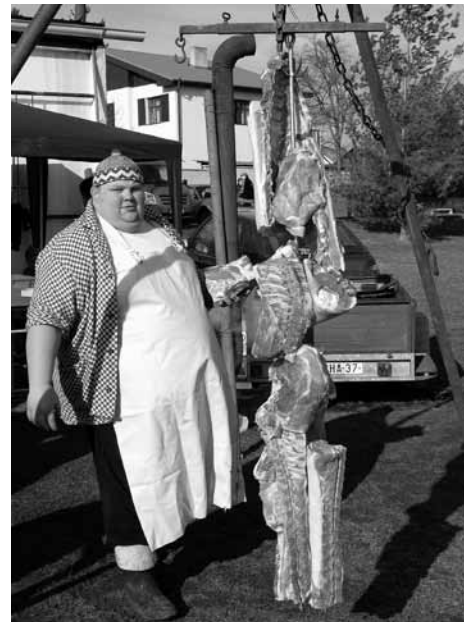
Loňská premiéra vepřových hodů se vydařila.

Kulturní výbor obce Líbeznice zve v sobotu 28. ledna všechny milovníky tradiční české úpravy masa na Vepřové hody. Akci doprovodí živá hudba a nabídka koláčů. Místem konání je fotbalové hřiště v Líbeznicích, začátek v 11 hodin.