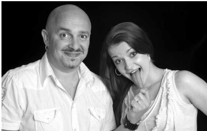
Z představení Turné čtyř můstků.

Líbeznické divadlo připravilo pro místní občany dvě hostující představení pro dospělé. První je komedie Sborovna, kterou uvádí Divadlo Pavla Trávnička 7. února 2012 v 19.00 hod. Úspěšná