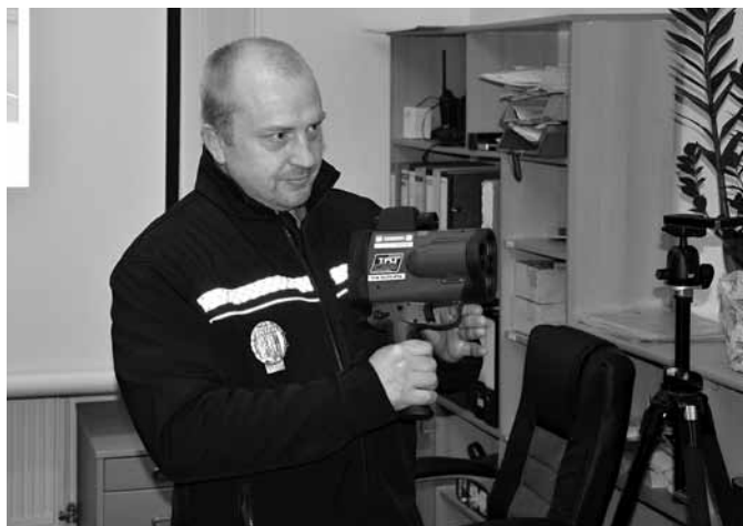
Představení nového radaru při otevření služebny. Foto -mk-

Další významnou změnou pro obecní policii je nákup nového radaru. Dosud si obecní strážníci radar půjčovali. Ročně tak musela obec vynaložit na pronájem přístroje kolem 100 tisíc korun. „Půjčování ale bohužel neumožňovalo pružný plán kontrol kterýkoliv den v týdnu a také v libovolnou hodinu,“ vysvětluje Rudolf Sedlák. Nákup nového mobilního měřiče rychlosti za 375 tisíc korun představuje další