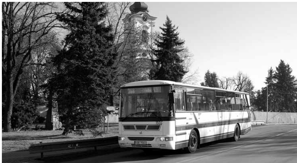
Autobusová doprava dělá z Líbeznic jedno z nejdostupnějších míst pro cestování do Prahy.

Každý rok platí obec Líbeznice více než 300 tisíc korun za autobusovou dopravu. Nejvíce vydává na tři ranní spoje do Prahy, které vyjíždějí přímo z Líbeznic v 5.45, 6.25 a v 7.05 hodin. Před rozhodnutím o objednatelce na příští rok jsme požádali o podro-