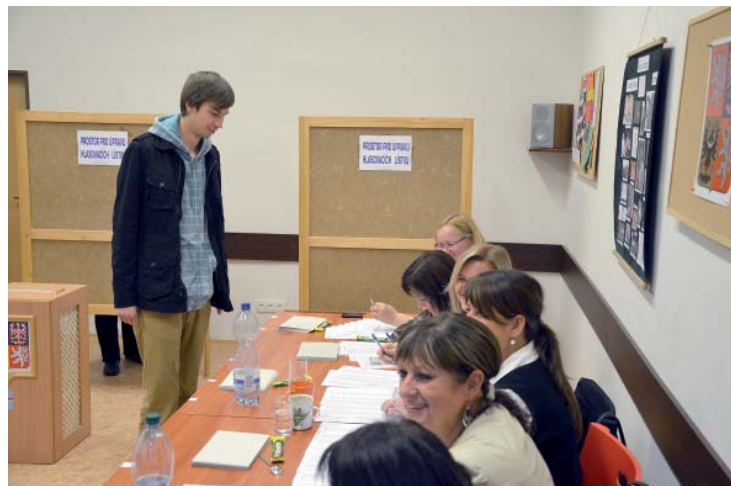
Poprvé se volilo v komunitním centru Archa.

Výsledky krajských voleb v Líbeznicích se od celku kraje výrazně liší. Vyhrála by tu pravice, zatímco v součtu celého kraje jasně zvíťazila levice.