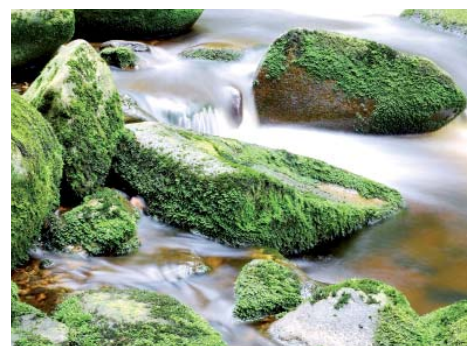
... a jeho výsledky.

i několik společných akcí, namátkou můžeme zmínit úspěšný workshop krajinářské fotografie na Šumavě. S nadcházejícími pošmourými dny podzim by klub rád zorganizoval tematické večery s přednáškou například na téma úprava fotografií v Adobe Photoshop či používání studiové zábleskové techniky s praktickými ukázkami.