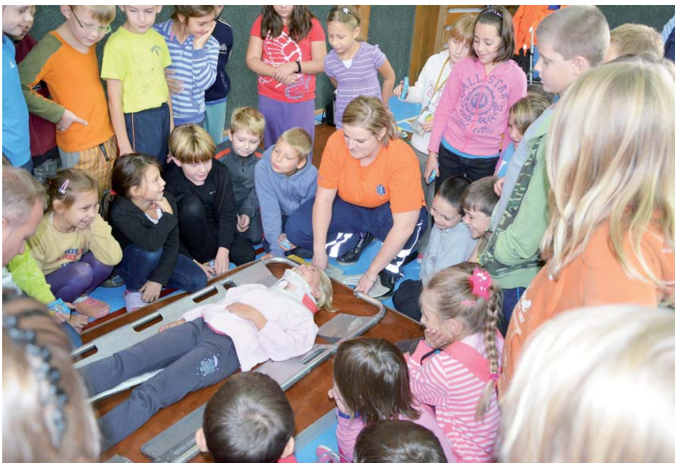
Správnou první pomoc předvedly skuteční záchranáři z Mělníka.

V interaktivní učebně se žáci prvního stupně dozvěděli od příslušníků státní i obecní policie o pravidlech bezpečného chování, jak by měli předcházet