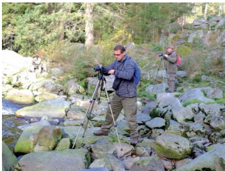
Říjnový lov beze zbraní na Šumavě ...

Jedním ze znaků fungující občanské společnosti je i spolkový život. Líbeznice v tomto směru mají určitě co nabídnout. Ať už jsou to zahrádkáři, baráčníci či skauti. Ambice stát se tradičním spolkem má i na jaře vzniklý Fotoklub Líbeznice – volné sdružení líbeznických fotografů amatérů. Jak z názvu plyne, jeho členy spojuje především záliba ve fotografování. Cílem je nejen dokumentovat proměny Líbeznic či malebná místa v okolí, ale i zpracovávat společná témata či diskutovat nad samostatnými projekty jednotlivců. Některé členky se kromě fotografování věnují i stylingu a vizáži, což je přínosem především pro fotografy portrétní, fashion či glamour. Klub má za sebou