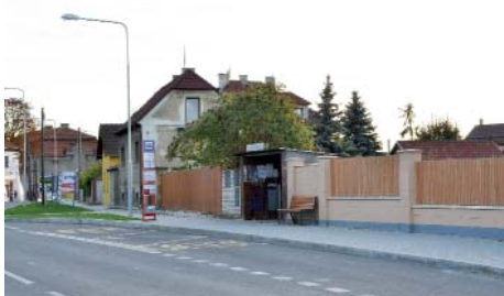
Zbývá už jen opravit čekárnu.

„Víme, že mnoho lidí v Líbeznicích zastávku denně využívá. Chceme je postupně zlepšovat. Do zimy