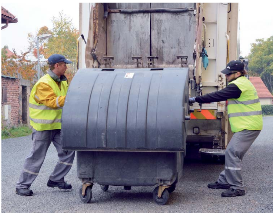
Odpadové hospodářství obec každý rok významně dotuje.

Vedení obce jednalo už minulý rok se společností Ipodec – Čisté město o možnostech zlevnění systému. „Nesporným úspěchem jednání bylo, že se podařilo zabránit zvyšování nákladů, jak k tomu došlo na mnoha jiných místech. Svozoové firmy zvedaly ceny svých služeb například kvůli zvýšení cen