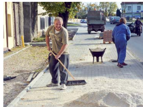
Finální úpravy nového chodníku na náměstí.

Před koncem října se podařilo ukončit další etapu úpravy líbeznického náměstí. Od kostela až k penzionu Dominicalhof lemuje hlavní komunikaci nový chodník. Obec do jeho výstavby vložila více než 200 tisíc korun.