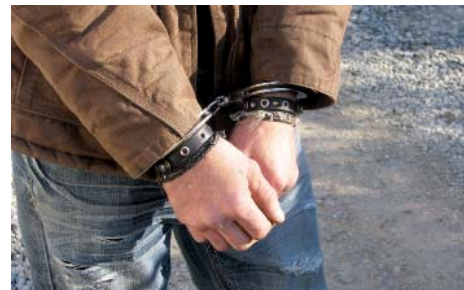
Hledaný muž skončil v poutech.

Ve čtvrtek 11. října prováděli strážníci kontrolu vytipovaných objektů v rámci působnosti Obecní policie Líbeznice, kde se zdržují zavadové osoby nebo tzv. bezdomovci. V katastru obce Bořanovice, byl v objektu bývalé garáže kontrolován muž a žena. U muže bylo lustrací zjištěno, že je na tuto osobu vydán příkaz k zatčení, a to několika soudy.