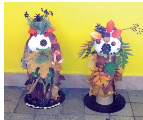
Podzimní postavičky dětí z MŠ.