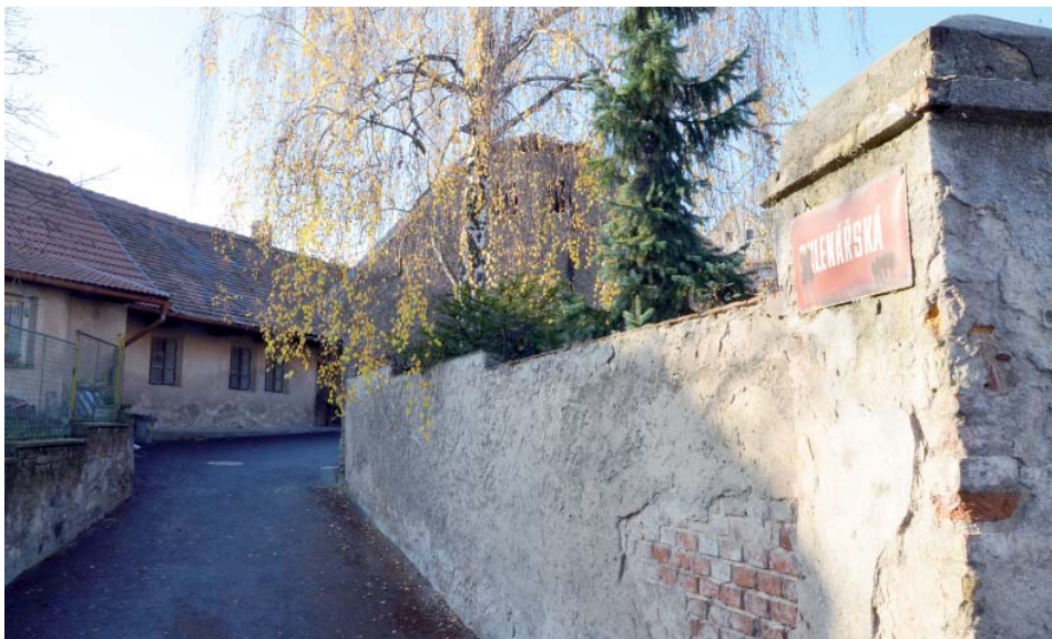
Starý líbeznický dům ve Sklenářské ulici.

Stavební materiály, ze kterých se chalupy stavěly, pocházely zpravidla z toho, co se v nejbližším okolí nacházelo: lomový kámen z hůrek, hlíněných nepálených cihel „vepřovic“ z tzv. žlutky, která je pod vrstvou ornice. Vše se spojovalo vápennou maltou, a nebo jen kaší z hlíny a vody. Robustní zdi se omítaly vápennou omítkou. Každý si vápno hasil doma sám. Vápenec se těžil v lomu ve Velké Vsi.