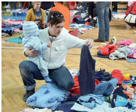
Maminky pečlivě vybíraly.

Po té, co se nám zaregistrovalo dostatek prodávajících, jsme si mohly trochu oddechnout. Ten nej-