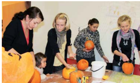
Dýně se dlabaly jedna radost.

Díky štědrému daru Zahradnictví Líbeznice srdce matek zaplesalo, že mohou popustit uzdu své fan-