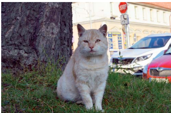
Toulající se Zrzek

„Bezprizorní kočky jsou neočkované, tudíž mohou mít různé kočičí choroby, což představuje riziko pro ostatní kočičí populaci. Doma chované kočky navíc ohrožují úrazy spojené s bojem o teritorium s volně žijícími jedinci. Toulavé kočky mohou navíc přenášet i vnější a vnitřní parazity