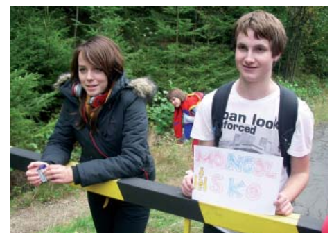
Další zastavení na cestě kolem světa.

j jsme dostali pas s razítkem. Druhý den jsme se probudili ve Španělsku, zatančili si ranní španělský tanec, dostali razítko do pasu a vyrazili na cestu. Ačkoliv to byla obyčejná cesta z Jablonce na rozhlednu Bramberk, pro nás to byla cesta přes mnoho zemí se spoustou úkolů a veselých zážitků, včetně dramatického pašování slonů v lese kousek od rozhledny či baštění gumových medvídků čínskými hůlkami. Na rozhledně byly díky krásnému podzimnímu počasí nádherné výhledy, a tak jsme se pokochali a pokračovali přes další cizokrajné země zpět na základnu. Večer nás čekal program speciálního rádia Bramberk – nezapomenutelné vysílání Freda a Želvy s písničkami na přání. V neděli se nám konečně podařilo i přes nepřízeň počasí dorazit zpět do Anglie a zdolat cestu za vysněných 80 dní. Unavení, ale šťastní jsme dorazili vlakem zpět domů a už se moc těšíme na další