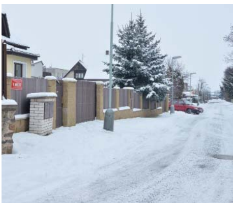
Pohled do ulice K Makůvce.