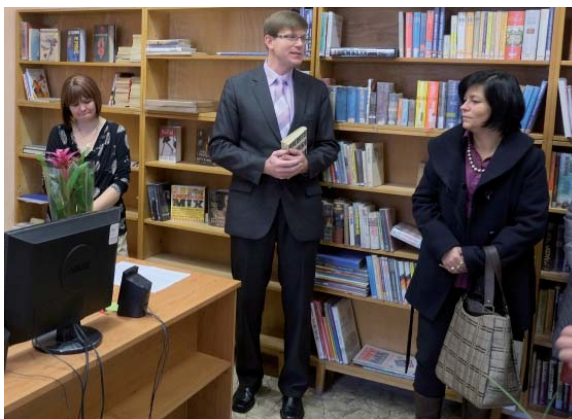
...aby knihovna byla živým kulturním centrem.

Nové uspořádání vnitřních prostor knihovny je už dílem nově přijaté knihovnice Alexandry Dančové. Jako první si nově upravenou knihovnu prohlédli při slavnostním otevření mimo jiné obě předchůd-