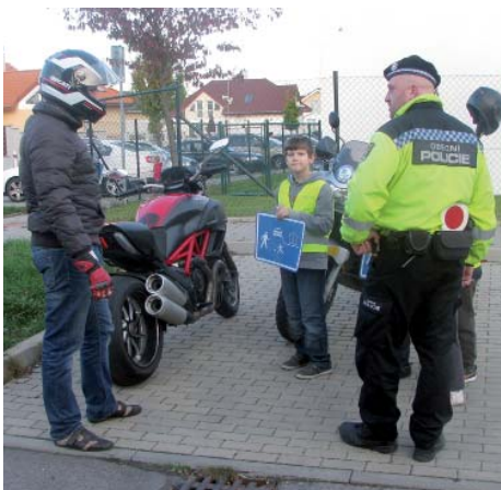
Děti to řecky řidičům – preventivní akce.

Vodoteč, která odvodňuje katastr obce, najdeme v mapách pod názvem Líbeznický potok, místní obyvatelé ji však pojmenovali po svém – Makůvka. Pramení v Bořanovic-kém háji, protéká mírně zvlněnou krajinou Polabí, obcemi Bořanovice, Pakoměřice, Líbeznice, Měšice a Mratín, kde se u bývalého panského mlýna vlévá do Mratínského potoka. Po celé délce toku byly od středověku budovány rybníky.