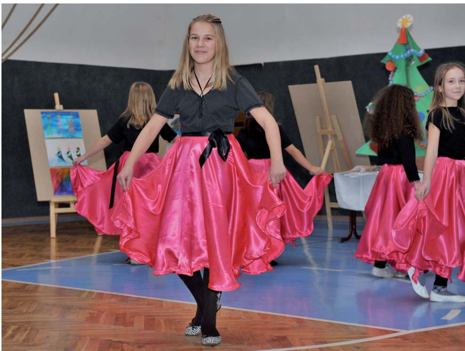
Vystoupení malých tanečnic.

zenci, ostatní příbuzní i veřejnost téměř zcela zaplnili tělocvičnu a vytvořili úžasnou atmosféru.