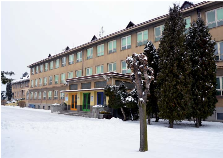
Největší investice roku 2013 – zateplení školy.

Největší výdajové položky představují jako každý rok provozní náklady líbeznických škol. Jde v úhrnu o 5,75 miliónů korun. Téměř 7 miliónů korun kryje náklady na přípravu projektů, veškeré služby spojené s chodem úřadu, přípravu projektů a také mzdové náklady pracovníků obecního a stavebního úřadu. Další významnou výdajovou položkou je 3,5 miliónu Kč na péči o vzhled obce a veřejnou