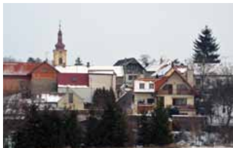
Pohled na Skalce směrem od Beckova.

V katastru obce, kde sprašové vrstvy půdy jsou poměrně mělké, vystupuje podloží bulizníků a křemenů místy jako skalní suky nad úroveň okolní krajiny. Těmito místům se říká Skalky, Hůrky. V minulosti byly využívány na těžbu kameň pro výstavby domů a hospodářských budov. Osídlení ulice Na Skalce v blízkosti vydatného vodního zdroje patří k nejstarším v Líbeznících. Ve spodní části ulice Na Skalce bývávala obecní pastvina.