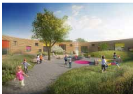
Takto by mohla vypadat zahrada nové MŠ