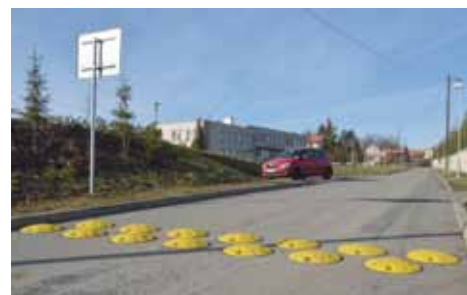
Nově vybudovaný zpomalovací pruh v ulici Východní.

„Rádi bychom co nejdříve vybudovali zvýšený přechod pro chodce přes Hovorčovickou ulici před křižovatkou s Lánskou. V loňském roce se do soutěže na zhotovitele nikdo nepřihlásil, a to ani při opakované výzvě. Zkusíme tentokrát spojit do soutěže i další úpravy a přechody na Mělnické ulici,“ doplňuje starosta obce Martin Kupka. -mk-