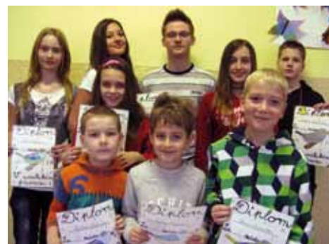
Naši vítězní recitátoři.