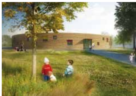
Takto bychom se mohli na novou MŠ dívat od jihu

Dalším krokem ze strany obce pro ulehčení situace bylo vytvoření podmínek pro vznik mateřského centra. Investice do komunitního centra Archa byla jedna z prvních po posledních komunálních volbách.