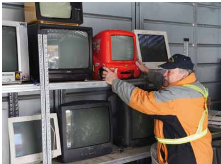
Líbeznický sběrný dvůr shromažďuje i elektroodpad.

Do konce února se můžete zapojit do soutěže Sbírejte a vyhrajte. Stačí přinést pět starých elektrospotřebičů do sběrného dvora.