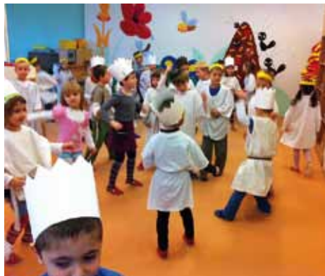
Tříkrálové dopoledne v MŠ.

Nový rok 2013 jsme v mateřské škole zahájili štěbetáním o zážitcích z vánočních prázdnin a tříkrálovým dnem. Původně se měl uskutečnit a byl naplánován tříkrálový průvod zasazenou líbeznickou krajinou. Rodiče byli požádáni, aby se dětem postarali o bílé oděvy.