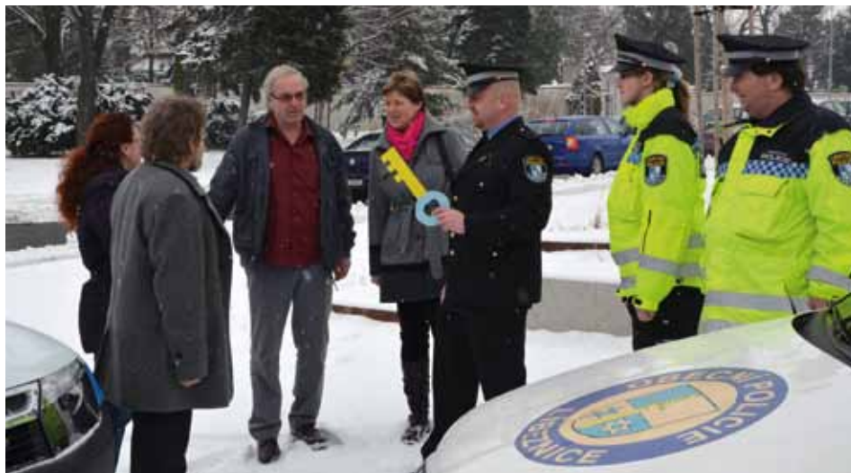
Slavnostní předání klíče od nového vozu veliteli obecní policie.

Strážníci Obecní policie Libeznice mají od středy 13. února pro pohotovější zásahy v obcích i v terénu novou Dacii Duster s pohonem všech čtyř kol.