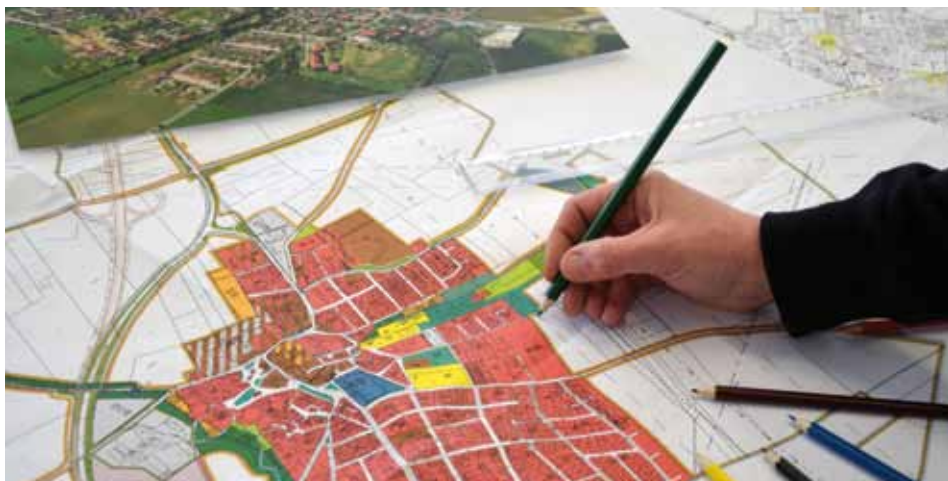
Práce na územním plánu začínají.

Všechny obce a města musejí mít podle nového stavebního zákona zpracovaný nový územní plán. Obec Líbeznice vyhlásila na začátku března výběrové řízení na jeho zhotovitele. Co bude řešit? Jaké přinese novinky?