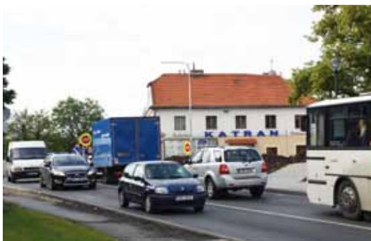
Přes náměstí projede denně více než 10 tisíc vozů.