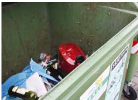
Vskutku „vzorné“ třídění.