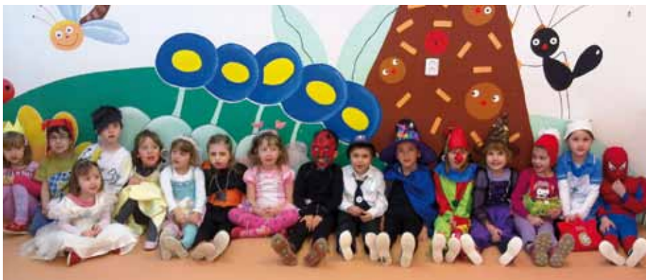
Pohádkové bytosti v MŠ.