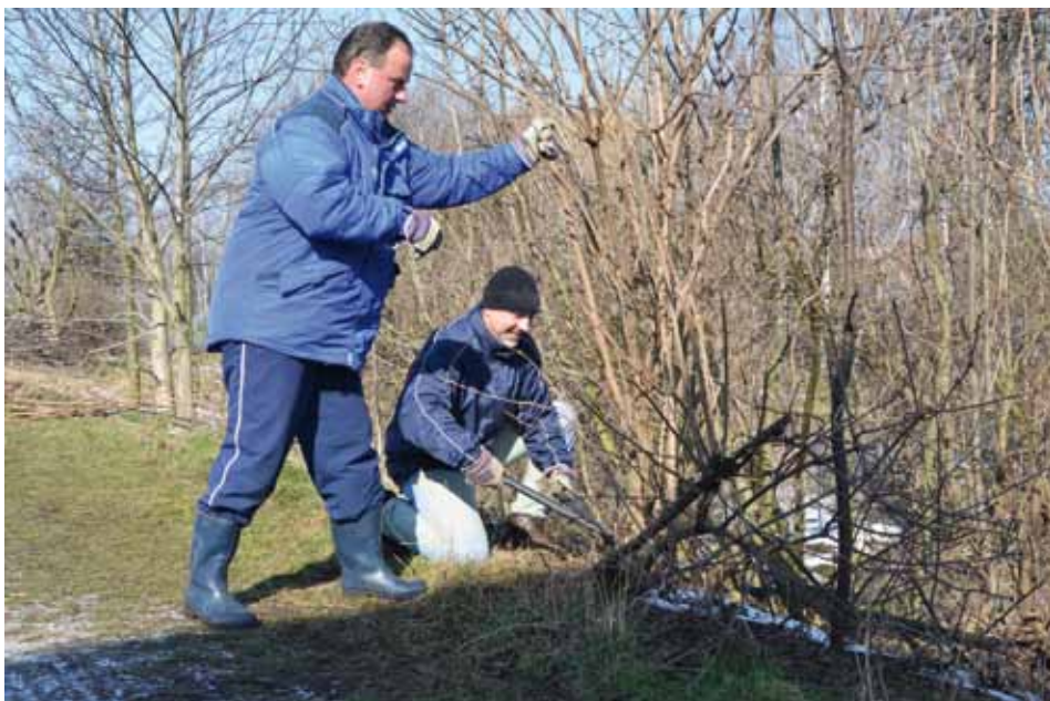
Uklidíme si Mratínku sami.

Cílem společného snažení je zkulturnit nejoblíbenější líbeznickou vycházkovou cestu. Obec nasadí do úpravy cesty také těžší techniku a jedná s majitelem jezdeckého areálu o další spolupráci. Výsledkem by mělo být rozšíření cesty, aby mohli nadále po Mratínce chodit i koně a neničili cestu pro pěší a cyklisty. Ještě letos by měly na cestě přibýt lavičky a odpadkové koše. Letošní aktivity navazují na loňskou společnou investici Líbeznice a Měšic, kdy se podařilo upravit cestu po Mratínce tak, aby bylo možné dojít po obecním pozemku z Areálu zdraví až do Měšic.