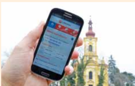
Líbeznice v mobilu.

Jde o síťovou aplikaci do chytrých telefonů. Podmínkou je samozřejmě připojení na internet – tedy aktivované datové služby. V okamžiku, kdy obec zadá novou informaci do systému, uvidíte zprávu s odstupem několika vteřin ve svém mobilu.