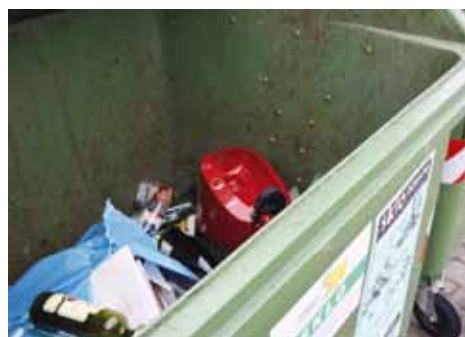
Vskutku „vzorné“ třídění.