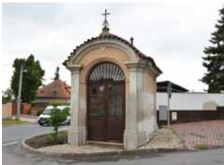
Kaplička Panny Marie.

Drobnými opravami prošla na začátku května kaplička Panny Marie na křižovatce Mělnické a Měšické ulice. Hlavním cílem bylo zajistit odvlhčení této drobné sakrální stavby. Podél celého obvodu vznikl drenážní kanál vyplněný kačírkem. Až do úrovně 80 cm odstranili pracovníci technických služeb omítku v interiéru, aby zdívo mohlo proschnout. Provedli zároveň drobné opravy vnější omítky.