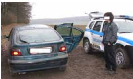
Nějaký čas si nezaježdí.

V odpoledních hodinách dne 5. 4. 2013 byl hlídkou obecní policie v obci Bašť kontrolován řidič osobního motorového vozidla, který místo řidičského průkazu předložil sdělení obvinění z maření výkonu úředního rozhodnutí. Toto rozhodnutí řidič obdržel ten samý den od policejního orgánu v Praze, kde byl v nočních hodinách zadržen, když řídil motorové vozidlo i přes to, že mu byl udělen trest zákazu řízení. Řidič byl hlídkou obecní policie předán kolegům z OO PČR Odolena Voda, kde mu bylo opětovně sděleno obvinění. Dne 10. 4. 2013 zaregistrovala hlídka obecní policie v katastru obce Předboj výše uvedeného řidiče, jak jede v osobním motorovém vozidle směrem do obce Bašť. Řidič byl hlídkou opětovně zastaven a předán kolegům z OO PČR Odolena Voda pro již několikáté porušení zákazu řízení.