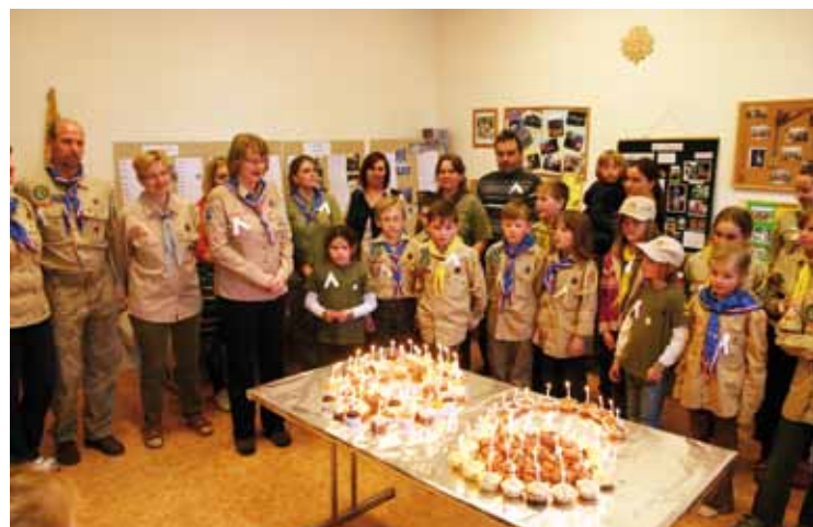
Oslavám nechyběl ani originální dort.

K devadesátému výročí uspořádalo skautské středisko „Willi“ Líbeznice v sobotu 20. dubna 2013 oslavy pro své současné i bývalé členy a pro veřejnost. Odpoledne s nabitým programem zahájila dobrodružná hra pro děti „Za pokladem Alžběty Líbeznice“. Tříčlenná družstva získávala na stanovištích za splnění úkoly indicie, které je pak dovedly k pokladu. Celá hra byla inspirována fiktivní historií naší vesnice, s reálnými místy. U zdravotního střediska jste tak mohli potkat špitální sestry, u kterých jste museli přejít správnou cestou po vytyčených dlaždicích, venkovská učitelka děti zkoušela u Staré školy z hádanek, porybnému jste mohli pomoci s výlovem ryb a v nejstarší části Líbeznice, v ulici na Hůrce, strašili duchové. Všichni účastníci byli velmi odvažní, protože nejen splnili všechny úkoly a získali Alžbětin poklad, ale také se odhodlali vzdorovat nepříznivému počasí.