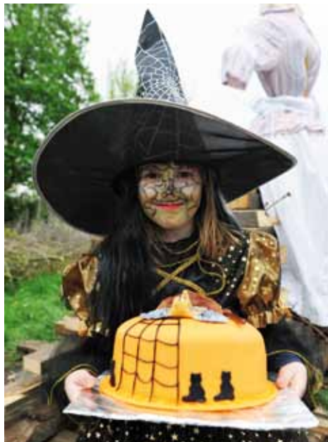
Nejpůsobivější malá čarodějnice Kačiklecka Kovářná.

Letošní slet líbeznických čarodějnic přilákal početné obecenstvo. Pod těžkými kovově šedými mračky se 30. dubna sešlo na fotbalovém hřišti na 500 duší.