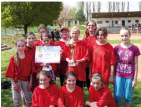
Vítězky okresního kola Preventan Cupu.

Dne 25. 4. 2013 se Základní škola v Líbeznících zúčastnila okresního kola Preventan Cupu, turnaje ve vybíjené, který se konal v Čelákovících. Naši školu reprezentovala dvě družstva, chlapců a dívek, sestavená z žáků a žákyně 5.A, 5.B a 4.A. V pěkném prostředí čelákovických kurtů soupeři-