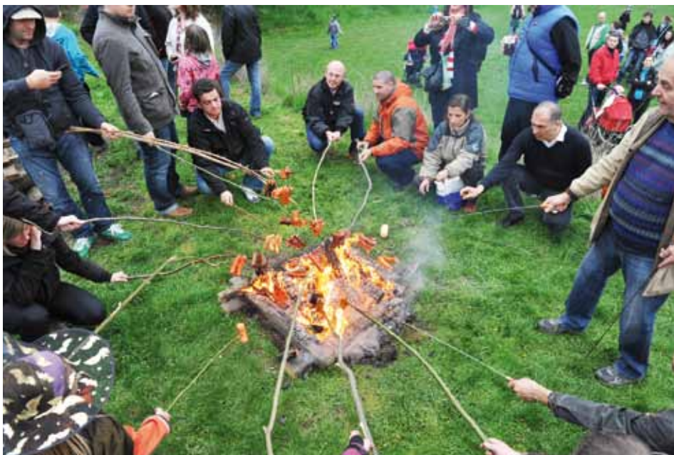
Takové milé sousedské opékání.

Hned na úvod zasedly nejvyhlášenější ježibaby, aby určily, která z letošních učednic se v rozvoji čarodějnického řemesla vyznamenala nejvíc a která se jejich šerednosti nejvíce přiblížila. Porota to byla přísná. Pekelný soud na čarodějnickým potěrem vynášely Pěknice Nestvůrná, Kruhhlava Horkokrevná a Řemdicha Plahočivá. Některé ježibaby juniorky se dokonce bály před jejich propalujícími pohledy zatančit a tajně skrápěly oheň své čarodějnické vášně slzami. Přísným sítem prošly ty nejlepší z nejlepších a na nejvyšší čarodějnické hranici stanula Kačiklecka Kovářná. Kromě náležitě vyděšených pohledů sklídila dokonce i čarodějnický dort z těch nejroztodivnějších ingrediencí, včetně ušního lalůčku nejstarší líbeznické tarantule. Jistě si na něm pochutnala.