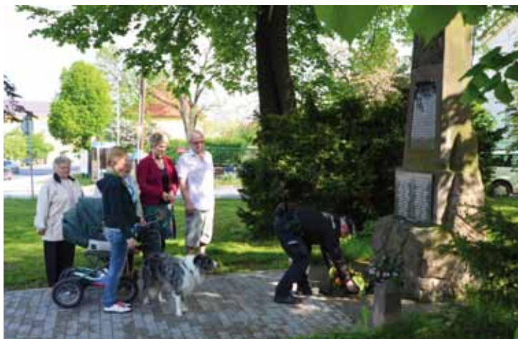
Uctění obětí 2. světové války 9. května 2013.

Dalšími jsou ruští zajatci, kteří se zúčastnili osvo-