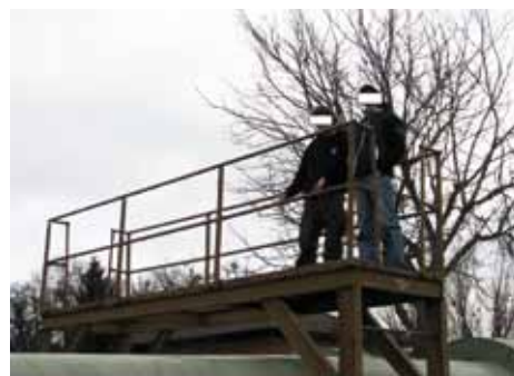
Co není přivařeno, neobstojí.

Vzhledem k nárůstu krádeží železa, prováděla v únoru 2013 obecní policie několikrát prověrku provozovny sběrných surovin v obci Líbeznice. V jednom případě bylo zjištěno, že provozovatel sběrných surovin vykoupil železné rošty, které byly odcizeny z lávky parovodu v katastru obce. Šetřením hlídkou obecní policie byli zjištěni dva mladíci, kteří tyto rošty odcizili a následně se k činu doznali. Vzhledem k výši způsobené škody byla věc řešena pro přestupek proti majetku. Protože provozovatel sběrných surovin vykoupil od mladíků část obecně prospěšného zařízení, dopustil se tímto porušení zákona o živnostenském podnikání. Toto jednání bylo následně oznámeno příslušnému správnímu orgánu, který provozovateli sběrných surovin uložil sankci za spáchání správního deliktu.