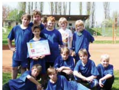
Chlapecké družstvo skončilo v Čelákovících čtvrté.

lo mezi sebou 9 chlapeckých družstev a 7 dívkách. V této obrovské konkurenci jsme obstáli na jedničku, hoši získali pěkné čtvrté místo a dívky po vypjatém boji vybojovaly místo první, přivezly škole krásný zlatý pohár, a postoupily tak do krajského kola, které se odehraje 15. 5. 2013 v Benešově. Radost i nadšení byly veliké, určitě k nim napomohlo i to, že vytrvale fandily obě dvě páté třídy a celý turnaj provázelo nádherné slunečné počasí.