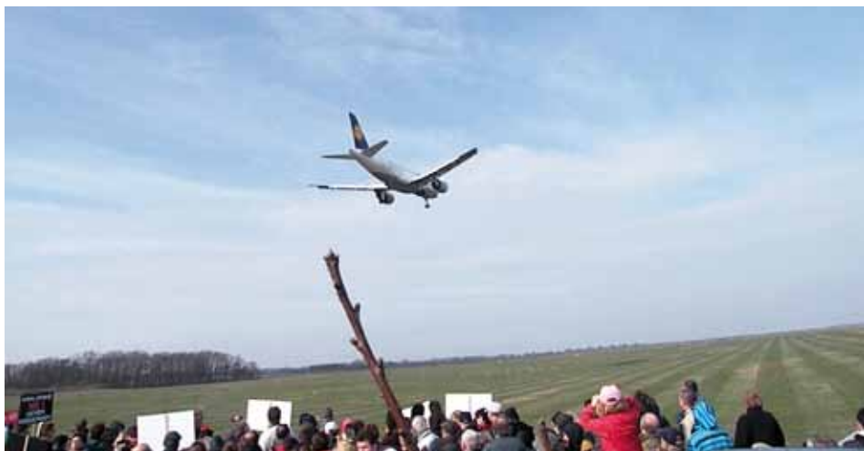
Z demonstrace při testovacích přeletech nad Vodochody (březen 2010).

Společnost Penta získala kladný posudek pro záměr rozšířit letiště ve Vodochodech. Veřejně projednání záměru se uskuteční v pondělí 17. června 2013 od 12 hodin na Zimním stadionu v Kralupech nad Vltavou. Bude to poslední příležitost ovlivnit proces EIA a zvrátit závěry posudku.