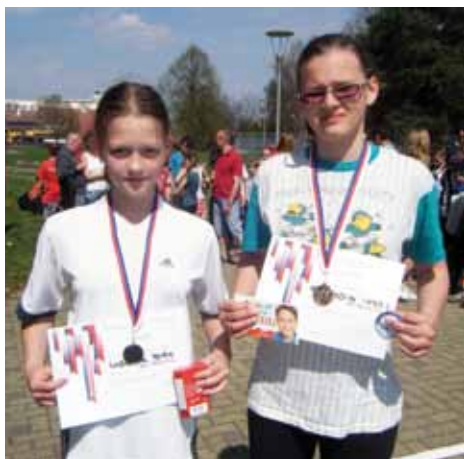
Vítězky okresního kola plavecko-běžecského poháru.