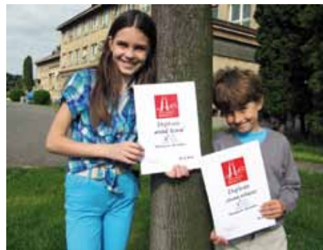
Líbeznické 1. a 2. místo v soutěži Macharův Brandýs.