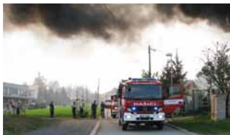
Scéna skoro jako z akčního filmu.

Dne 21. 4. 2013 bylo hlídkou OP přijato oznámení o požáru sběrného dvora v obci Líbeznice. Na místě bylo zjištěno, že došlo k zahoření plastového kontejneru. Hlídka obecní policie zajistila místo proti vstupu nepovolaných osob vzhledem k tomu, že docházelo k výbuchům zbytků barev umístěných v kontejneru. Následně se na místo dostavily jednotky HZS Neratovice a SDH Líbeznice, které v součinnosti provedli uhašení požáru. Šetřením na místě bylo od svědků zjištěno, že požár měli údajně založit nezletilé děti, které si hráli v okolí sběrného dvora. Událost si poté k dalšímu šetření převzali policisté z OO PČR Odolena Voda.