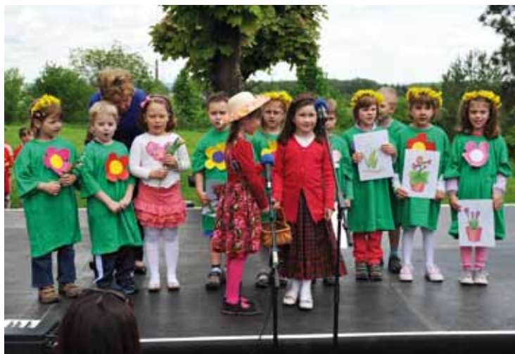
Vystoupení dětí z mateřské školy.