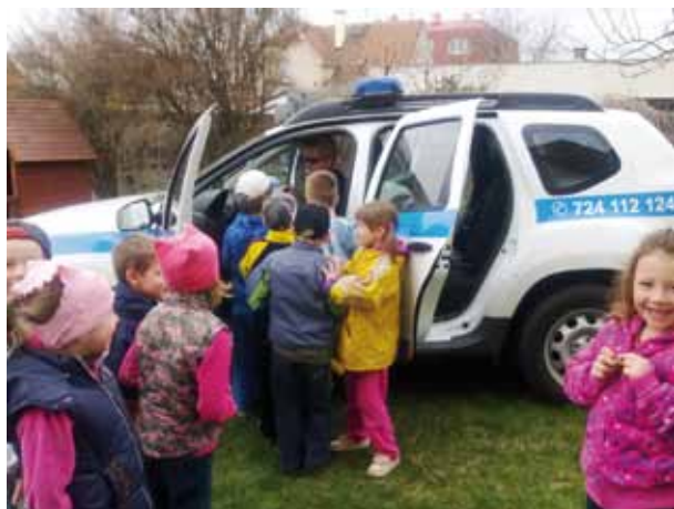
Policejní auto budilo zájem dětí i učitelk.