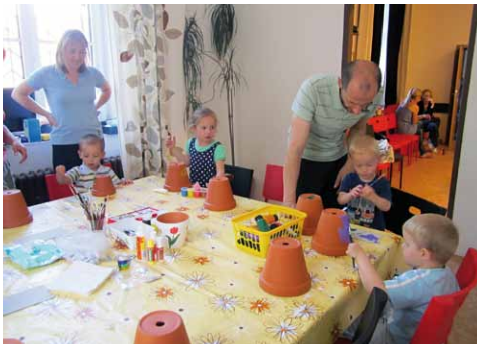
Malování květináčů.

I ti nejmenší se vzorně připravili na Den matek. V MC Lodička se ve čtvrtek 9. května malovalo na terakotové květináče a výtvary to byly okouzlující.