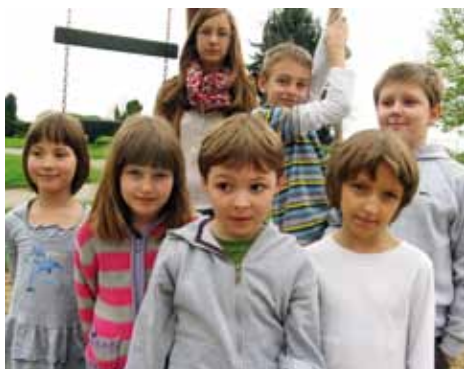
Úspěšní líbezníční výtvarníci.

Máme radost z jejich úspěchu a blahopřejeme!