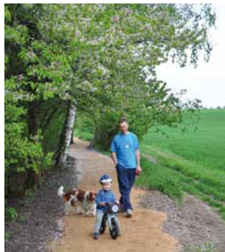
Procházka po nově upravené Mratínce.

Při jarní úpravě Mratínky vzalo za své několik šípových keřů a náletových dřevin. Obec se zavázala, že místo nich sem vysadí nové kvalitní stromy. V budoucnu by tuto cestu pro pěší do Měšic měly