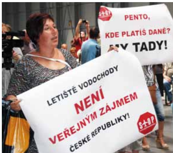
Hlasy proti letišti převažují.

Dlouho očekávané projednání dokumentace EIA pro záměr rozšířit Letiště Vodochody svolalo Ministerstvo životního prostředí nakonec na samotný střed prázdnin – na 23. července 2013.