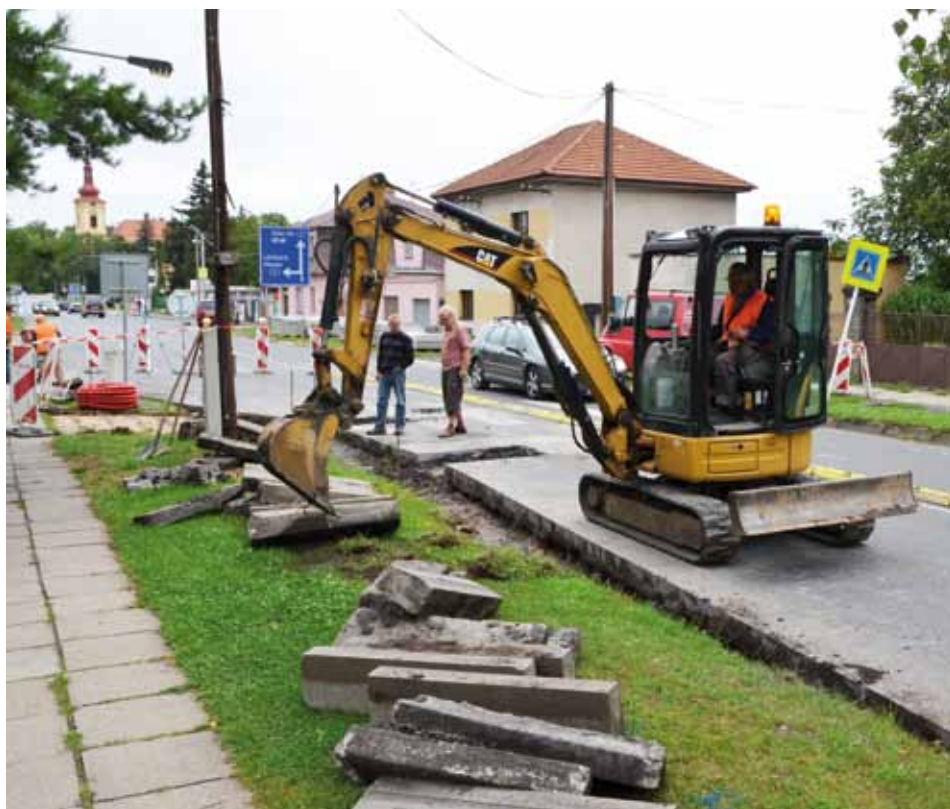
Přechod pro chodce u Mazlíčka bude do konce srpna bezpečnější.