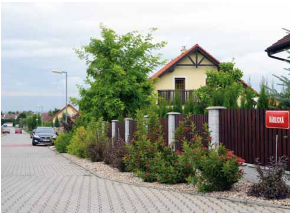
Jedna z nových líbeznických ulic nese název staré pražské čtvrti.

Velký rybník, který byl napájen vodou z Mratínského potoka, se nacházel v místech nynějšího sídla pohotovostního oddělení policie ČR. Jeho protější břeh byl zhruba před nynějším nákupním střediskem Globus. V těch místech se nacházel i podhrázecový mlýn, nazývaný Červený mlýn. Proč Červený? Jelikož jeho vlastníky byli Křížovníci s červenou hvězdou, kteří Ďáblický řádový statek vlastnili od roku 1253. Řád byl založen Anež-