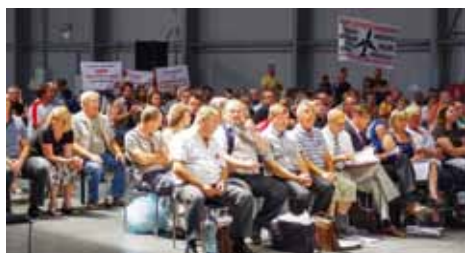
Atmosféra v hale byla místy vypjatá.

Ke slovu se dostávají zástupci obce Panenské Břežany. V jednom z nejpůsobivějších projevů předklá-