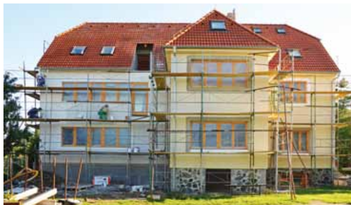
Budova MŠ 15. srpna.