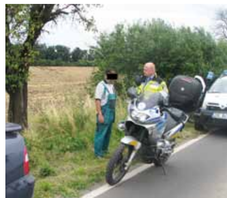
Řízení pod vlivem alkoholu se řidiči nevyplatilo.

li házet a při té příležitosti z nudy zbořili již poškozenou zeď. Mladíci způsobenou škodu odpracovali při opravě zdi.