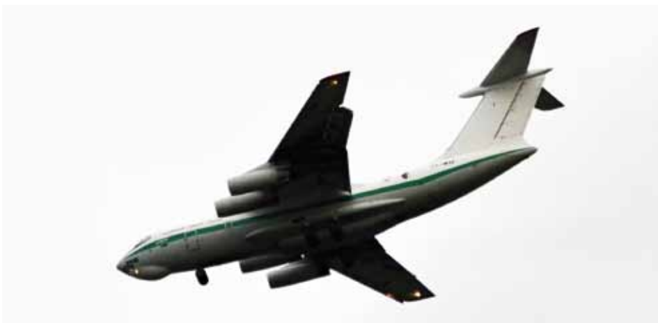
IL 76 přistával nad Líbeznicemi 16. 9. v 8:01 hodin.

Že se uvedené podmínky netýkají jen nových budov, ale i objektů stávajících, pak naznačují některé zákony. Tak třeba zákon č. 258 z roku 2000 o ochraně veřejného zdraví složitými větvami říká (v § 31 odst. 3), že u bytových domů, rodinných domů, staveb pro školní a předškolní výchovu, staveb pro zdravotní a sociální úče-