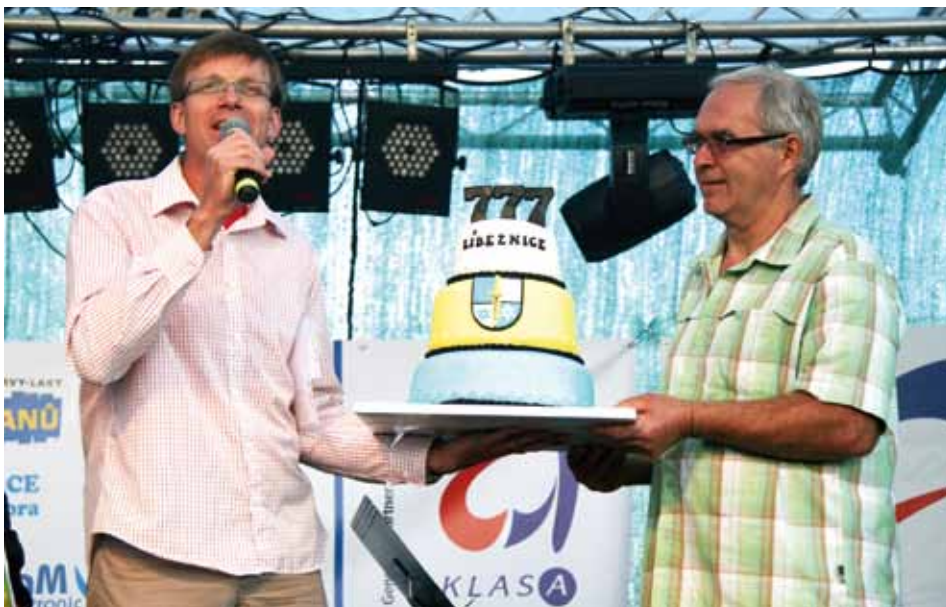
Došlo i na předání obecního narozeninového dortu.

Nabídka umělců, známých, méně známých, šikovných, méně šikovných byla i letos bohatá. Nemá cenu zde jmenovat všechny, kdo vystoupili a hodnotit kvalitu jejich vystoupení. Pro mě osobně jen škoda, že tam nebylo více živé muziky. Počet návštěvníků, kterých bylo alespoň pohledově mnohem více než loni, jasně vypovídá o tom, že známá jména táhnou. Sympatické bylo také množství výstupů mezi muzikou, program byl nadupaný a snad každý si vybral, co je mu nejbližší. Je vždy těžké se zavděčit všem, různorodost nabízeného programu se o to bezesporu snažila.