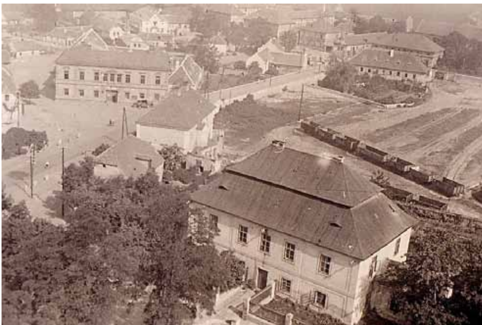
Pohled z kostelní věže na faru a bývalý cukrovar mezi světovými válkami.

Osídlení katastru Líbeznic v povodí Makůvky je pravěké. První obyvatelé se usazovali na rovinatém a úrodném výběžku polabské roviny, který směrem jižním přechází ve Středočeskou pahorkatinu. Ze západní části byli chráněni lesem, který se táhl z dnešního Proseka přes Ládví až k Panenským Břežanům. Živila je úrodná černozem, kterou těžce získávali, byla pro ně posvátná. Současná poloha obce je výsledek tzv. vesnické kolonizace. Od pravěku procházely Líbeznici obchodní cesty, čile se zde obchodovalo. Jedna obchodní cesta vedla odtud směrem na Mělník, Litoměřice, Ústí nad Labem až do Míšně a dále na sever. Další pak na Lužici, Polsko, k Baltickému moři. Víme, že ve středověku obec patřila Vyšehradské a Pražské kapitule jako hospodářská jednotka, která je zásobovala potravi-