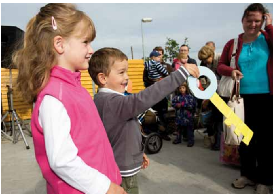
„Máme ho!“ Děti převzaly symbolický klíč od nové školky.

Mateřská škola prošla v rekordně krátkém čase kompletní rekonstrukcí. Díky přístavbě má navíc o 30 míst více.