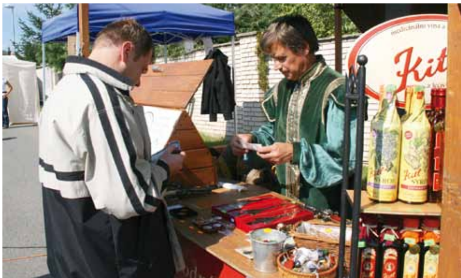
Ražení pamětních mincí s třemi sedmičkami.

Hlavním partnerem letošního jubilejního Posvícení byla značka Klasa. Ve stánku v horní části prostranství si tak návštěvníci posvícení mohli pochutnat na kvalitních potravinářských výrobcích s označením Klasa.