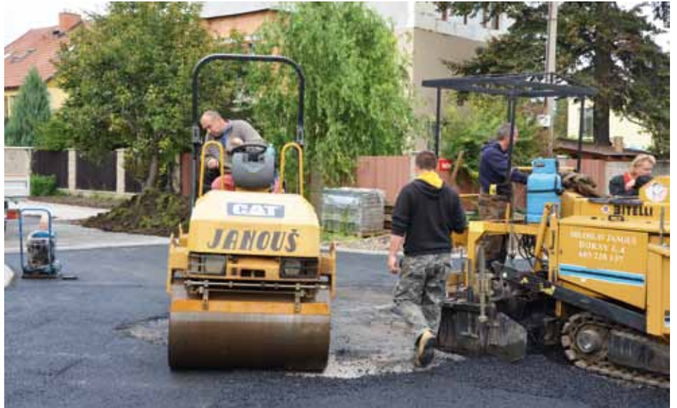
Práce na nové podobě křižovatky ulic Seifertova a Pražská.