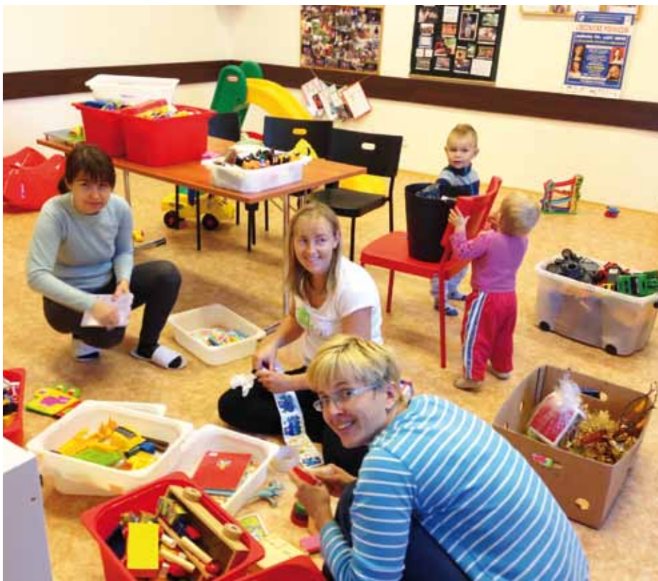
Společný úklid na palubě Lodičky.

Prázdniny utekly jako voda nejen školou povinným a jejich rodičům, ale i nám, správcům Lodičky. Bylo třeba přichystat program na novou sezónu, zjistit stav posádky, spočítat příjem a výdej a v neposlední řadě zkontrolovat vybavení mateřského centra. První setkání se uskutečnilo nad drinkem v Katranu a mělo za cíl vymyslet náplň a program do letošních Vánoc. Za další dva dny, dopoledne a některá z nás i s malým pomocníkem, jsme se vybaveny dezinfekcí, hadry, kbelíky, tepovači koberců a nelístostí k (polo)rozbitým hračkám sešly přímo na místě činu v Komunitním centru Archa a 3 hodiny gruntovaly. Milí rodiče, věřte, že hračky poškozené jsou pryč, ty co zůstaly, jsou vyprané, umyté a funkční, koberce vyteповané, zásoby kávy a čaje doplněné, a naše pětka se na vás velmi těší.