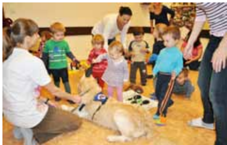
Nejklidnější psi kamarádi na světě.