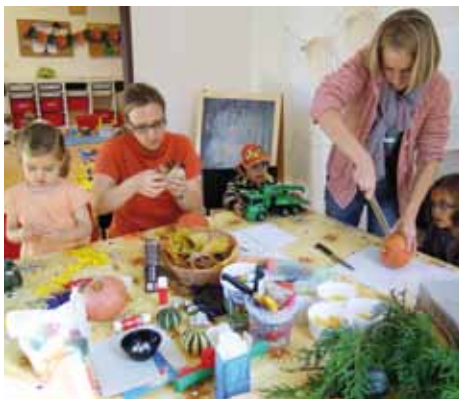
Halloweenové nadšení v Arše.

Čarodějnické klobouky, škrabošky, hudba a dobrá nálada, to vše patřilo dne 30. října k zahájení Halloweenové Party v Lodičce.