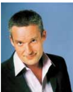
Vláda Hron.

Líbeznické divadlo připravilo pro místní občany dvě hostující představení pro dospělé. A obě budou premiéry!!!