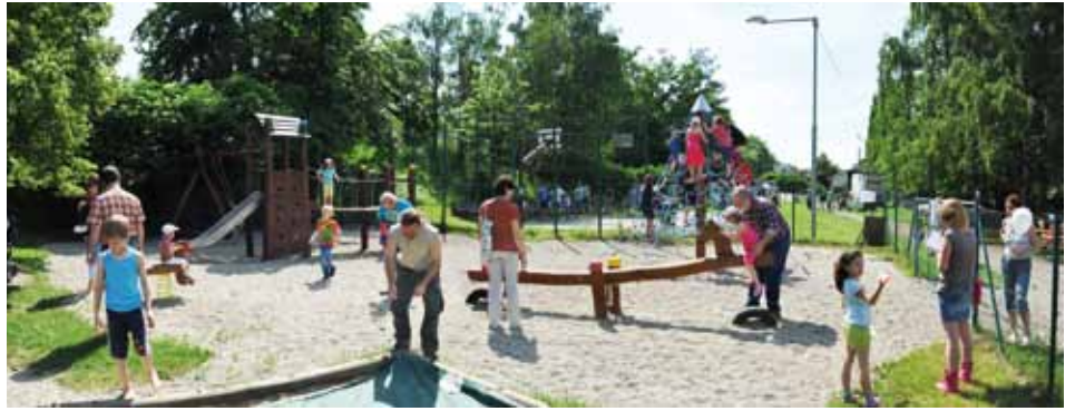
Z letošního otevření dětského hřiště v Arču

Ale skutečných peněz bylo vždy pomálu. Finančně se sháněly porůznu. Nějakou korunou přispěly