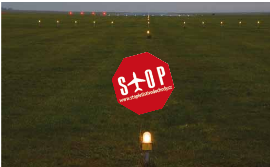
Budou tu za pár let přistávat Boeingy?

Ministerstvo životního prostředí vydalo v úterý 29. října souhlasné stanovisko EIA pro záměr společnosti Penta rozšířit Letiště Vodochody. Starostové obcí a měst se postavili proti. Podávají ministrově návrh na zrušení tohoto rozhodnutí. Zároveň se obrátí se stížností na proces EIA na Evropskou komisi.