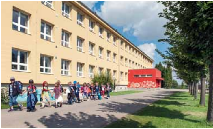
Líbeznická škola v novém kabátě.

Předpokládáme, že při současném vývoji dětské populace v Líbeznících i okolních obcích budeme potřebovat již od září 2015 dalších nových 6 tříd. Do stávající budovy se zcela jistě nevejdou. Hovořila jsem o tom již s vedením obce a to