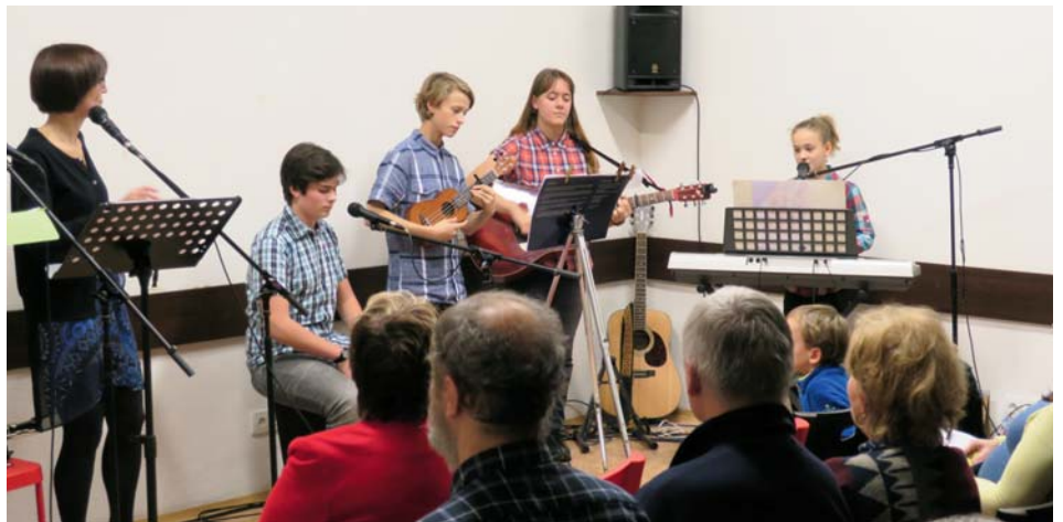
Adventní muzicírování v Arše