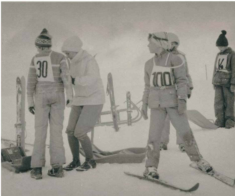
Skoro jako Hanč a Vrbata

„Osmdesátky“ přinesly do středoškolských kurzů i výuku běžecého lyžování. To byla teprve paráda. Ruské dřevěné lyže Visu Extra, pérové vázání, kožené boty se třemi dírkami do vázání, bambusové hůlky se zahnutou špičkou a pochopitelně