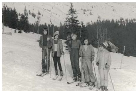
Krkonoše jasné, hory naše krásné

Přelom osmdesátých let už přinesl pokrok do lyžařského vybavení, kožené boty vytlačily plastové přezkávče značky Botas nebo Alpina ideálně v kombinaci oranžovomodré, hůlky duralové z Dřevotvaru Znojmo, vázání Marker se sichrákama – bezpečnostní řemíčky, kterými byly přivázané lyže kolem našich nohou (to u těch sportovněji založených jedinců, ti méně zdatní měli novinku v podobě deskové vázání Salomon, které po pádu a vypnutí lyže zůstalo celé na botě jako plastová podrážka), na lyžích Artis či Sulov české provenience, polské Polsparty a jugoslávské Elan (jó Elanky a poctivě vystátá fronta v Pragoimpu na Václaváku; pravda trochu byly někdy lyže do vrtule a muselo se vybírat z více párů, ale pak ten pocit ve frontě na vlek byl k nezaplacení). Hrany lyží už byly zalité ve skluznici. I lyžařská móda se vylepšila – šponovky s vycpanými koleny a bunda značky Toper doplněná koženými prstovými rukavicemi. Brýle značky Okula („co měl každý bambula“) nahradily Alpiny. A v Lovně se daly koupit první nášlapné brzdičky.