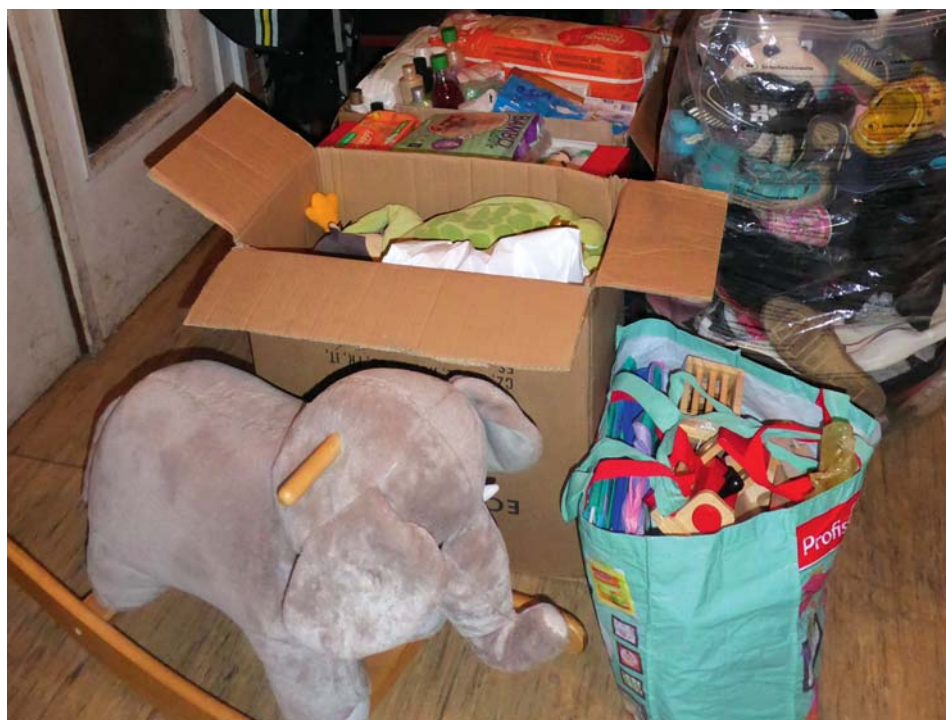
Připraveno do dětského domova