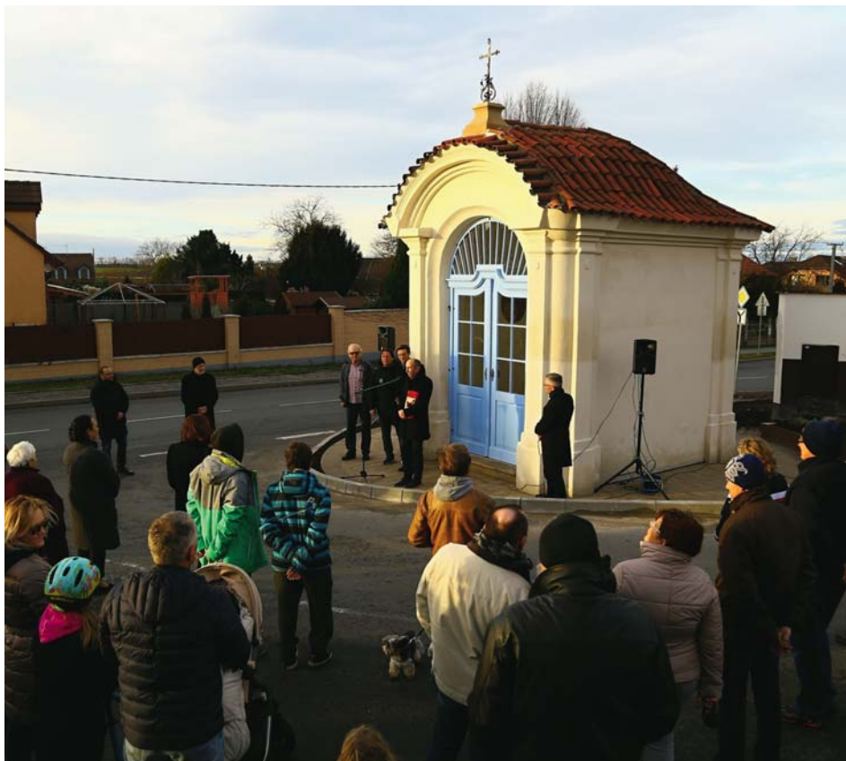
Na Silvestra před kapličkou