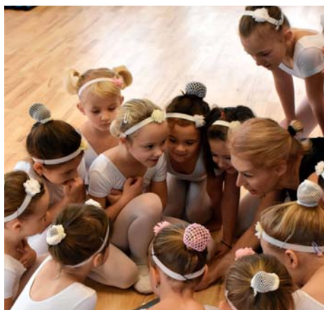
Klubko malých tanečnic