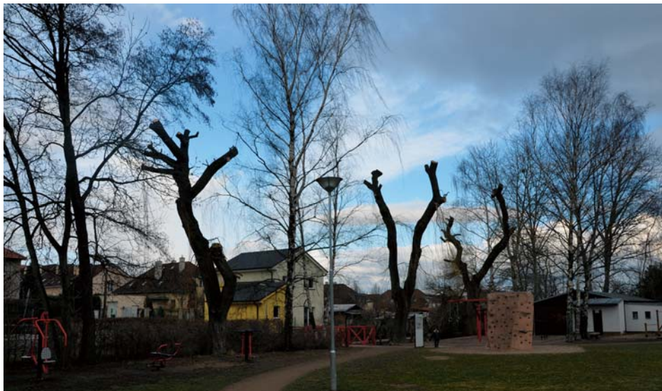
Bezpečnostní prořezání smutečních vrb v Arču

Chudák alergik, že? Pylový útok kvetoucích stromů střídá pyl rozkvetlé trávy a sušení sena přináší explozivní kychy téměř polovině naší populace. A tak se stává, že mladinká smuteční bříza či první kvetoucí stříbrný smrček musí opustit zahrádku.