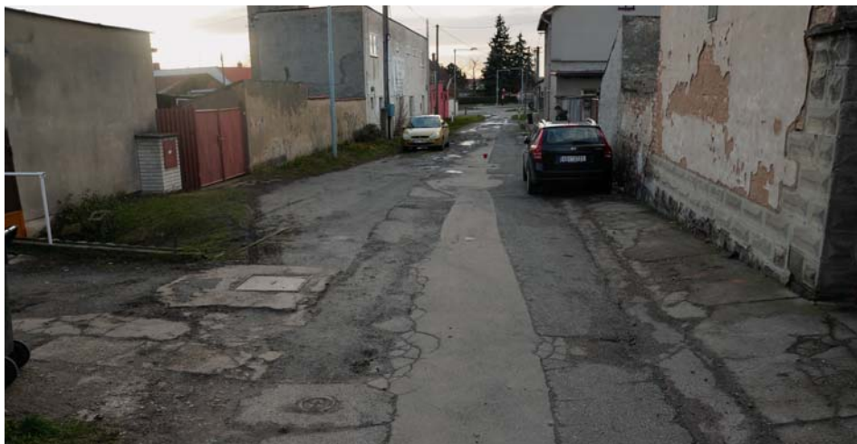
Líbeznická ulice 21. století