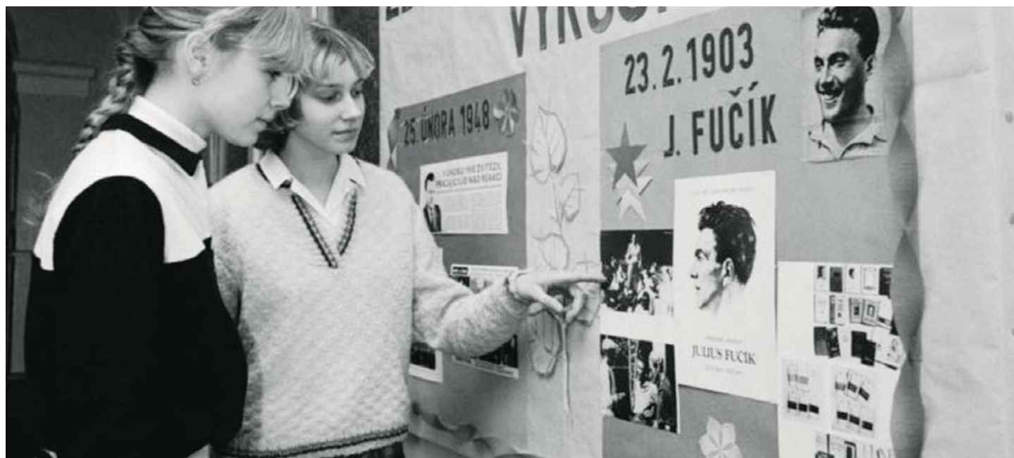
Žákyně a nástěnky