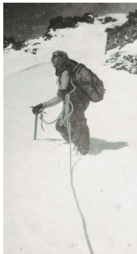
Výstup po ledovci