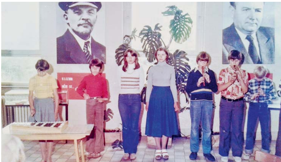
Vystoupení žáků k oslavě VŘSR

Společně vytvořili delegaci a s kyticemi odešli na místní hřbitov, kde položili kytice na hroby ru-