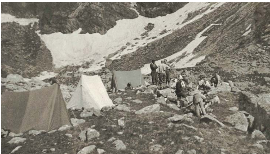
Základní tábor ve Vysokých Tatrách

Jizerka a horolezec je zajímavé spojení, zvláště přidá-li se název Jizerská padesátka, jejíž trasa vedla kousek od naší chalupy. V loňském roce se uskutčnil její jubilejní 50. ročník. Uběhlo padesát let od doby, kdy si parta horolezců z Liberce uspořádala v lednu 1968 závod na 50 km jako součást sportovní přípravy. V roce 1970 se závodů zúčastnilo i 14 členů „Expedice Peru '70“. Horolezecká expedice, která bohužel skončila tragicky. V květnu všichni členové zahynuli pod lavinou kamení na