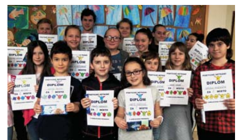
Děti, které se umístily na 1. až 3. místě