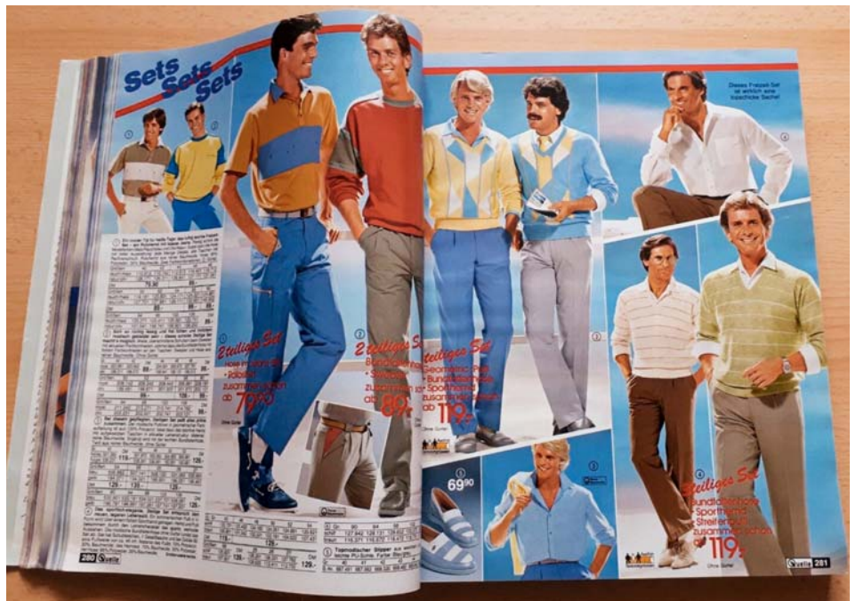
Zásilkový časopis Quelle