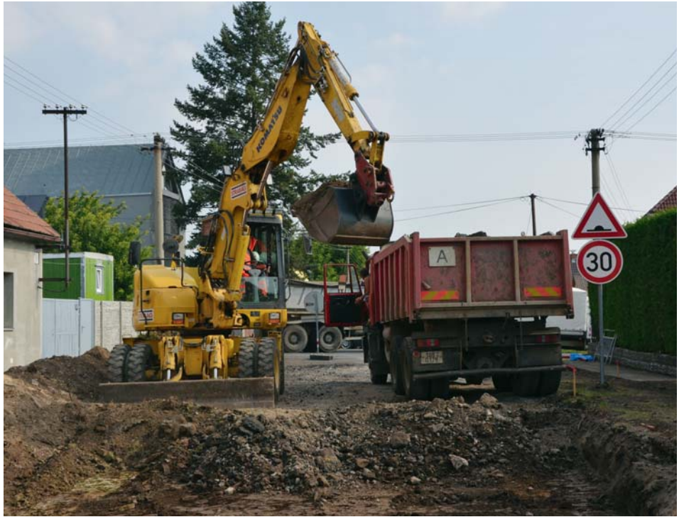
Rozkopaná Pražská ulice

V polovině července vyjela konečně stavební technika do ulice Pražská. Nejprve zahájili svou činnost dřevorubci, kteří odstranili nejen přestálé stromy, i ty nemocné, a za obět oprav padly i některé zdravější kusy. Vesměs se jednalo o stromy vzrostlé, které však by čekalo na podzim radikální prořezání ze strany správců elektrické sítě. A jak takový sestřih vypadá, to si jistě každý dokáže představit. Není nutné se ale o zeleň bát, projekt počítá s výsadbou nových a do uličních prostor vhodnějších stromů.