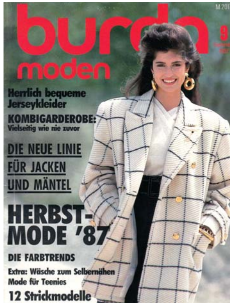
Módní časopis Burda

Kromě šitých modelů do města jsem obluzovala v běžeckých stopách na Jizerské louce pletenými kamašemi. Maminka vlastnila úžasný pletací stroj Dopleta a na něm mi ze zbytků ružnobarvených vln upletla barevně pruhované kamaše. Přes ně bílé lyžařské podkolenky a vzhůru do stopy. I na sjezdovkách jsem v nich jezdila místo klasických šponovek; měly jen jednu malou vadu v tom, že po pádu jsem se obalila sněhem jako sněhulák, a když sníl tál, tak jsem byla pochopitelně mokrá až... Starší bratr se chlubil kamašemi antracitovými a před promóčením si pod ně oblékal pogumované šustáky. Pochopitelně také domácí výroby. I na trojhré lyžařské čepice se dostalo, jen strašně kousaly.