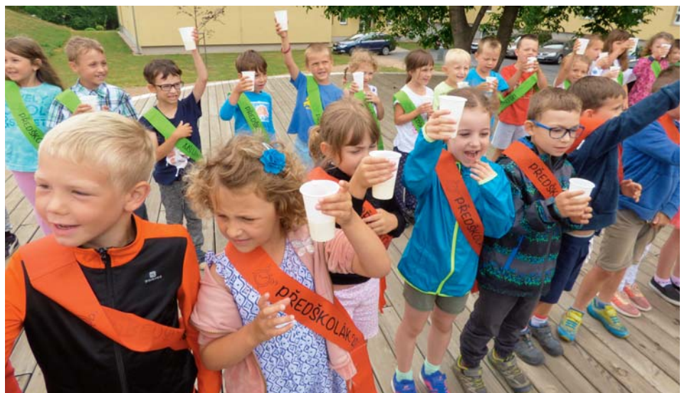
Předškoláci si připili na rozloučenou se školkou

S nastávajícím koncem školního roku je tradičně spojen i ozdravný pobyt dětí předškolního věku. Letošní rok jsme se opět vypravili do malebných koutů jižních Čech. Ubytování jsme našli v překrásném penzionu Alešův dvůr nedaleko Chlumu u Třeboně. Při vycházkách se nám tak naskytl pohled na mnoho zdejších rybníků. V okolních lesích si děti užily spoustu radosti a zážitků ze hry. Celý náš pobyt byl pojat na téma „Indiánské dobrodružství“. A protože tyto dny patřily k mimořádně teplým, dopoledne jsme se většinou schovali do stínu pod přístřešek a věnovali se tvoření indiánských oděvů, čelenek nebo doplňků. Plnili jsme úkoly zadané náčelníkem zdejšího kmene. Každý večer si malí indiáni své zážitky kreslenou formou zachytili do deníčku. Poslední den pobytu se bohužel děti návštěvy náčelníka nedočkaly, ale vše bylo vynahrazeno nalezením pokladu. Všichni odjžděli opálení, plní dojmů, nezapomenutelných zážitků a se sáčkem vydělaného zlata.