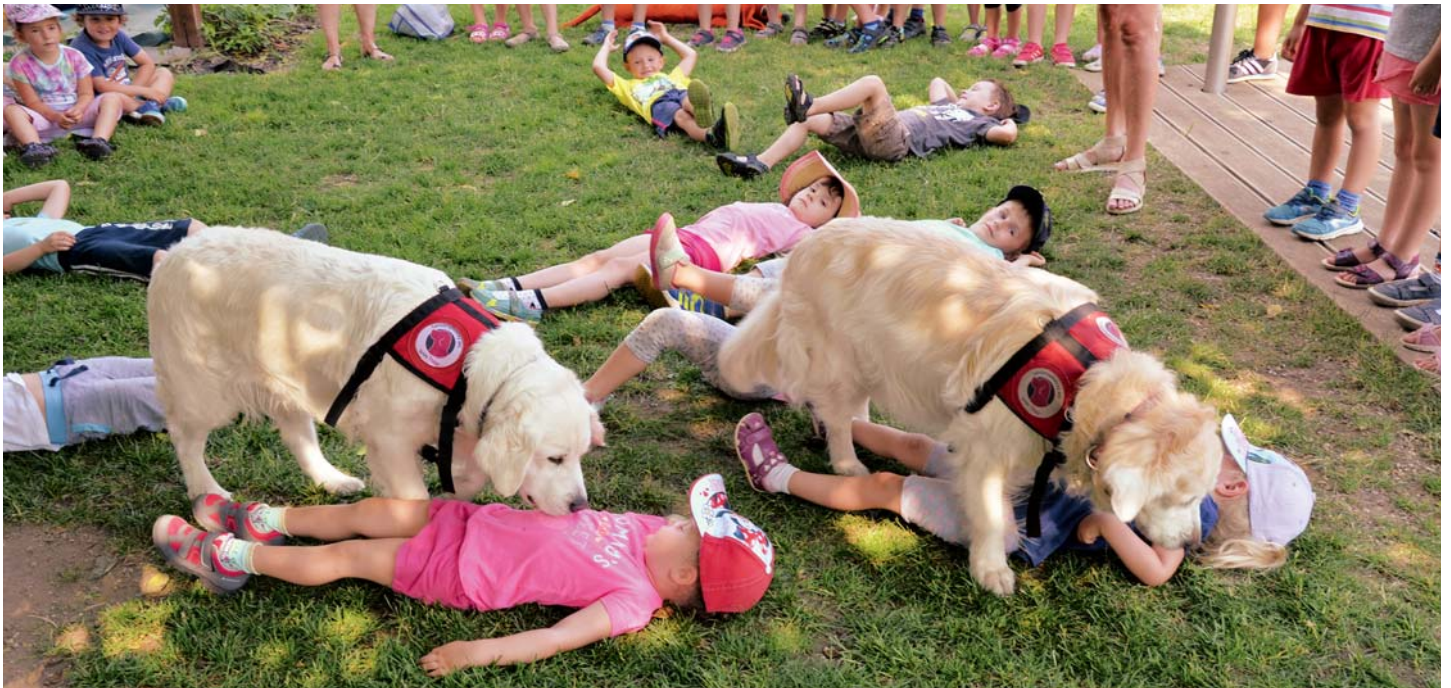
Psí návštěva v MŠ