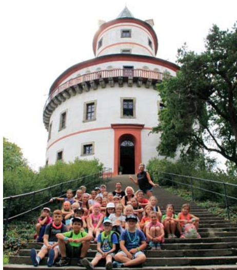
Výlet na zámek Humprecht