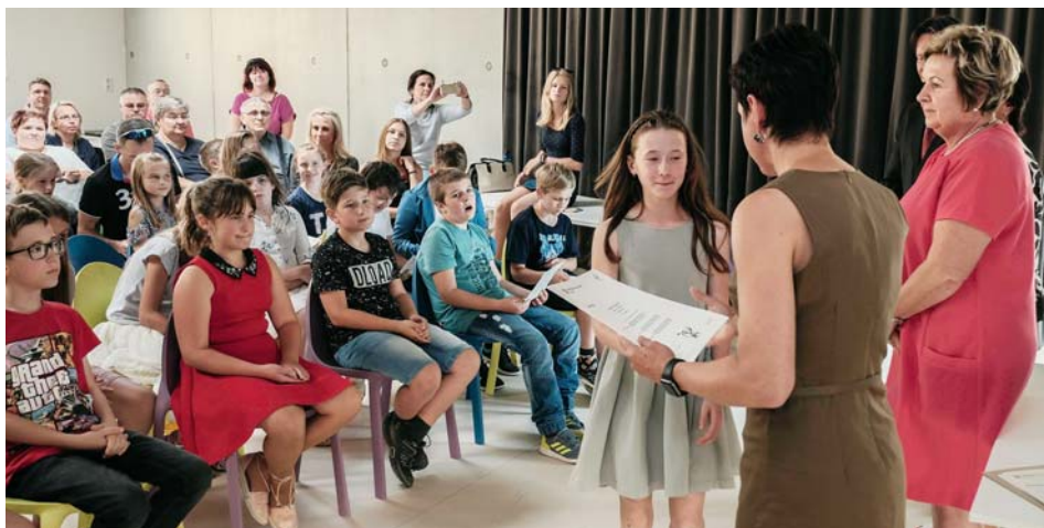
Předávání certifikátu úspěšným žákům

Děti měly možnost se na zkoušky po celý školní rok připravovat na kroužcích Živé angličtiny, a to ve třech úrovních pokročilosti: Starters, Movers a Flyers. Samotné zkoušky se potom konaly na půdě naší školy dne 12. 5. 2018. Toho sobotního rána se dostavilo do školy 45 dětí a 3 zkoušející z British Council, tedy organizace, která zkoušky zastřešuje. Děti čekalo náročné dopoledne. Musely totiž samostatně prokázat své znalosti angličtiny hned ve třech oblastech: porozumění poslechu, porozumění psanému textu a schopnosti mluvit. Zvláště poslední disciplína byla pro mnohé děti hodně náročná. Byla to pro ně totiž první příležitost, kdy musely tvářit v tvář přibližně 5 minut hovořit anglicky s někým, kdo vůbec neovládá češtinu. V místnosti bylo se zkoušejícím každé dítě