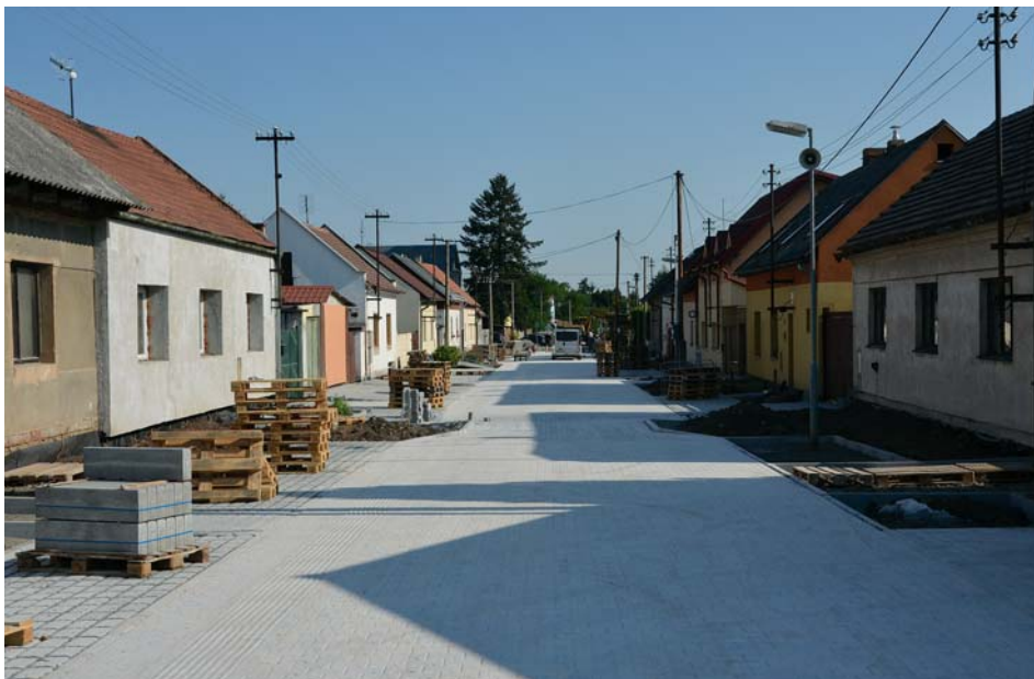
Dokončovací práce 1. úseku

Horké, suché léto je sice pohromou pro přírodu, ale balzámem pro stavební firmy. Dlouho očekávaná a ještě delší dobu odkládaná rekonstrukce Pražské ulice je v plném proudu. Rozdělení stavby na několik funkčních etap pomohlo vyřešit problémy s parkováním automobilů obyvatel ulice mimo stavbu. Práce začaly od ulice Františka Košiny a první etapa skončí u zvýšeného přechodu na ulici Jaroslava Seiferta. Vzhledem k úzkému uličnímu prostoru zde vznikne tzv. smíšená zóna, kdy se na vozovce budou pohybovat auta i chodci. Uměle zúžená část