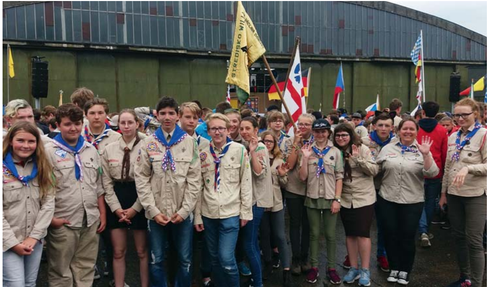
Skautští účastníci Intercampu

K večeru jsme se přesunuli na letiště u města Sint-Truiden, kde se konal Intercamp. Postavili jsme si stany, uvařili večeri a těšili se na společný program. Děti ze všech zúčastněných evropských zemí byly rozděleny do skupin po 18 dětech, z každého oddílu po dvou, a ke každé skupině byli přiděleni dva až tři vedoucí. Během víkendu plnily děti v těchto skupi-