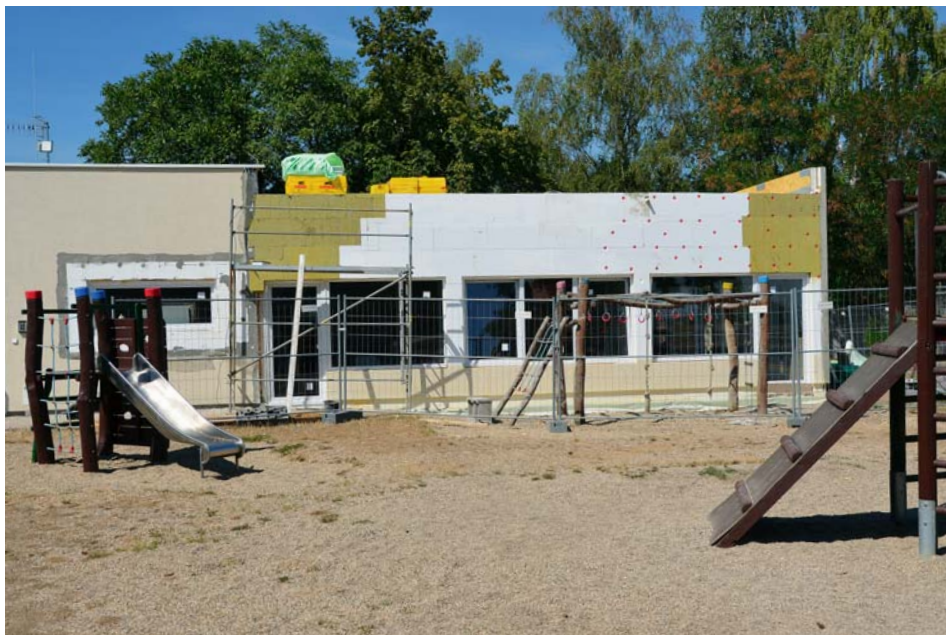
Rozšíření pavilonu MŠ