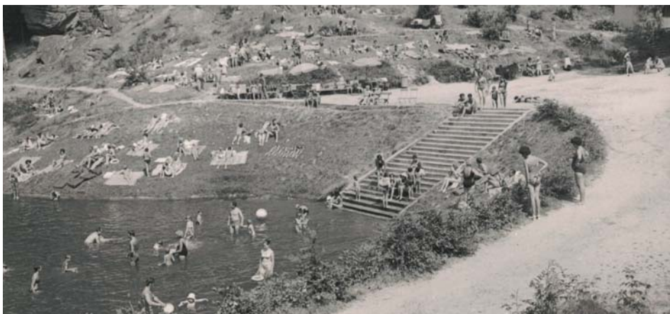
Přírodní koupaliště ve Skaláku v Českém ráji