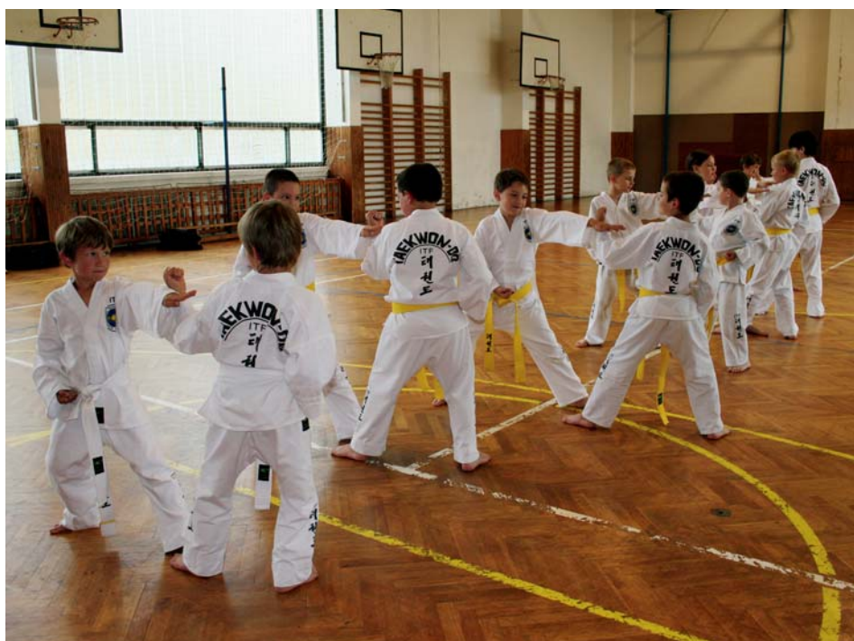
Taekwondisté při tréninku