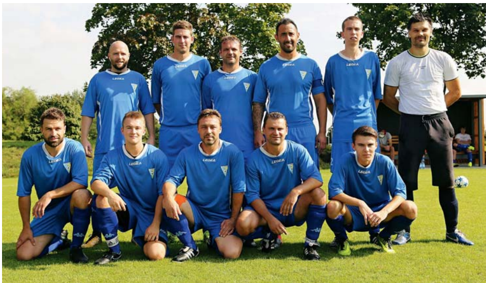
Líbeznický fotbalový tým