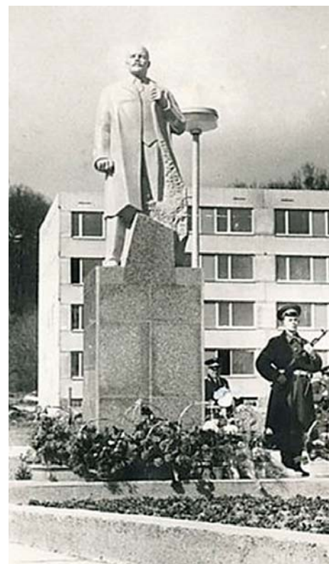
AD Pomník v Milovicích