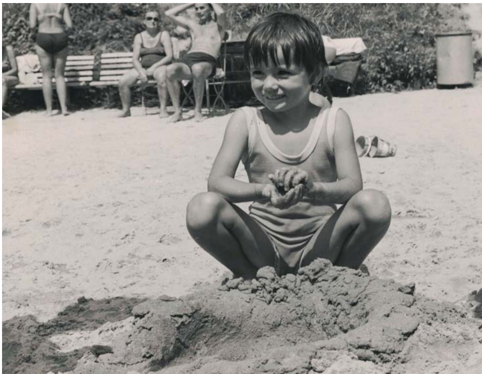
Stavění z písku na pláži – oblíbená činnost

A když jsme u těch pádů do vody. Co Čech, to nejen muzikant, ale i vodák. Zvláště když jeho rodiče trávili bezdětné letní dovolené na českých i slovenských řekách. Skládací kajak, vlastnoručně vyrobená laminátová kánoe a hlavně místo v pražské loděnici na Smíchově. Často nás tatínek bral na odpolední vyjížďky po Vltavě, kdy jsme obeplovali Veslařský ostrov u Dvorců, houpali se na vlnách projíždějícího kolesového parníku Děvín pod Vyšehradem nebo projížděli přístavem plným hausbótů v „háfnu“ za Cindou neboli ostrovem Císařská louka. No a všechny nabitě vodácké zkušenosti jsme zúročili na týdenním splouvání Berounky. Stanáčko pro čtyři osoby, nafukovací třídlíné matrace, horolezecké spacáky mumie, čutory na pití, konzervy, plynová bomba s dvouplátňovým vařičem, hliníková konvice s esusy – všechno pěkně zabalené v lodních pytlích. Já byla háček na tátové lodi, můj starší bratr byl na zadáku a háčka mu dělala máma. Dodnes slyším svého třináctiletého bráču, jak v pa-