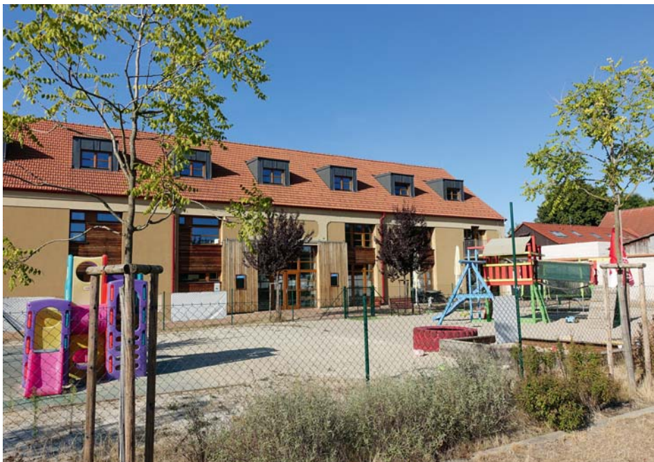
Centrum volného času v Měšicích

Už počtvrté nabídneme mladším školákům kroužky v Klubu Zaškolák. A protože víme, jak náročná byla i letos situace s umístěním všech dětí ze spádových obcí v ZŠ Líbeznice, domluvili jsme se s vedením školy na ještě intenzivnější spolupráci v oblasti volnočasových aktivit. Na kroužky proto budeme vozit děti dvakrát týdně – v úterý a ve čtvrtek. Nabídku kroužků jsme také rozšířili. V pohybových kroužcích kromě velmi žádaného juda pro začátečníky i pokročilé nabídneme také všestranné pohybovky pro kluky a holky, dětskou jógu, gymnastickou přípravku, tanečky pro kočky, street dance a také základy baletu a scénického tance. Opět otevřeme kroužky počítačové, legohraní, veselého kuchtění. Do nabídky jsme nově zařadili i Jedu Edu neboli stavění zajímavých robotických modelů z lega, kroužek pro malé šikulky Šikovné prstíky a turistický kroužek. Samozřejmě opět bude vyzvednutí dětí v družině, doprava autobusem pod dohledem „autobusové babičky“ a návrat dětí (podle pokynů rodičů) zpět do družiny. Již v průběhu prázdnin jsme dali rodičům šanci projevit přes on-line formulář předběžný zájem o kroužky