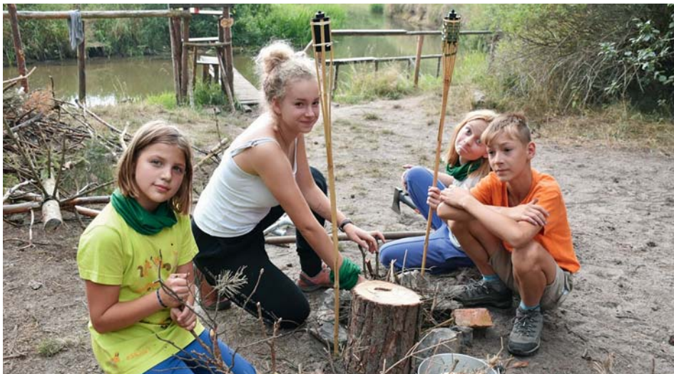
Trosečníci v akci

Během svízelných chvil trosečnickům pomáhal a radil domorodý šaman. Trosečníci se každý den učili něco nového a osvojili si dovednosti pro přežití na pustém ostrově nezbytné. Až do chvíle, kdy tábor napadli piráti a unesli několik dětí včetně ša-