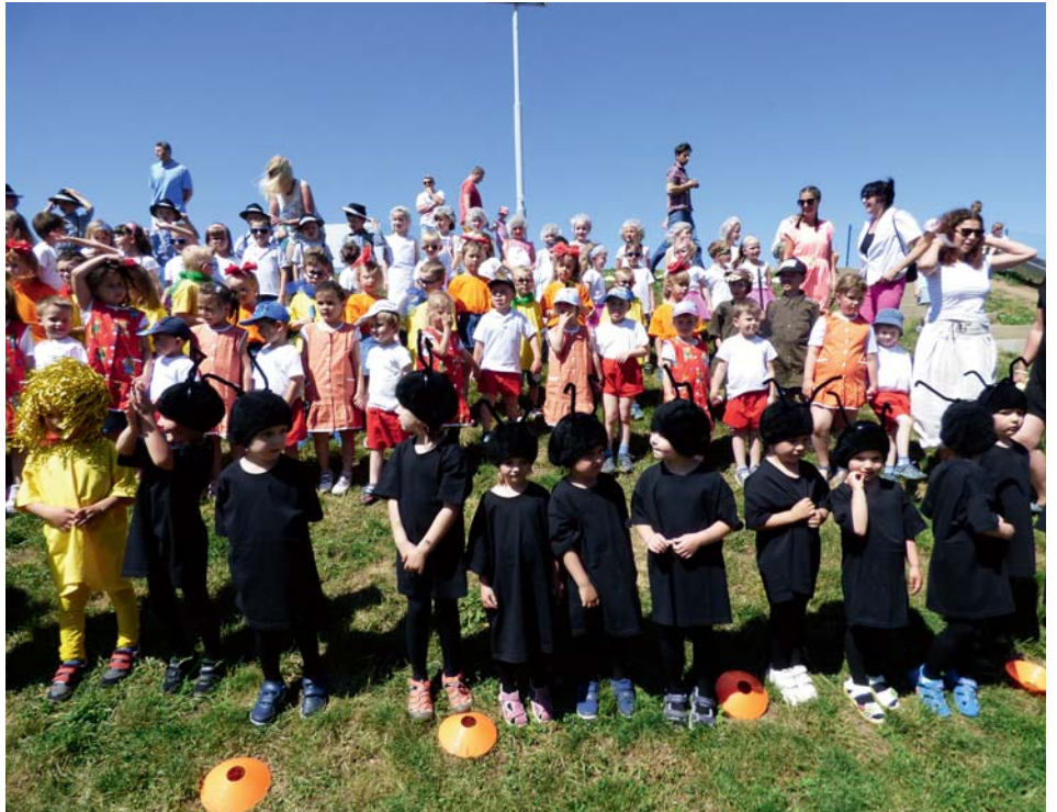
Závěrečná píseň pro maminky k svátku

Na konci května se budova Bezinka vypravila na celodenní výlet na zámek Dobříš. Druhá budova