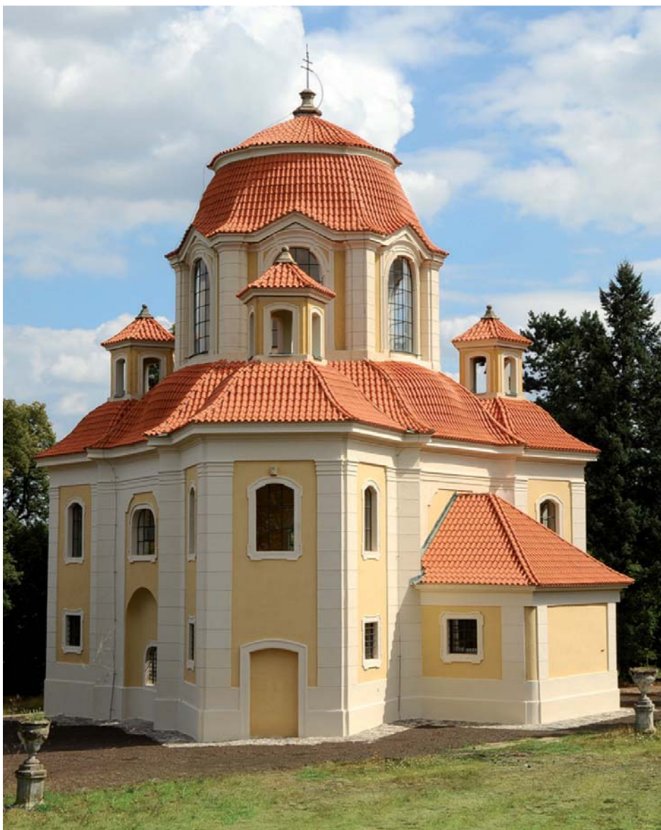
Kaple sv. Anny v Panenských Břežanech

Na následující zastávce v Měšicích máme možnost obdivovat jiný barokní architektonický skvost – zámek rodiny Nosticů postavený stavitelem A. Haffeneckerem v letech 1767–1775. Antonín Haffenecker jakožto dvorní stavitel rodu Nosticů se podílel také na úpravě jejich pražského paláce nebo na výstavbě Stavovského divadla (původně Hraběcí Nosticovo divadlo). S dokončením stavby zámku se pojí i technický unikát. Roku 1775 byl na budovu umístěn první hromosvod v Čechách (podle konstrukce Benjamina Franklina). Unikátní jsou i věžní hodiny z roku 1774, které zhotovil proslulý pražský královský hodinář Sebastian Londsperger, jenž se dlouhá léta staral o hodiny na katedrále sv. Víta.