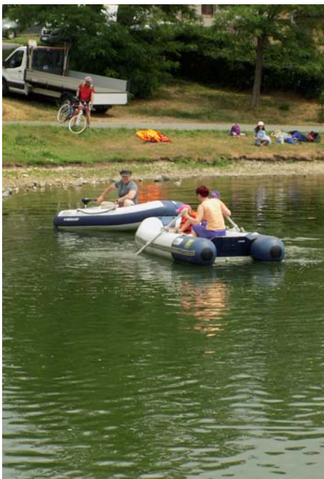
Závody rodičů i dětí