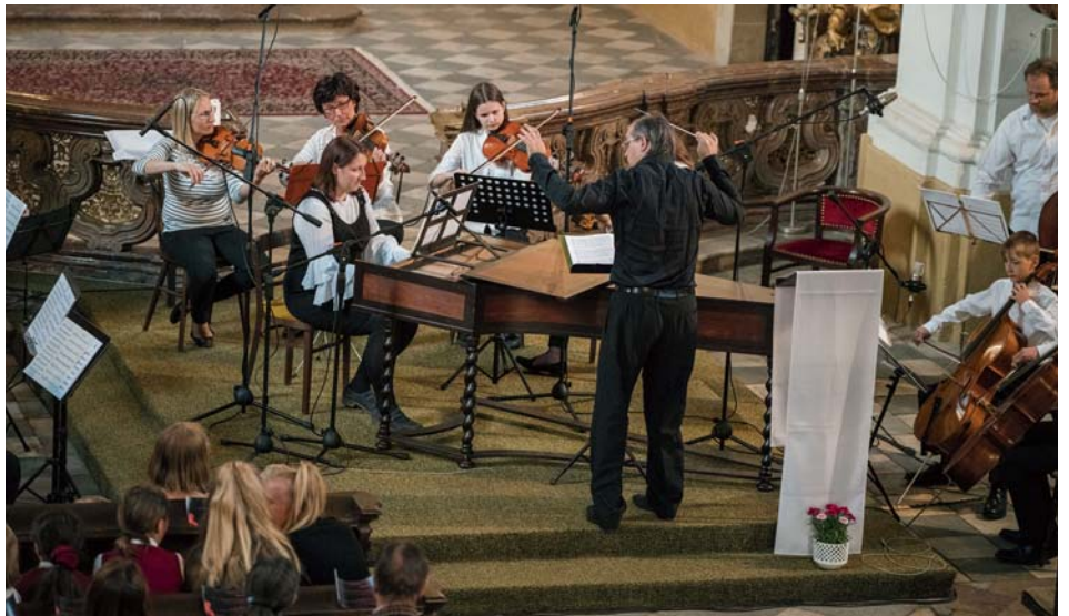
Líbeznický komorní orchestr