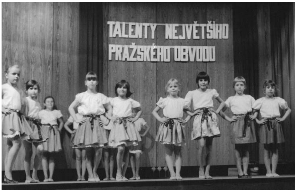
Holčičky tančící lidové tance

Jako jsem se netešila na klavírní přehrávku, o to víc jsem se nemohla dočkat vystoupení baletní školy profesorky Dolečkové, kde jsem strávila dlouhá léta taneční přípravou. Nesmějte se, fakt! Prošla jsem si přípravkou i klasickým baletem včetně baletu na špičkách a skončila svou kariéru v 7. třídě základky stepařským vystoupením. Krásná skladba z Labutího jezera, kterou nás doprovázela klavírní korepe-