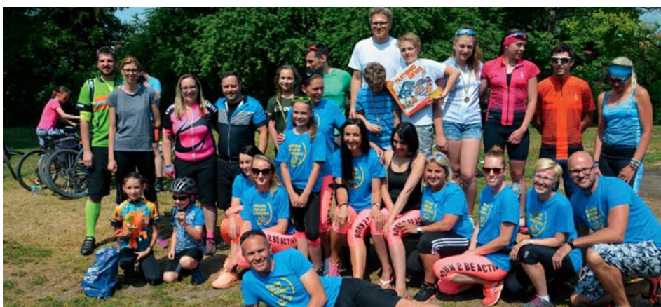
Cyklisté v cíli