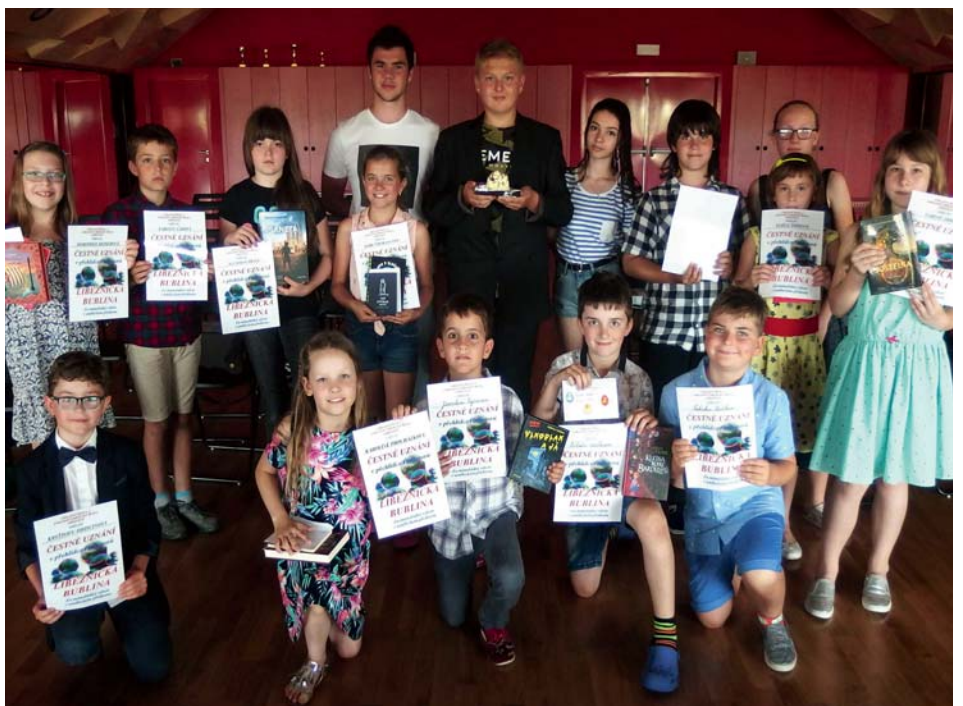
Recitují dobře, recitují rádi