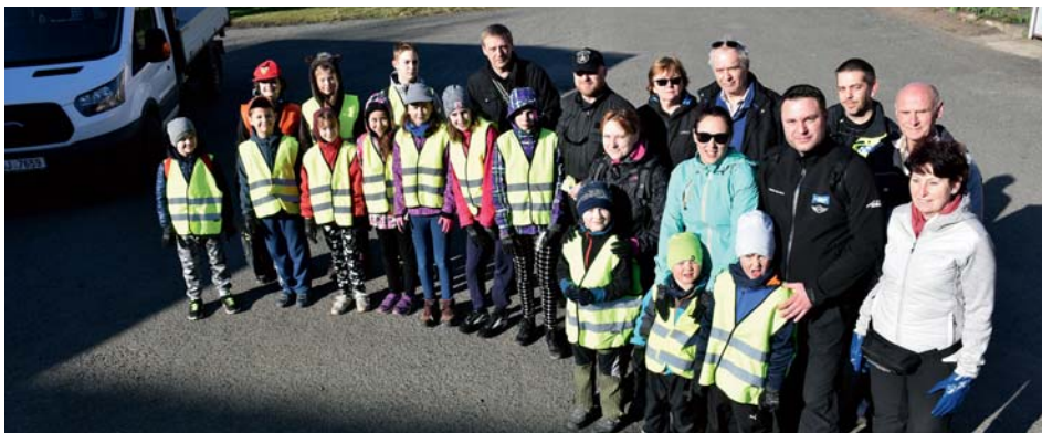
Uklízet vyrážejí nejen Mladí strážníci

Kde jinde začít uklízet než tam, kde žijeme. Proto jsme se v rámci této akce ujali úklidu Líbeznic a jejich blízkého okolí. Celkem se sešlo přes 80 účastníků, přičemž většina byly děti. Skupina pod vedením Mladého strážníka v počtu 25 dobrovolníků se vydala čistit okolí směrem na Baš a Beckov. Druhá početnější skupina pod vedením skautů v počtu 55 dobrovolníků se rozdělila na několik menších skupin, které zajistily úklid Arča, koryta potoka Mratínka a jeho blízkého okolí, pěší cestu z Arča do Měšic (po žluté), okolí silnice do Hovorčovic a nelegální skládku u teplovodu. Je až