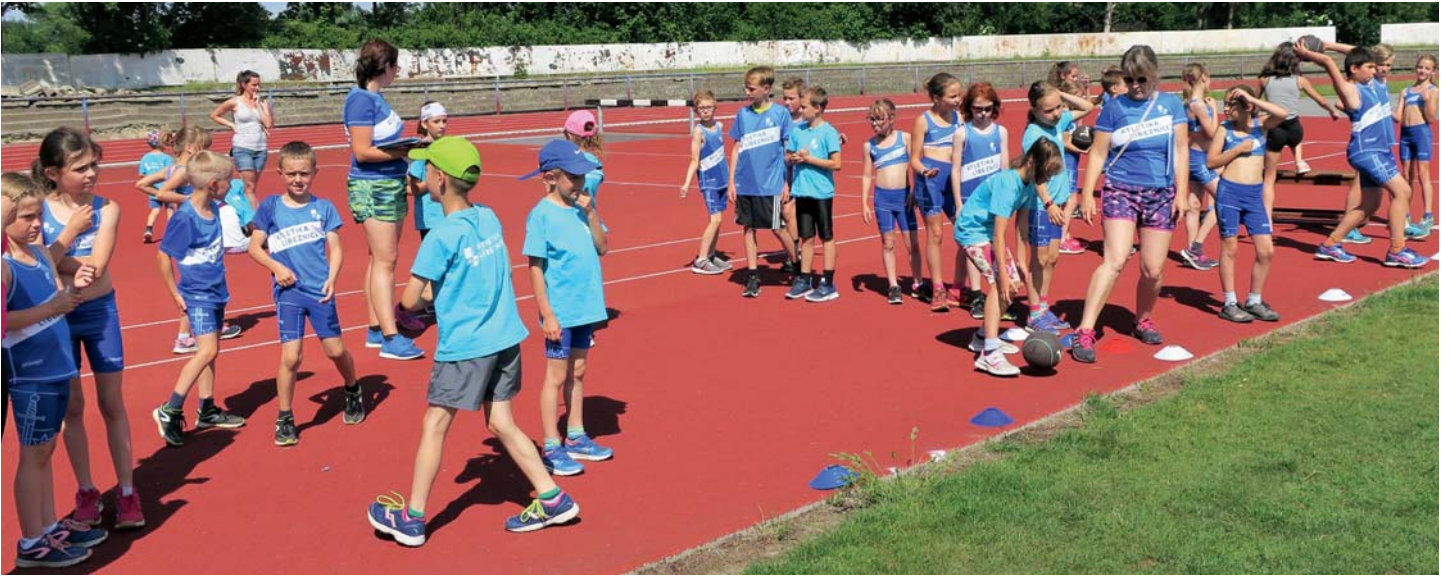
Atletická příprava Čelákovice