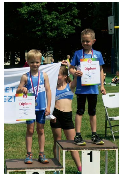
Říčany – JAZ