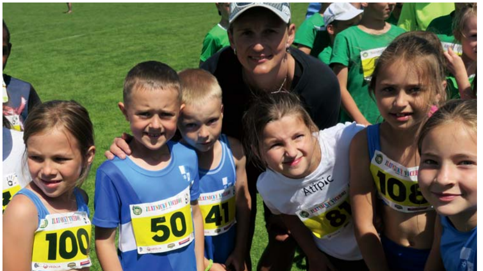
Atletika Zlatníky s Bárou Špotákovou