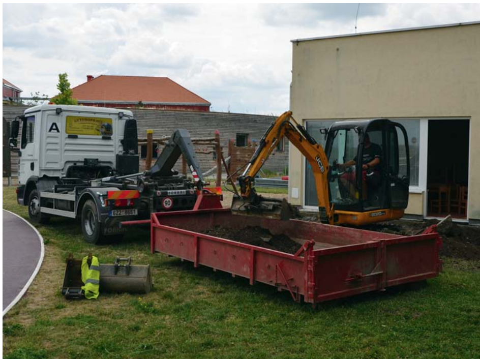
Hloubení základů pro přístavbu

„Pro nás je důležité jak zvýšení kapacity, tak ústřední topení a nová pergola, která by měla zastínit velká okna na východ. Budova se v teplých dnech vyložené přehřívá a pro děti je pak těžké si po obědě alespoň na chvíli odpočinout. Ústřední