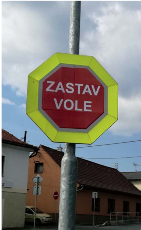
Vtipálek změnil značku