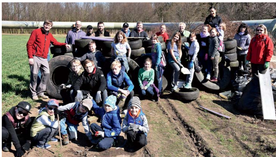
A máme o kolečka víc!