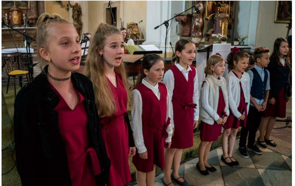
Pěvecký sbor ZUŠ Líbeznice