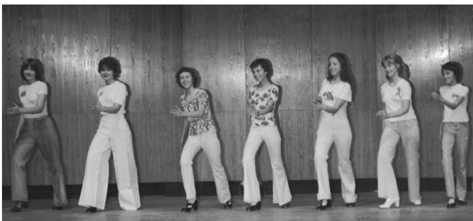
Stepačky v kalhotách podle poslední módy