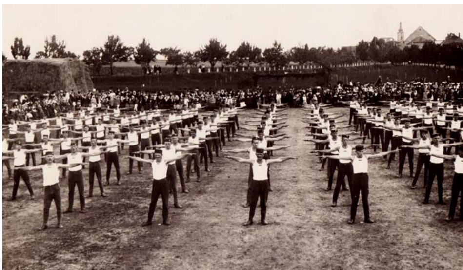
Sokolský slet v Líbeznících 1923

A jak to vlastně je se Sokolem jako sportovní jednotou? Proč vlastně vznikla? A jakou sehrála roli v historii České republiky? Podrobnosti najdete přímo na webových stránkách České obce sokol-