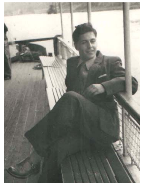
Archivní foto z roku 1952