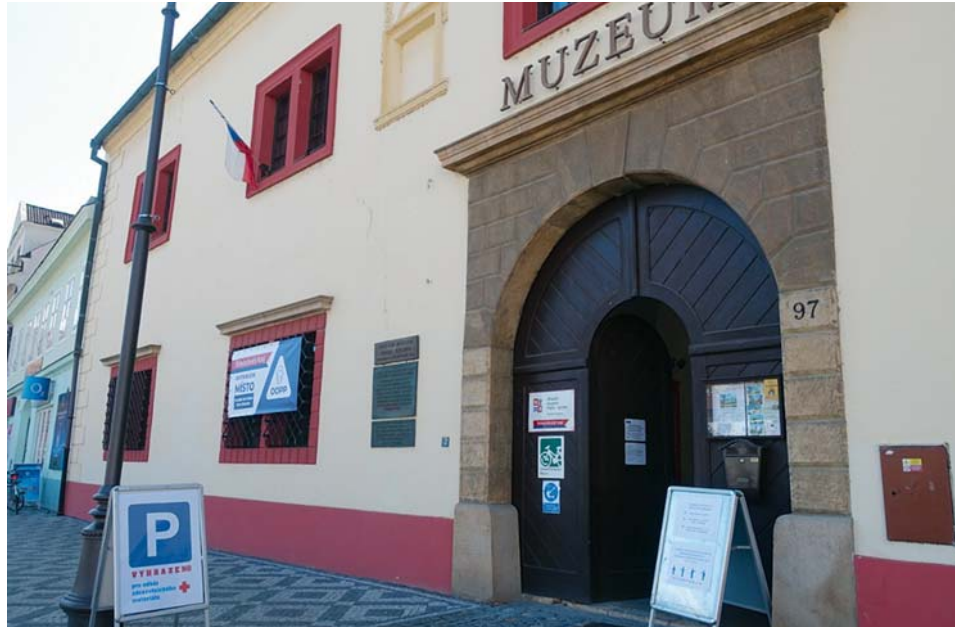
Muzeum v Brandýse se změnilo na výdejnu

Její jednotka je tvořena čtyřmi zaměstnanci z řad muzea, kteří na první pohled tvoří sebraný tým. Nyní mohou uplatnit nabyté znalosti ze školení, jež jim zřizovatel poskytl v rámci vzdělávacích programů. Další jednotka je připravena v záloze k okamžitému nasazení pro případ nemoci, karantény či jiných překážek.