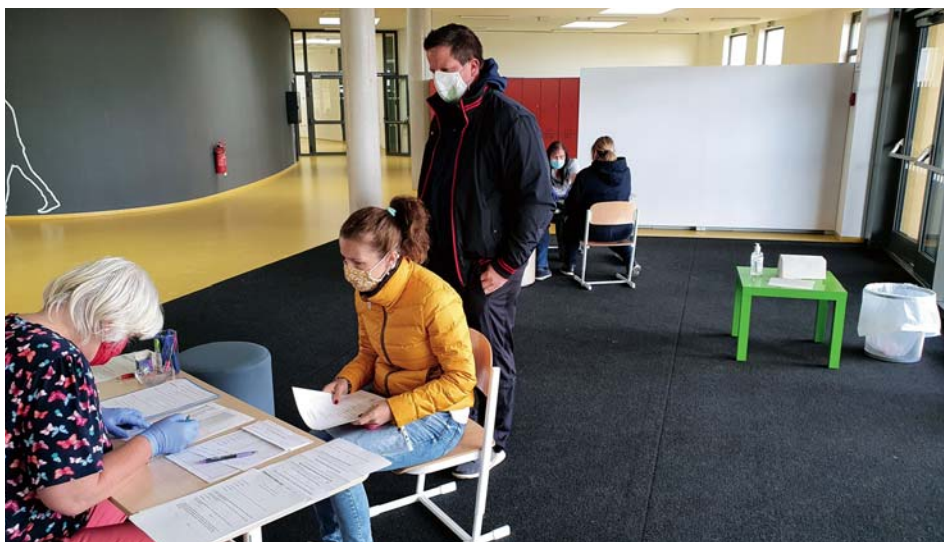
Zápis probíhající za zprůsvětlených hygienických podmínek