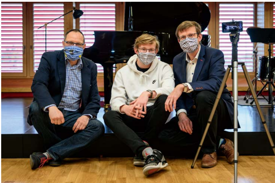
Redakční tým obou pořadů