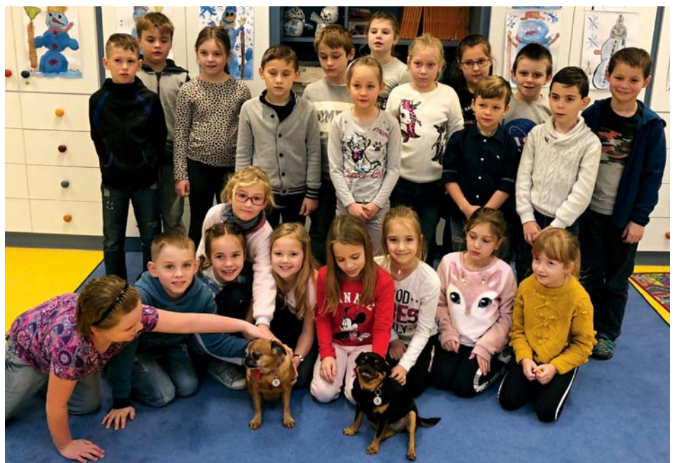
Pejsci udělali dětem radost

A věděli jste, že během vývoje příroda nadělila psům i nepatrné mimické svaly, kterými jsou