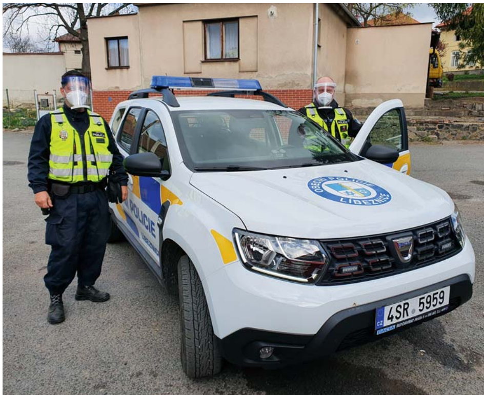
Jednotka obecní policie připravená k výjezdu

Vzhledem k tomu, že jsou naši strážníci obecní policie vybaveni automatickým externím defibrilátorem, zasahovali také u nahlášeného bezvědomí seniorky, kde byli na místě jako první. Naštěstí byla