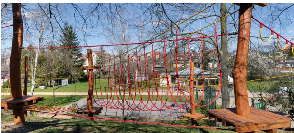
Lanová dráha v Arču

Z prvních reakcí je vidět, že lanová dráha udělala dětem radost a oceňují ji zejména ti, kdo mají rádi alespoň trošku adrenalinu při jejím zdolávání.