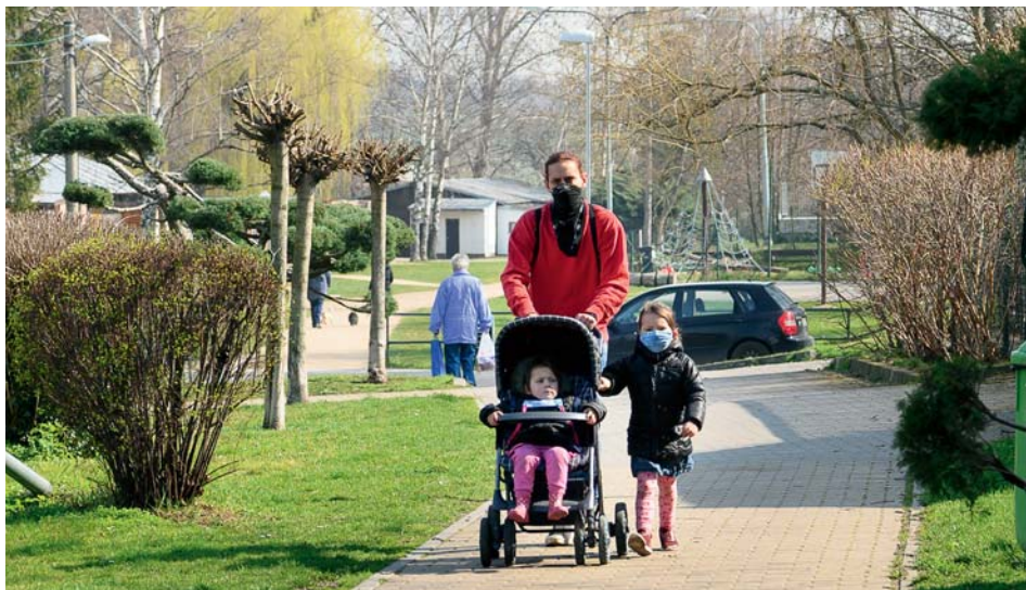
Moje rouška chrání tebe, tvoje rouška chrání mě