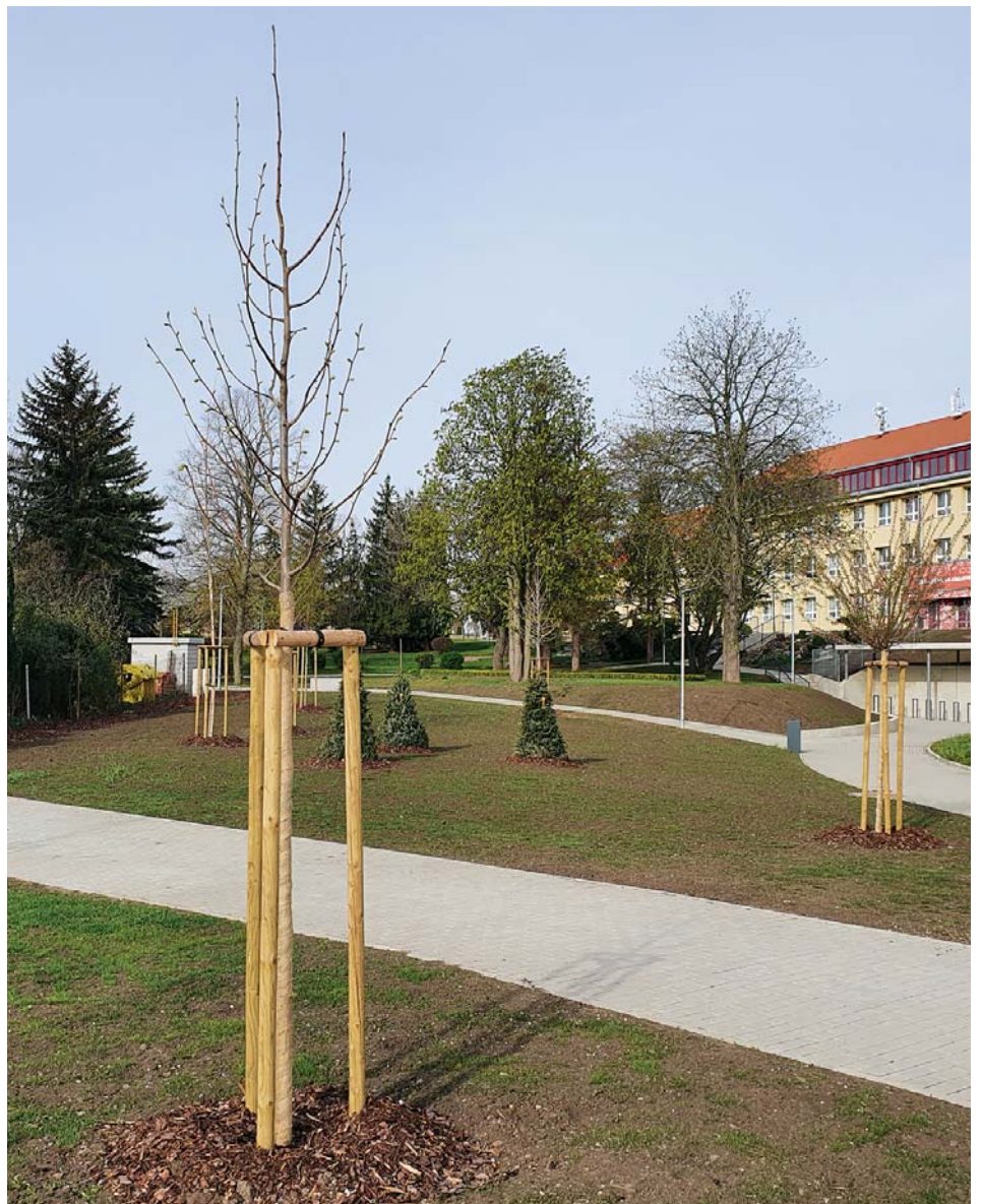
Nová podoba školního parku