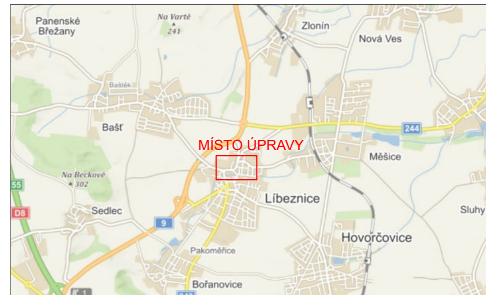
DETAIL MÍSTA ÚPRAVY - částečná uzavírka - bezpečnostní protismyková úprava (BPÚ)