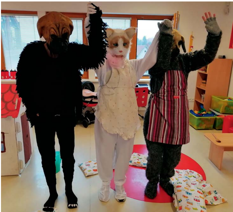
Jak pesek s kočičkou dělali dort

A to jsem málem zapomněl na Tvořivé odpoledne. Normálně vždycky tvoříme s rodiči. Bohužel, teď je ten covid, tak jsme měli tvoření s paními učitelkami. Přesto jsme si to užili a domů si všichni odnesli krásné podzimní zápisky.