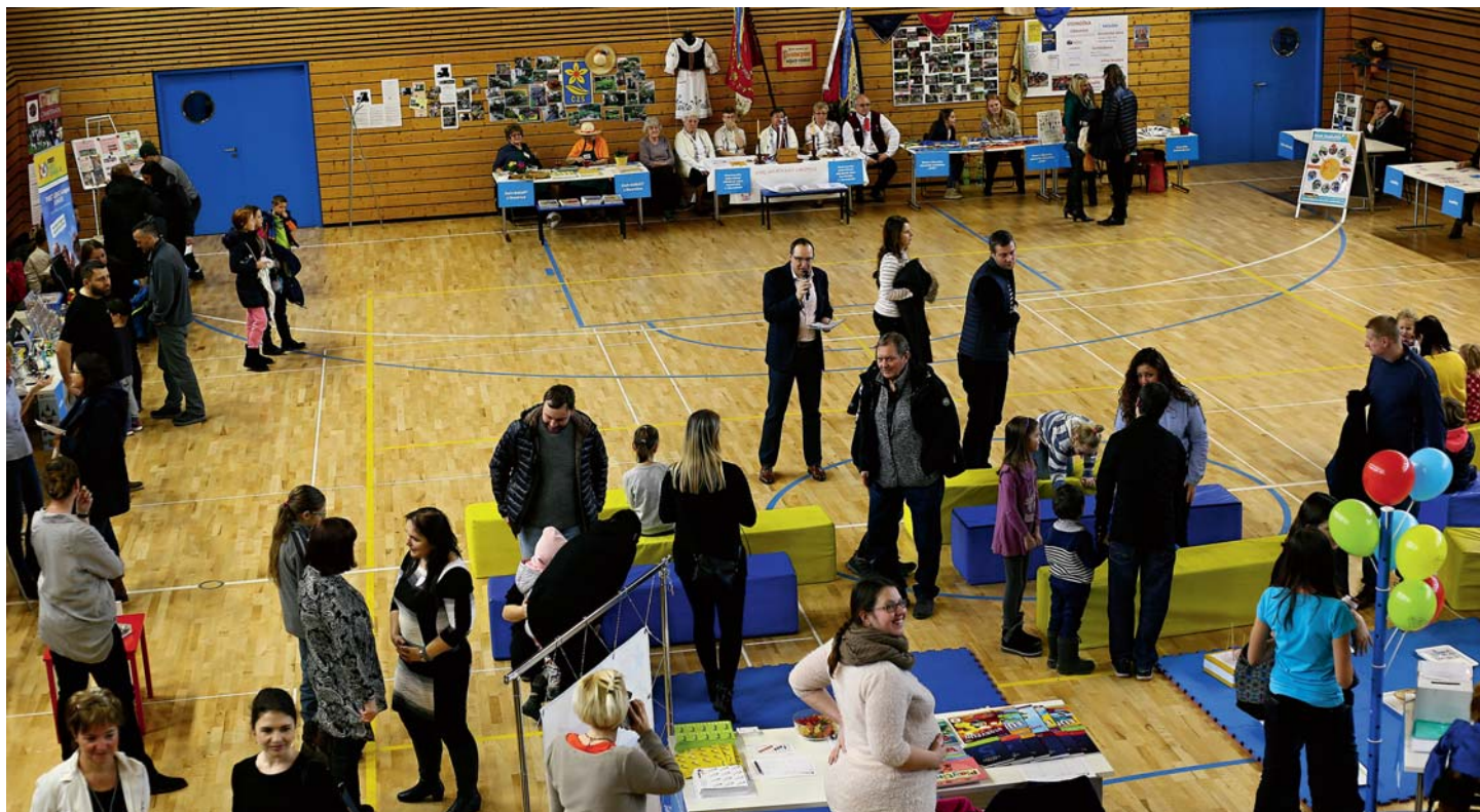
Veletrh líbeznického vzdělávání 2020