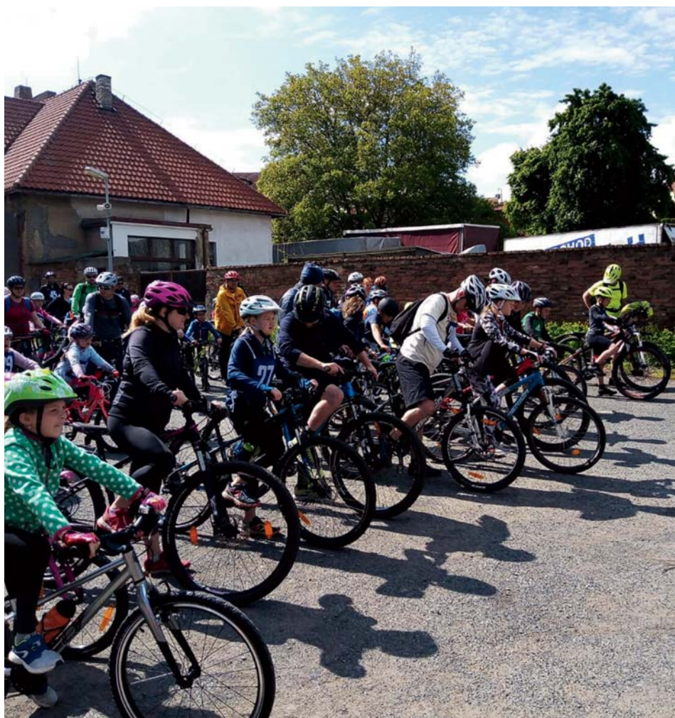
Kolem kolem Líbeznic