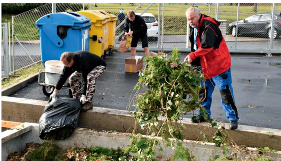
Sběrný dvůr bez bariér