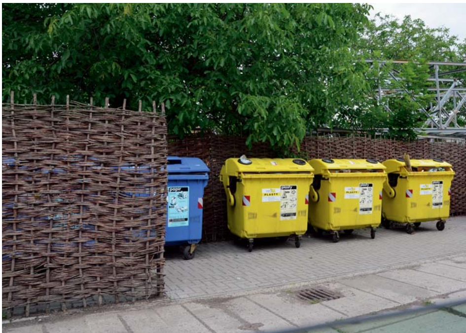
Kontejnery na tříděný odpad