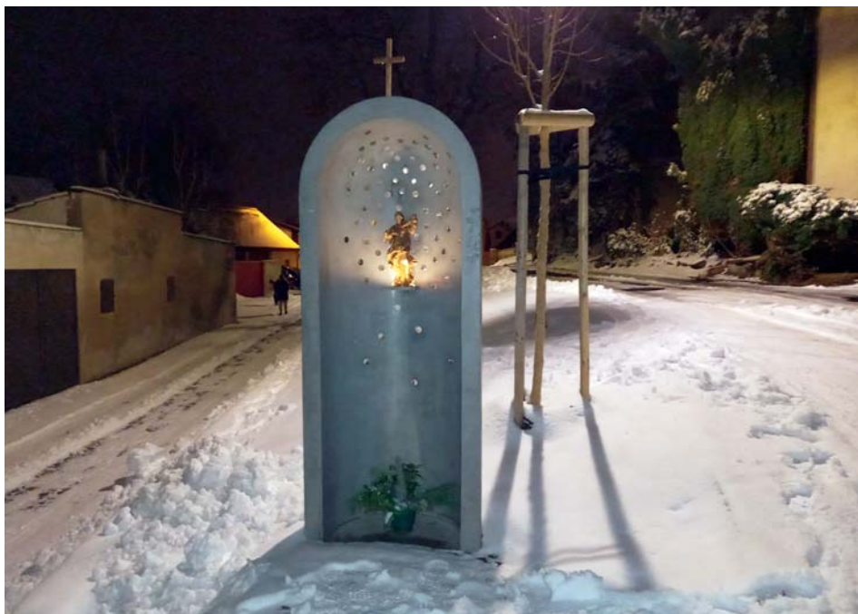
Kaplička sv. Ludmily