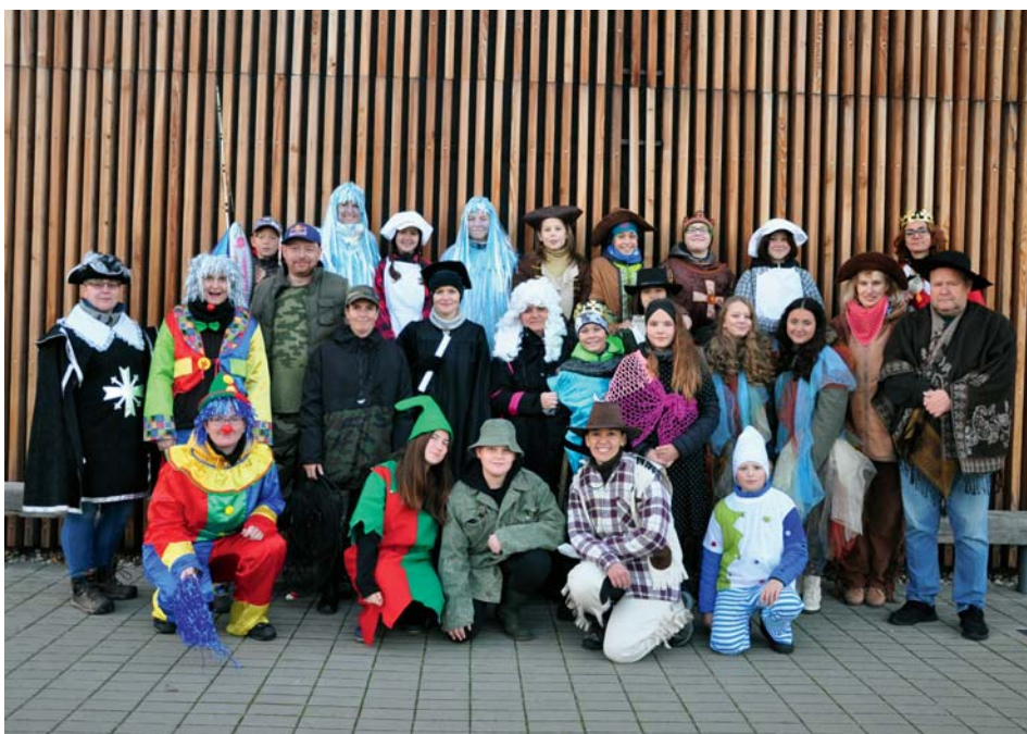
Honba za podkladem