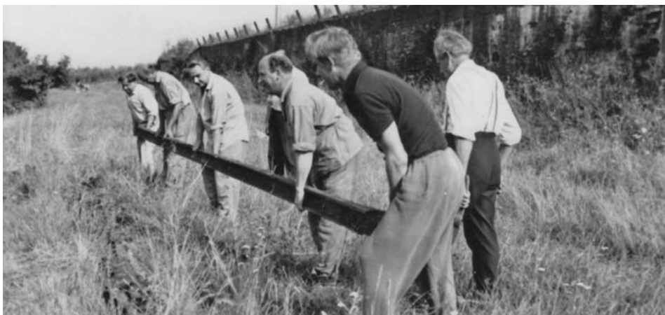
Demontáž Mratínky pod tarasem pod Chrupavkou při výstavbě Arča

Líbeznický cukrovar vyráběl navzdory uvedeným problémům velmi kvalitní surovinu, kterou rafinerie přednostně kupovaly, jelikož saturace v Líbeznicích byla provedena naprosto vzorně.