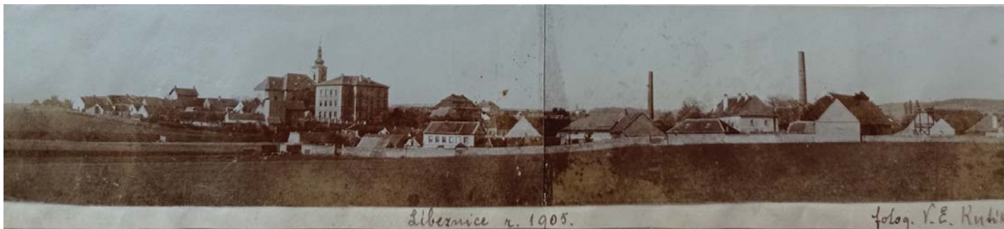
Panorama Líbeznic z r. 1905 s komíny cukrovaru