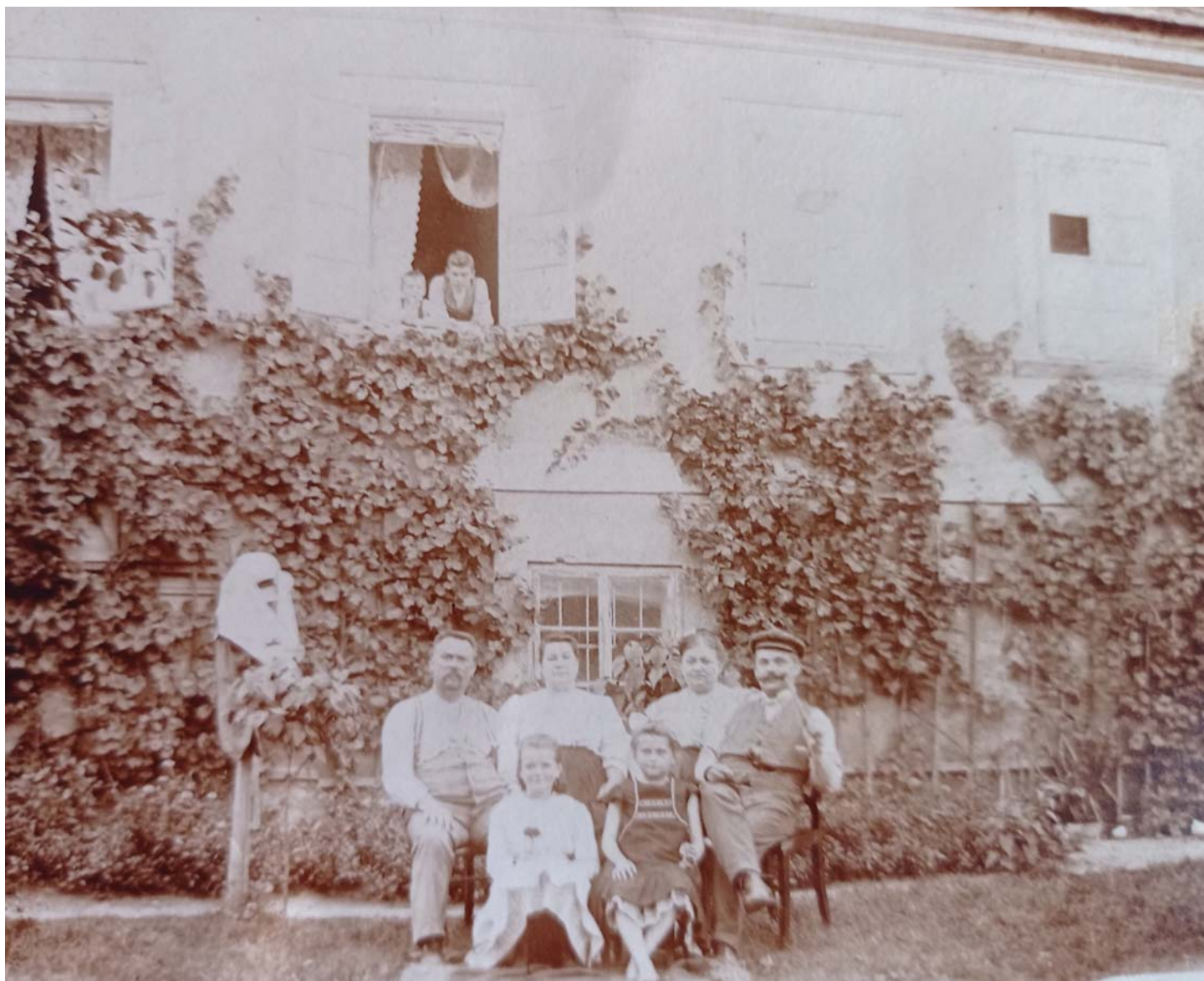
Cukrovarská – čp. 70, sídlo ředitelství cukrovaru, zahrada