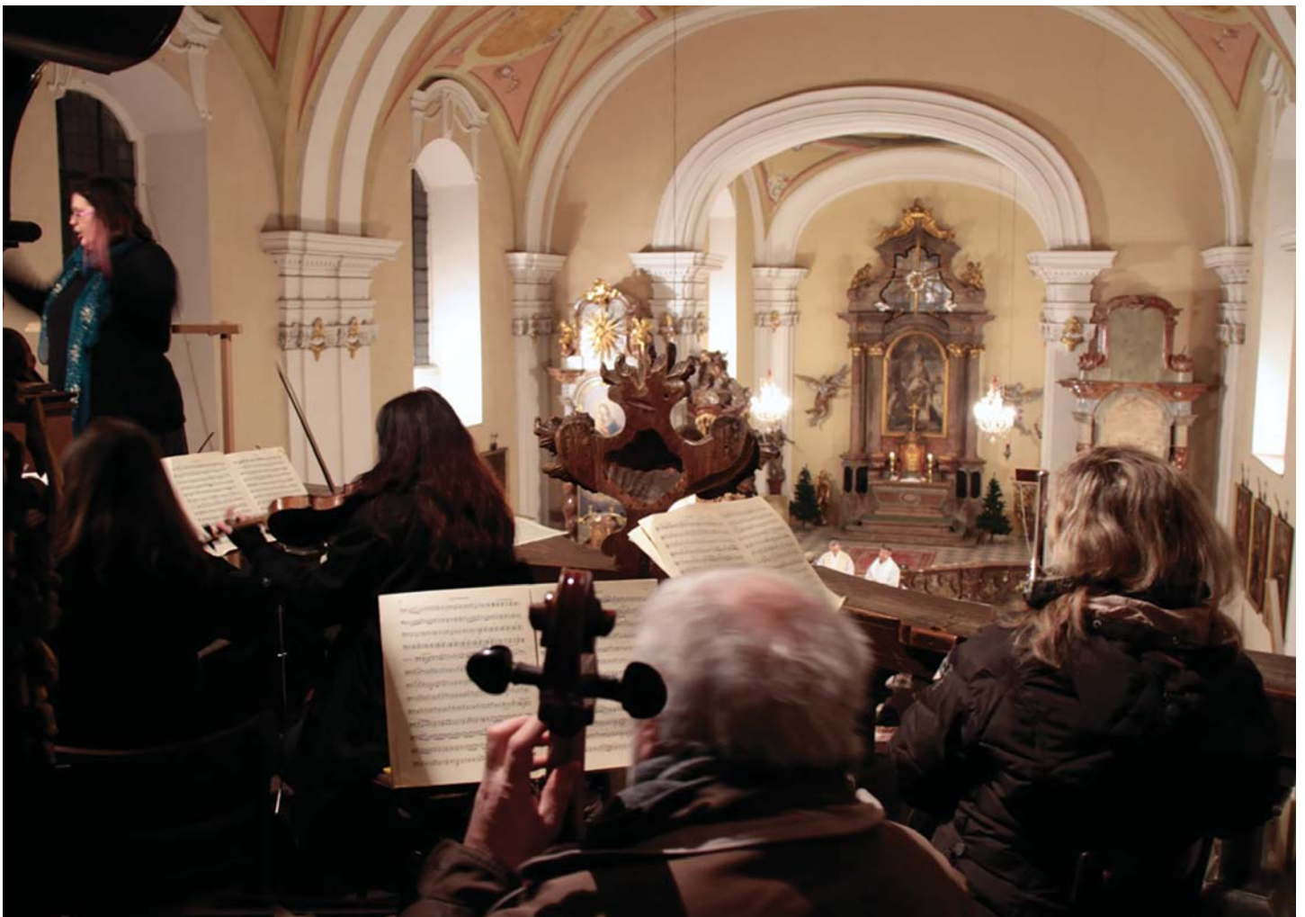
Česká mše vánoční