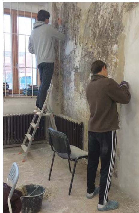
Příprava nového pracoviště

V době první vlny pandemie koronaviru vydala obec Líbeznice tištěný katalog produktů a služeb Pod Bec-