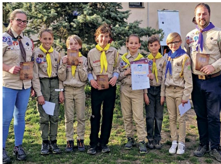
Skautský oddíl Surikaty