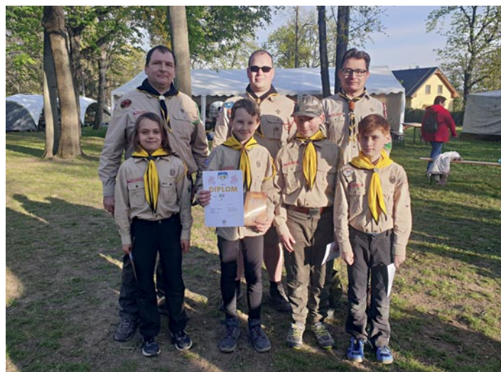
Skautský oddíl Vlčí důl