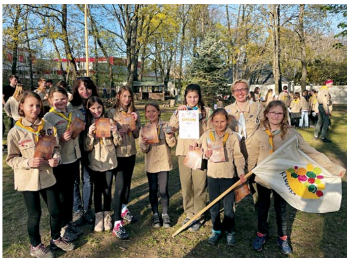
Skautský oddíl Klubička