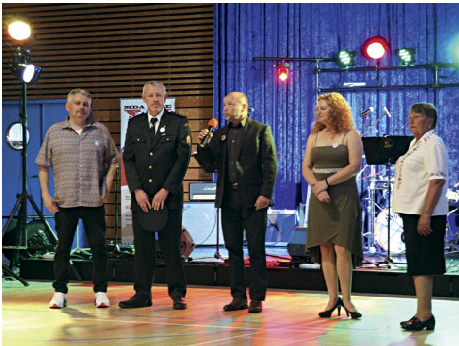
Zahájení spolkového plesu