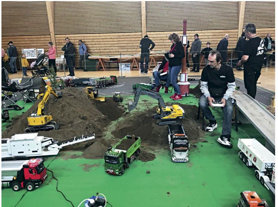
Modely při práci

Neméně zvědavý jsem byl na historický autobus Škoda 706 RTO, který návštěvníky na Líbebonu svázel z vlakového nádraží v Měšicích. Ten také krátce po desáté hodině dopoledne vyrazil do Panenských Břežan, kde jsme měli možnost zúčastnit se komentované prohlídky Památníku národního útlaku a od-