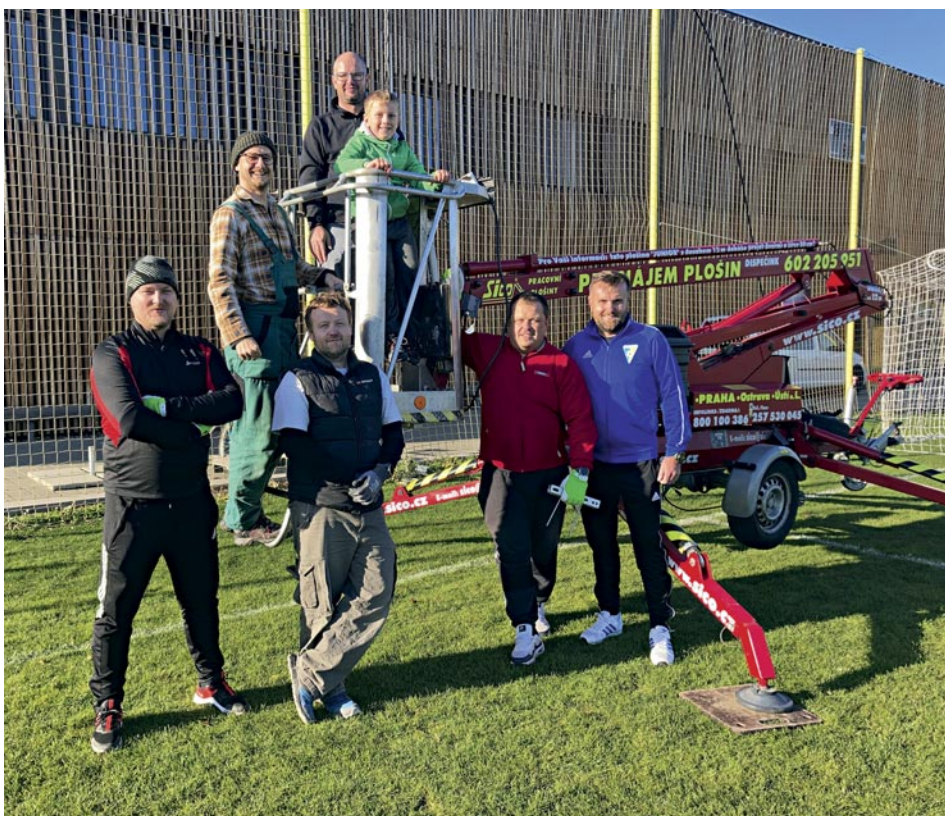
Trenéři při instalaci osvětlení

Také se velmi těšíme, že se pod reflektory odehrají soutěžní zápasy, naši malí fotbalisté si užijí mimořádné fotbalové prostředí a zvýší se tak jejich radost z fotbalu. Nejen tým trenérů si pak přeje, aby radost a snaha dětí přinesly mnoho nezapomenutelných zážitků, ale i oslavy úspěšných výsledků. A také aby nezůstalo „jen“ u osvětlení jedné poloviny hrací plochy a v budoucnu se podařilo posvítit si i na zbytek hřiště.