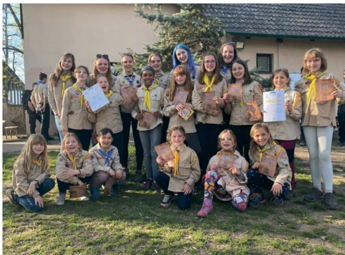
Skautský oddíl Amazonky