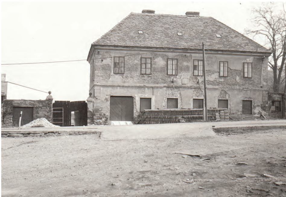
Služebna četníků a SNB Líbeznice čp. 42 (penzion na Mírovém náměstí)