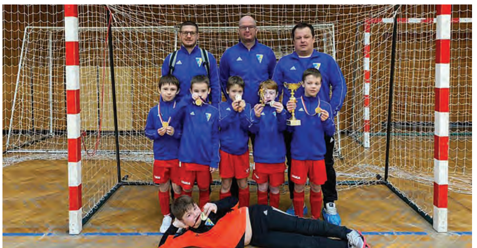
Mladší příprava s trenérským týmem