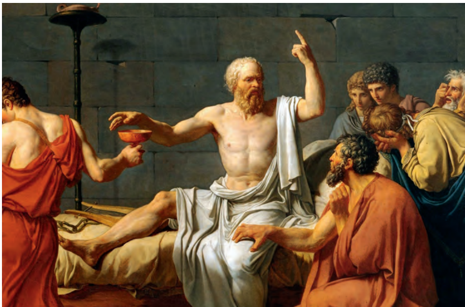
Vím jen, že nic nevím – jeden z nejslavnějších výroků přisuzovaných Sokratovi

Platon je prvním řeckým filozofem, jehož spisy se nám zachovaly. Podrobně se tak můžeme seznámit s vysvětlujícím a své názory obhajujícím projevem Sokrata v rámci svého procesu v díle Obrana Sokratova , kde také zachytil poslední chvíle života svého učitele. Dalším významným dílem jsou poli-