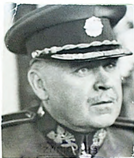
Generál Josef Šustr

Obci bylo vyhověno až po první světové válce v roce 1919.