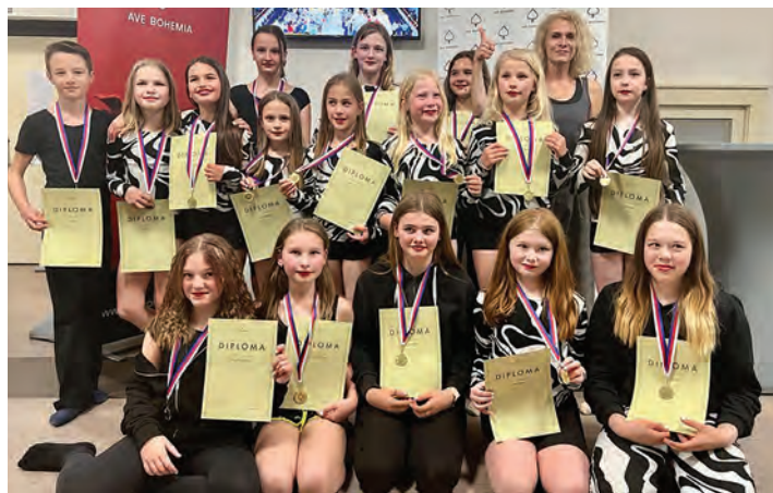
Ave Bohemia 2022, Praha