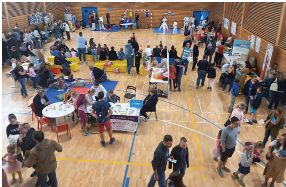
Vystavovatelé a návštěvníci veletrhu