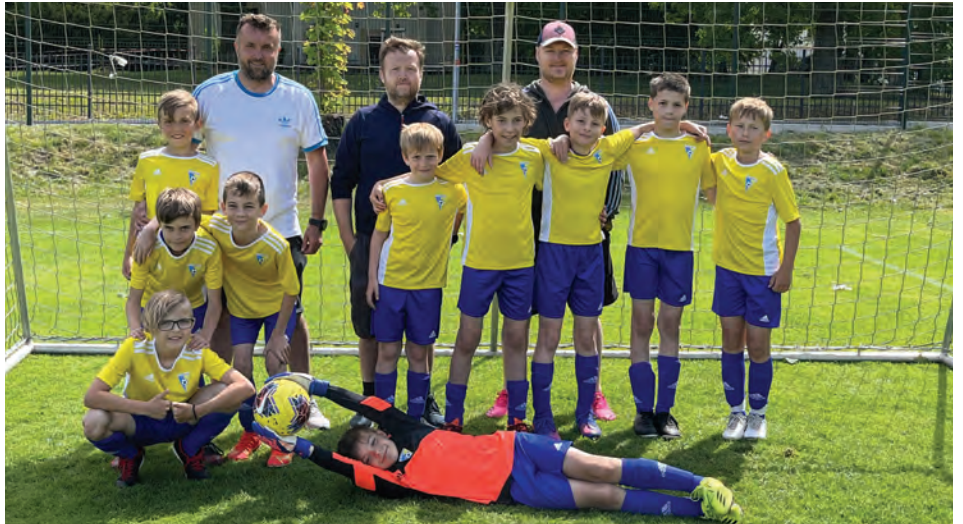
Starší příprava s trenérským týmem

Krátce po prázdninách bychom pak opět rádi zrealignovali nábor pro nové fotbalové nadšence. Tento-