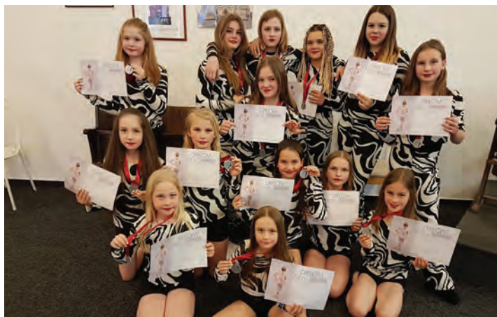
New generation 2022, Liberec