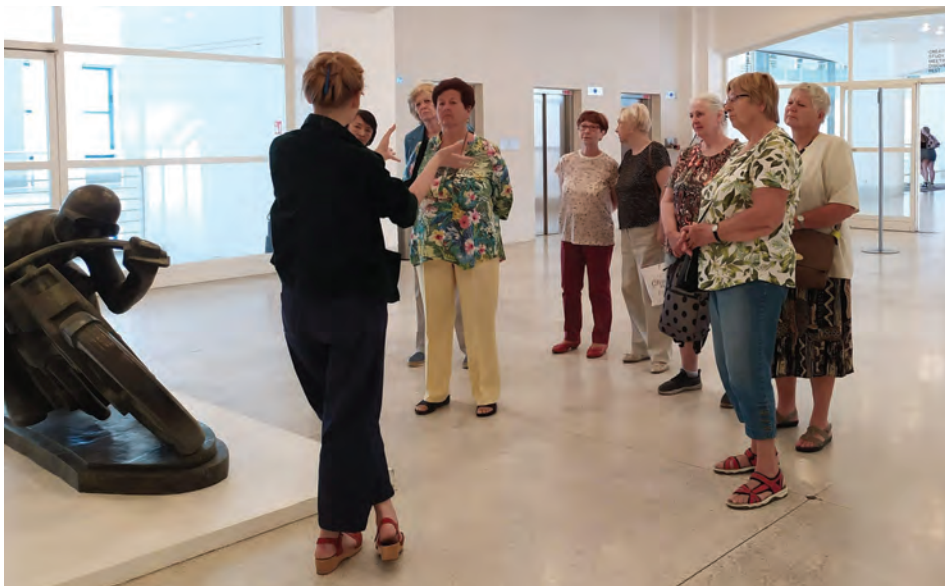
Návštěva Národní galerie

Dne 19. května proběhla plánovaná návštěva Národní galerie v Praze s komentovanou prohlídkou jako odměna za píli a radost, kterou jsme si vzájemně dopřáli jako zakončení jarního běhu s tím, že v září/říjnu bude zahájen další běh „Setkávání seniorů nad malbou“. Děkuji zastupitelstvu obce Lí-