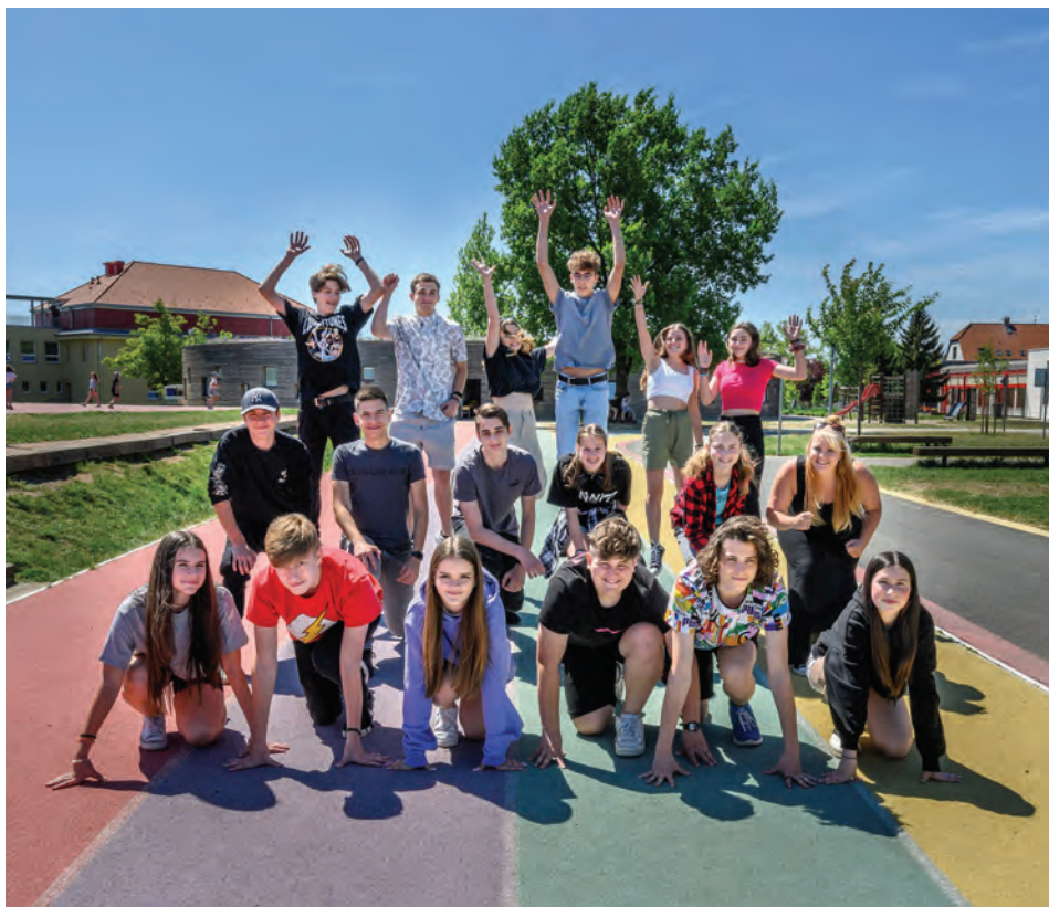
Devátáci na startu životní etapy

Rekordní byl právě končící školní rok tím, že školu navštěvovalo nejvíce žákyně a žáků v její historii. Jejich počet dosáhl čísla 1 375. Nejvyšší byl i počet dětí, které jsme přijali do prvních tříd, a to celkem 233 dětí. V příštím školním roce bude líbeznickou školu navštěvovat 1 550 dětí a možná se staneme největší školou v celé České republice. To je prvenství, o které ovšem nestojíme, nicméně se všichni musíme s touto skutečností vyrovnat. Všichni v pedagogickém sboru víme, že není dobré mít ve třídě 34 dětí, kterým není možné se individuálně věnovat, nelíbí se nám učit anglický jazyk v kuchyňce nebo zabírat pro výuku základní školy i prostory ZUŠky, ale bohužel nám v tuto chvíli nic jiného nezbývá. Vážíme si také toho, že nám v této nelehké situaci pomáhají rodiče tím, že celou situaci chápou. Světlelem na konci tunelu je výstavba nových škol, bohužel světlo se nám vzdálilo a podle všeho není reálné, aby nová svazková škola v Bašti