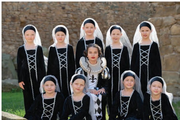
Natáčení Romea a Julie