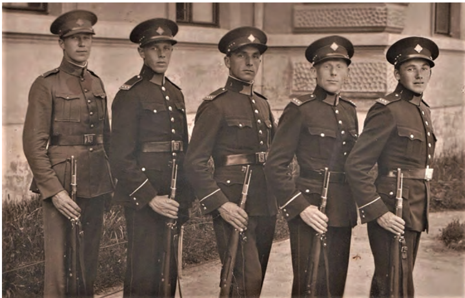
Líbezníčtí četníci – první republika

Ve druhé polovině šedesátých let 19. století vojenský policejní strážní sbor nahradily civilní bezpečnostní složky. Policisté se tak stali státními zaměstnanci, městskými nebo obecními strážníky, kteří byli placeni a řízeni městským magistrátem, obcí. To někdy býval problém. Lidé, kteří se o tuto agendu měli starat, to dělali jen velmi neradi. Důvodem byly náklady na stíhání a posléze živění vězňů, strach z pomsty od propuštěnců, kteří se mstili na majetku dozorujících úředníků loupežemi či zhářstvím. Dalším důvodem laxního přístupu k této agendě bylo také to, že většina úředníků nebyla právnícky vzdělána a dá se říci, že i pohodlná se touto agendou zabývat hlouběji. Proto se jí věnovali skutečně jen