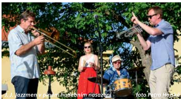
J. J. Jazzmen v plném hudebním nasazení