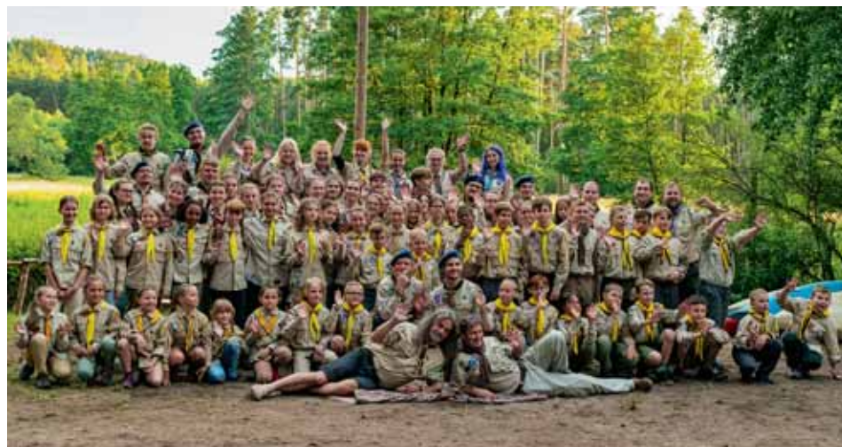
Oddíl Surikat, Amazonek a Vlčího dolu