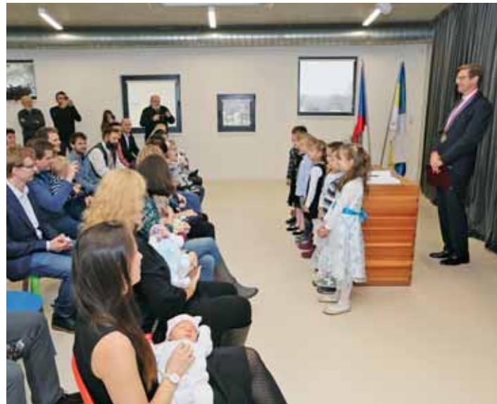
foto matrika Vítání občánků z roku 2018