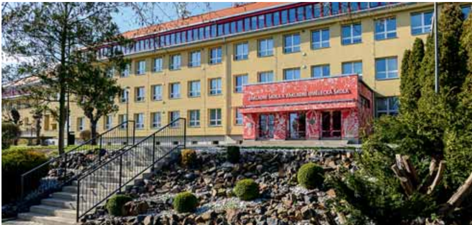
ZŠ a ZUŠ Líbeznice