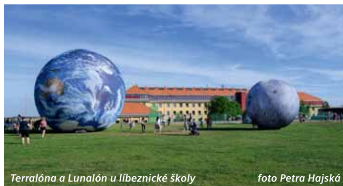
Terralóna a Lunalón u líbeznické školy