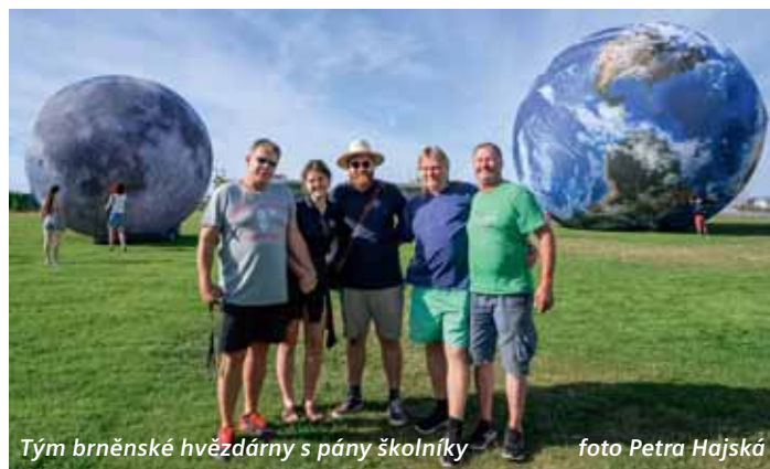
Tým brněnské hvězdárny s pány školníky