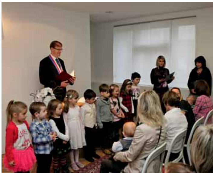
Vítání občánků z roku 2013