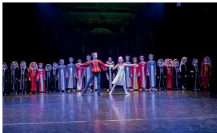
Romeo a Julie