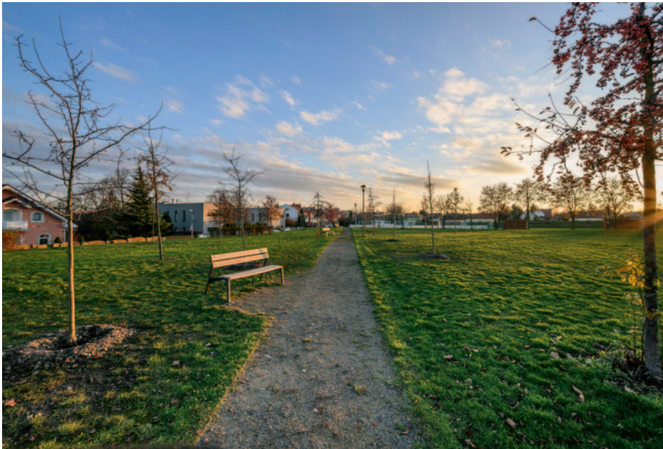
Nově vysazené stromy