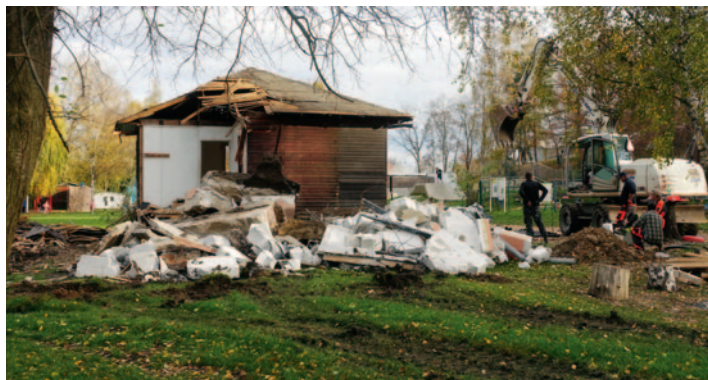
Zahájení bouracích prací 7. listopadu