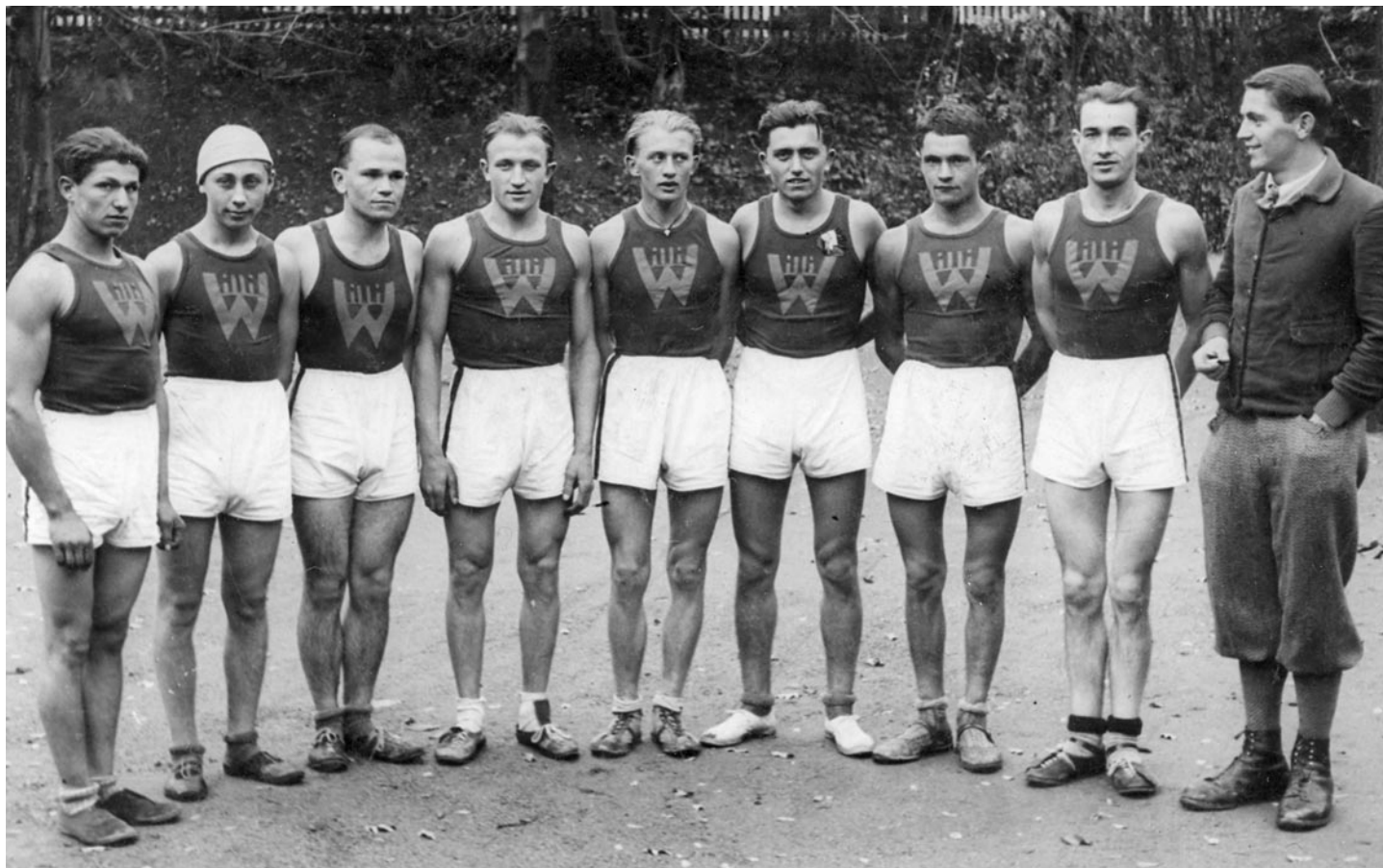
Fotbalový skautský klub Willi – Judytko druhý zprava

Květen 1933 – závod Praha–Běchovice: „Slavné Běchovice mě tolik lákaly, že jsem se přihlásil také