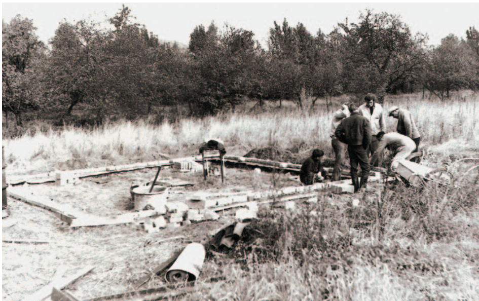
Vyzdívání základů pro skautskou chatu v září 1968

Možná to bylo symbolické vzhledem ke komunistickým zákazům junácké organizace, ale v pondělí