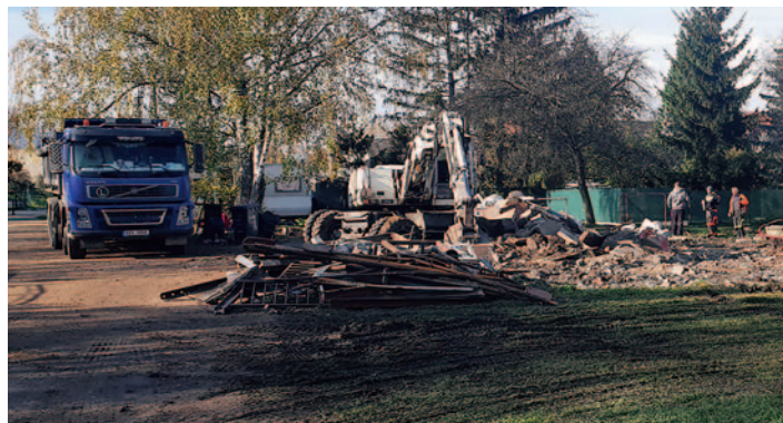
Bourání skautské chaty bylo dokončeno 11. listopadu