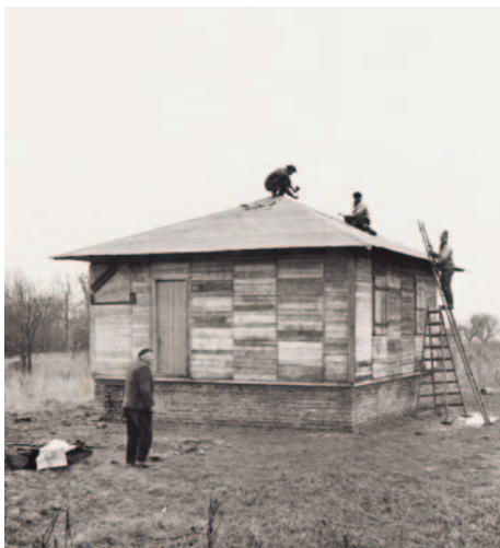
Sestavování chaty koncem listopadu 1968