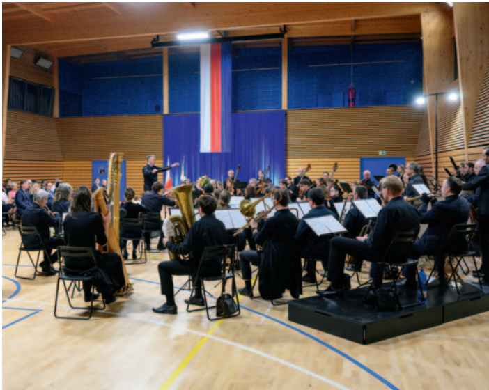
Slavnostní večer se symfonickým orchestrem