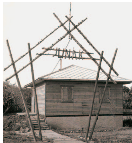
Skautská chata po dokončení v předjaří 1969