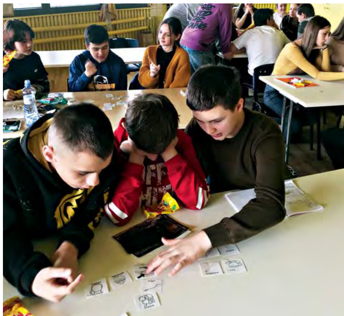
Výuka ukrajinských dětí

A tak jednou z prvních velkých akcí byla úprava prostor Archy pro ubytování dvou ukrajinských rodin a zajištění prostor pro dopolední výuku ukrajinských žáků ve skautské klubovně. Fotbalové hřiště se v dubnu rozzářilo Světla pro Ukrajinu v rámci charitativního zápasu nejmladších líbeznických fotbalistů, v jejichž řadách si hráli i malí fotbalisté ukrajinští. Motto „Děti pomáhají dětem“ hovoří samo za sebe.