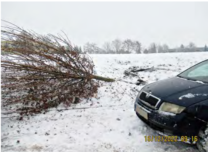
Nehoda v Hovorčovické

Rudolf Sedlák vrchní strážník