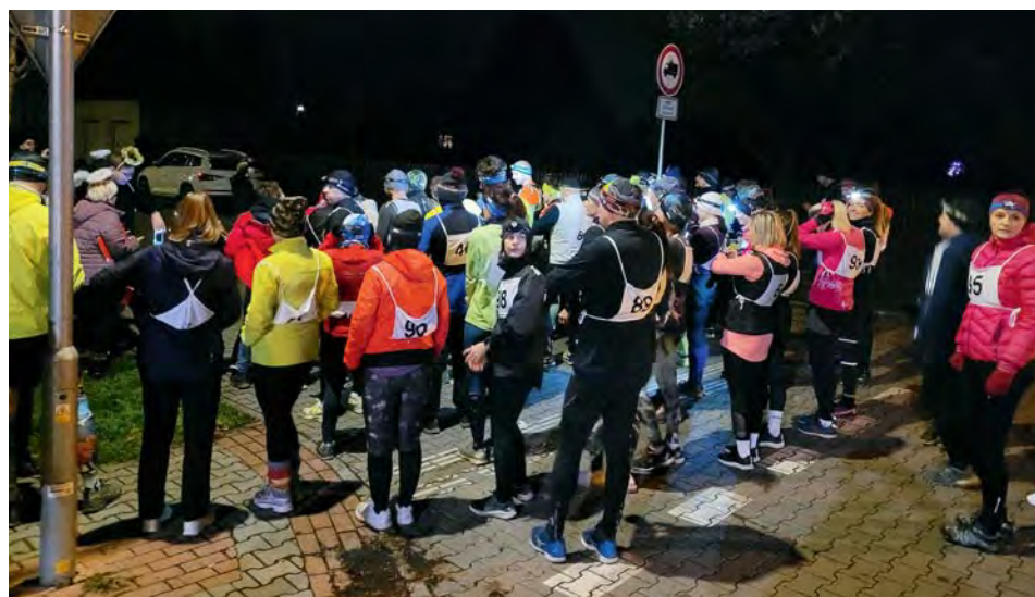
Soutěže rodin na trase s úkoly dlouhé 3 km

Vaše Sportovní hala Na Chrupavce