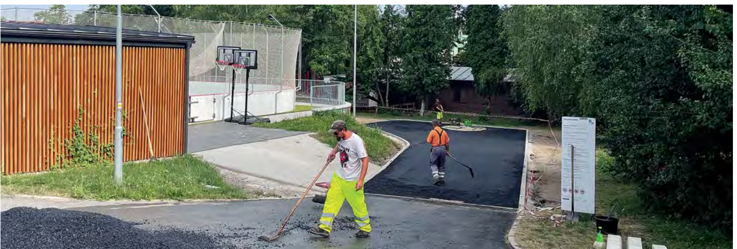
Sportovní po rekonstrukci

A obnovy se dočkaly nejen povrchy ulic, ale i zelené plochy na líbeznických veřejných prostranstvích – záhon u Mazlíčka s přerostlými a částečně uschlými levandulemi byl nově osázen, podobnou úpravou prošly i záhony kolem stromů na Mírovém náměstí.