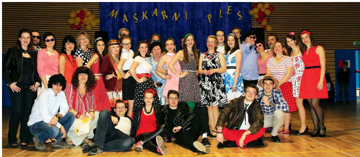
Maškarní ples ve stylu šedesátých let à la Pomáda v hale Na Chrupavce ze 4. března 2017