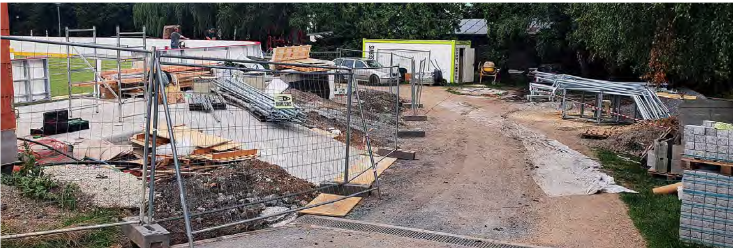
Sportovní před rekonstrukcí

První bruslařská sezona ukázala jeden zásadní problém mlatové cesty od čističky odpadních vod směrem do Areálu zdraví. V rámci rekonstrukcí výše uvedených ulic byl celý blátivý úsek vyasfaltován a odvodněn.