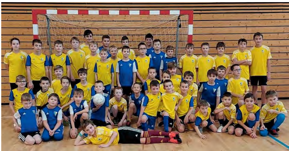
Malí líbezníční fotbalisté

Na jednom jsme se ale po „náletu“ dětí společně shodli – hvězdou degustačního soutěžního