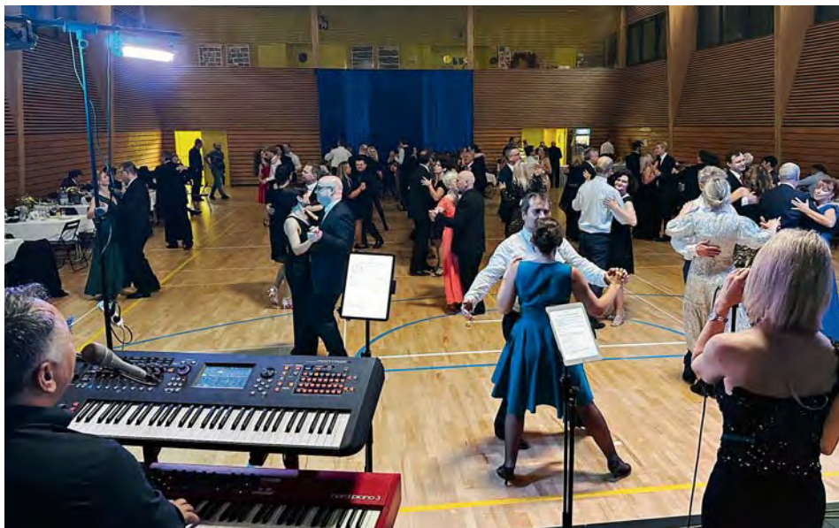
Zahajovací ples v hale Na Chrupavce se konal 3. prosince 2022