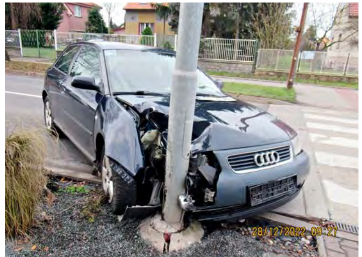
Nehoda na Mělnické