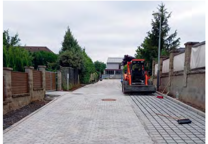
Vnitřní po rekonstrukci

První bruslařská sezona ukázala jeden zásadní problém mlatové cesty od čističky odpadních vod směrem do Areálu zdraví. V rámci rekonstrukcí výše uvedených ulic byl celý blátivý úsek vyasfaltován a odvodněn.