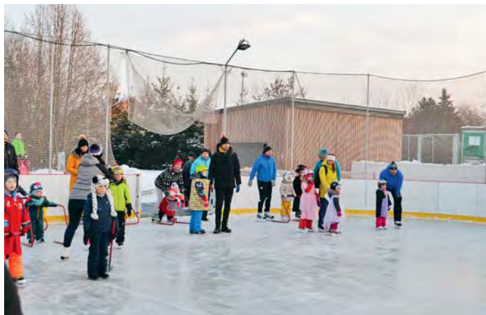
Líbeznický karneval na ledu