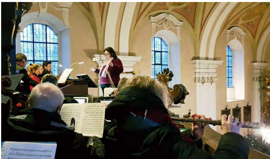
Sbor a orchestr v kostele sv. Martina

Během této pauzy vždy s napětím vyhlížím sólisty. Jelikož jsou to profesionálové, jezdí bez zkoušek