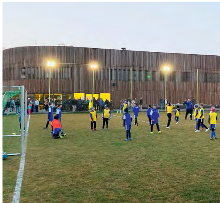
Světla pro Ukrajinu

V létě byla zahájena dlouho připravovaná a obyvateli tolik požadovaná rekonstrukce ulice Pakoměřické. Z původního panelového neuspořádaného povrchu se ulice proměnila v moderní veřejné prostranství s jasně vymezenou plochou vozovky, chodníku a parkovacích stání. Díky vyvýšeným křižovatkám by měl být zneprůhledněn život všem řidičům, kteří si místní komunikace pletou se závodní dráhou Formule 1.