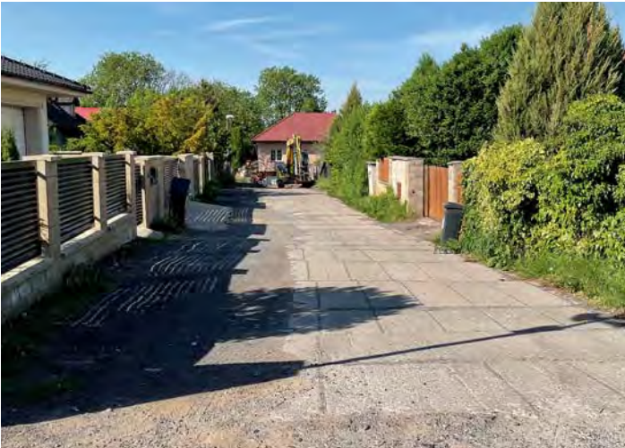
Vnitřní před rekonstrukcí

Rekonstrukcí prošla i ulice Vnitřní, kde bylo potřeba kromě odvodnění upravit výšku komunikace tak, aby byla dokonale bezbariérová. Dokonce zbyl i prostor na záhon levandulí.