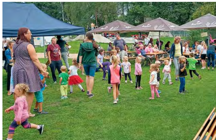
Sportovní odpoledne pro děti a rodiče