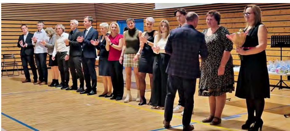
Trenéři při slavnostním večeru