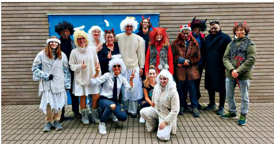
Start na běh 5 km

Čekám. Jak dlouho může trvat uběhnout 5 km, zčásti po osvětleném asfaltu, zčásti po neosvětlených bahnitých cestách? Je to překvapující, ale hluk a skandování se rozeznějí už po 16 minutách a nej-