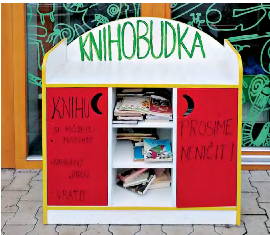
Knihobudka v „mateřince“