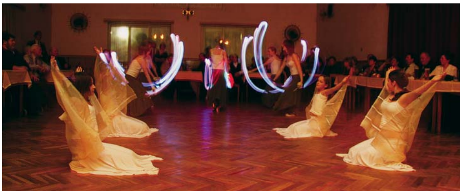
-rk- LED show na Skautském plesu ve Zloníně 9. února 2008

také místní skautské středisko a fotbalový klub, vznikl zde i malý sál například pro aerobik nebo jógu a bistro. Prvním plesem v nové hale byl Líbeznický ples, který proběhl 27. ledna 2017. A právě tímto momentem se navázalo na tradici plesů konaných v Líbeznících, která byla nešťastně přerušena požárem sálu U Tišnovských v roce 1966. Okamžikem otevření nové haly se začala psát nová historie plesů, ať už obecních, maškarních, tanečních zábav, disco večerů, koncertů, nebo výstav. Sportovní hala Na Chrupavce se tak stala nedílnou součástí kulturního, sportovního a společenského života v naší obci, bez kterého už si, bez nadsázky, nikdo z nás Líbeznice neumí představit.