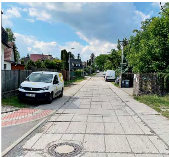
Pakoměřická před rekonstrukcí

V létě byla zahájena dlouho připravovaná a obyvateli tolik požadovaná rekonstrukce ulice Pakoměřické. Z původního panelového neuspořádaného povrchu se ulice proměnila v moderní veřejné prostranství s jasně vymezenou plochou vozovky, chodníku a parkovacích stání. Díky vyvýšeným křižovatkám by měl být zneprůhledněn život všem řidičům, kteří si místní komunikace pletou se závodní dráhou Formule 1.