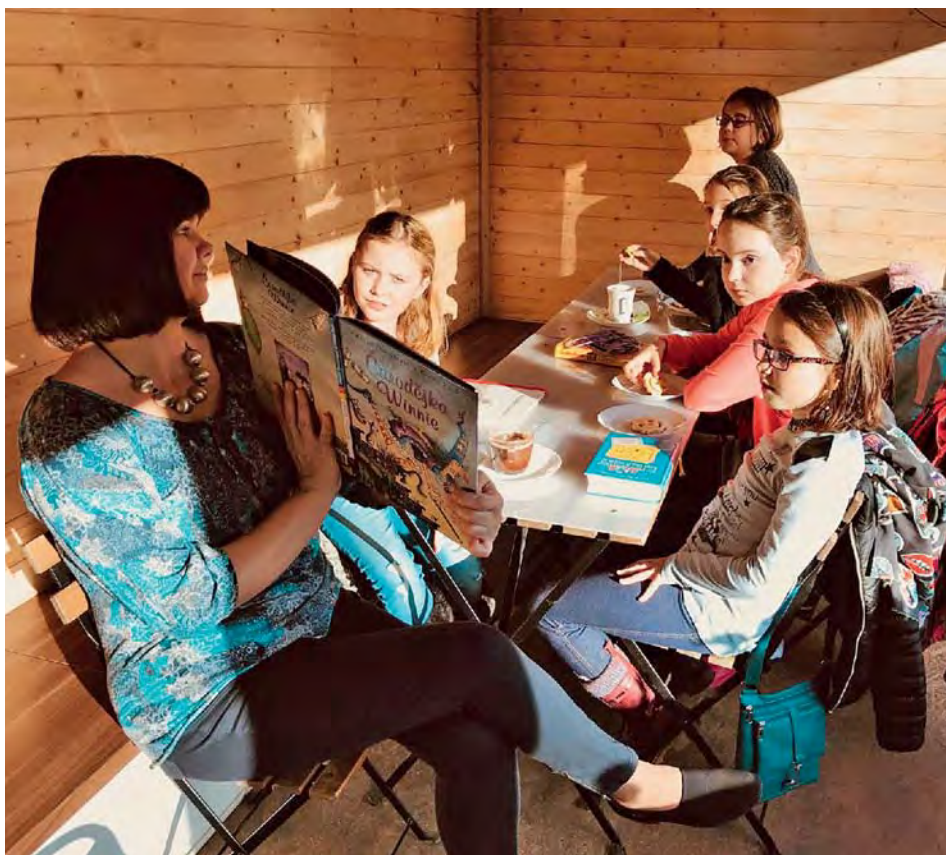
Čtenářský klub v líbeznické knihovně