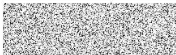
Tomáš Cabák, jednatel

Support communication s.r.o. Volutová 20/10, Stodůlky 158 00 Praha