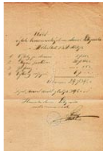
Vyúčtování hnanecských výloh z hnanecké stanice z roku 1886

pětinu nákladů na jeho postrk platila domovská obec, zbytek zemský fond, respektive c. k. berní úřady.