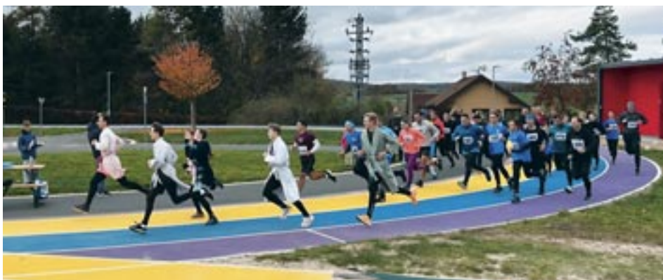
Start – kategorie dospělých