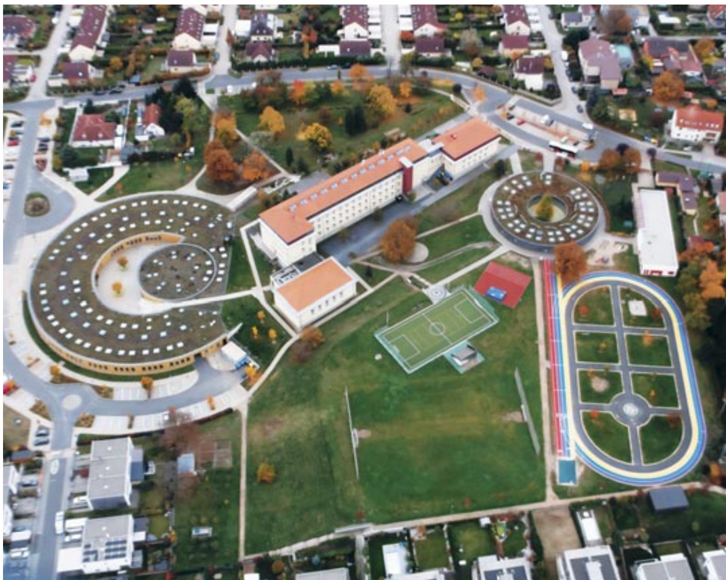
Školní areál v Líbeznicích