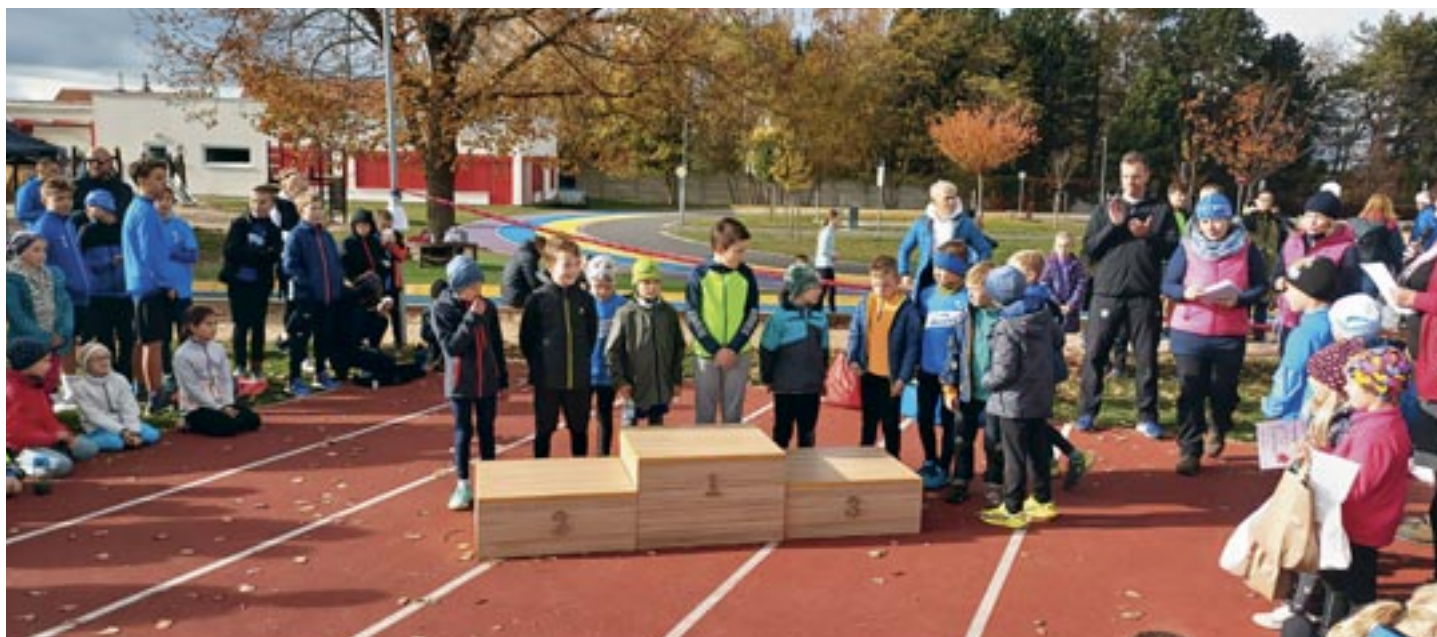
Podzimní běh – ocenění nejmladších chlapců