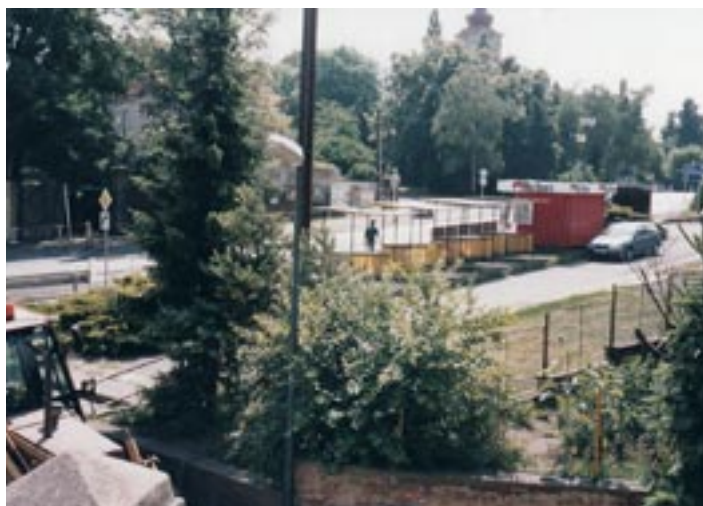
Trafika na Mírovém náměstí