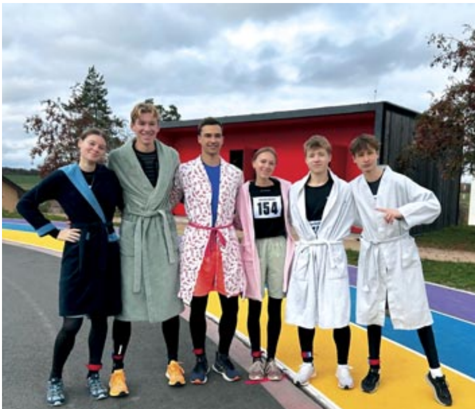
Naši župánkoví závodníci

Tým Atletiky Líbeznice