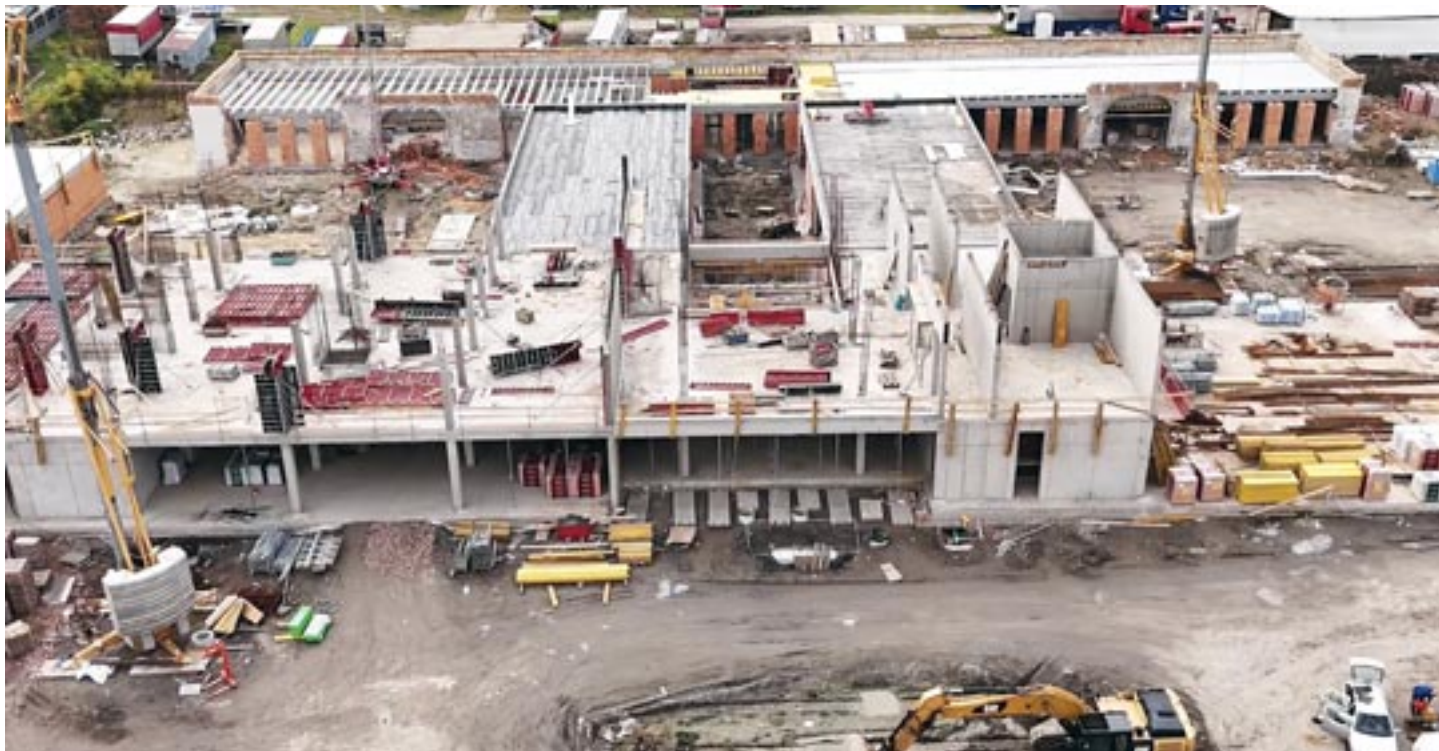
Stavba školy v Bašti – říjen 2024