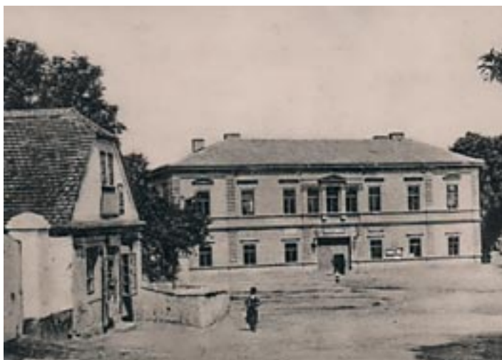
Trafika na náměstí v čp. 14