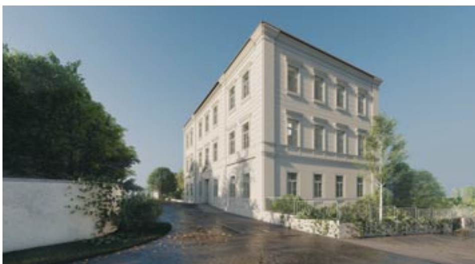
Vizualizace bytového domu čp. 142 v ul. Martinova