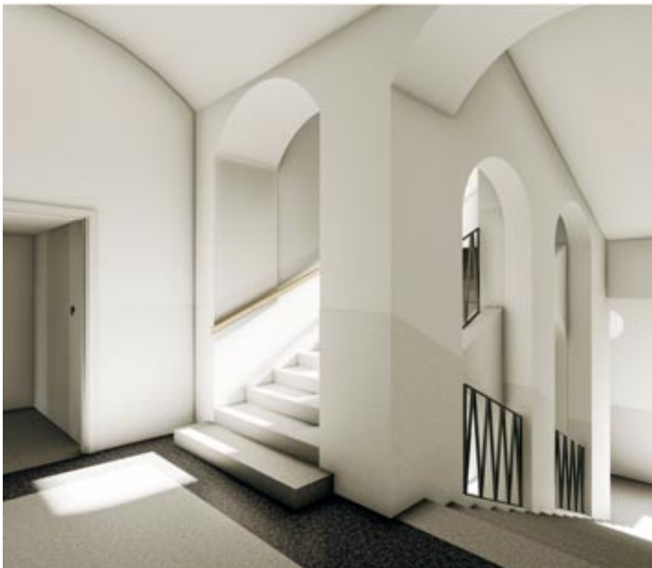
Vizualizace společné chodby čp. 142