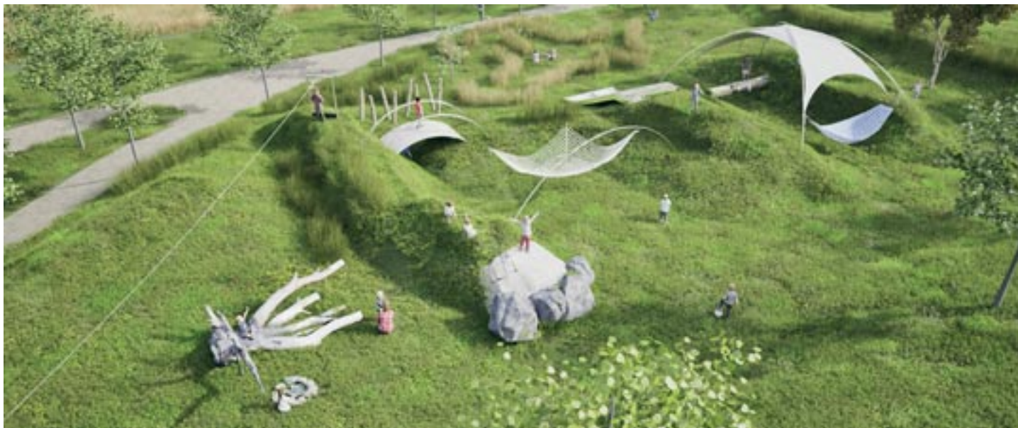
Návrh herní krajiny pod školou