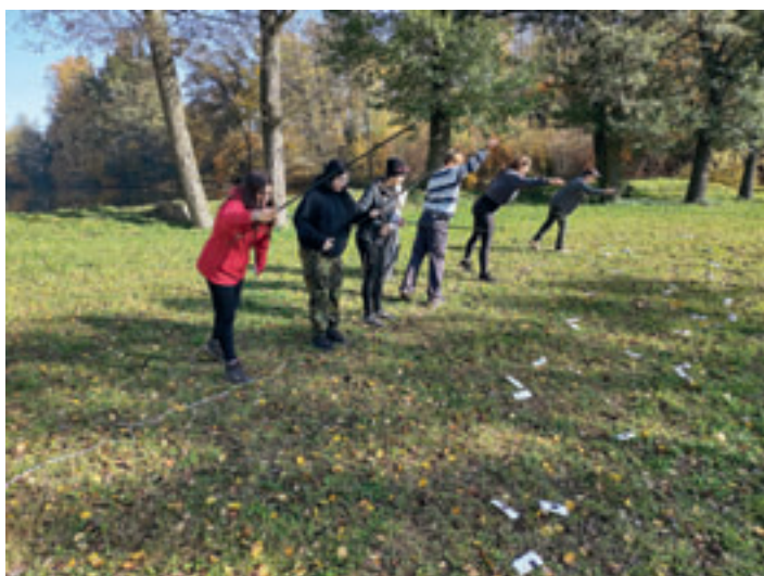
Podzimní tábor, rybaření po skautsku