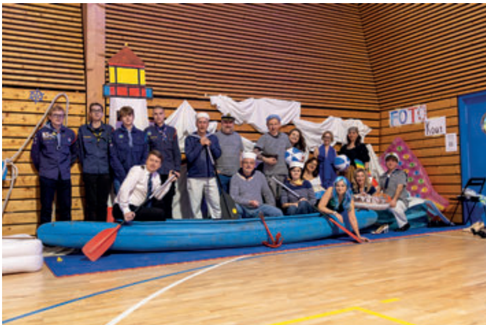
Skautský námořnický ples

Hradčanské lesy letos v létě opět sloužily jako dějiště mnoha dobrodružství. Nejprve hostily sedm indiánských kmenů, kterým poskytly útočiště pro rituály, seance, výrobu indiánských