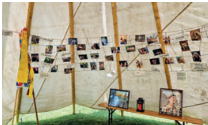
Bratr Chřástal, pamětní týpí na závodu vlčat a světlušek v Měšicích