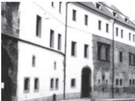
Vstup do Novoměstské radnice na Karlově náměstí

Pro věrnou lásku. (Před porotou.) Včera o 2. hodině odpolední vnesen byl rozsudek nad Antonínem Čížkem, 24letým ženatým rolníkem, jenž obžalován byl pro nedokonanou vraždu na nynější