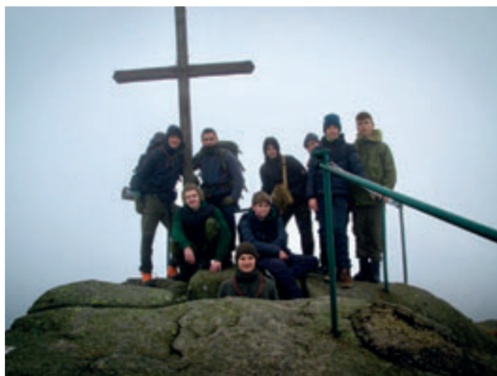
Vlčí důl Zlonín a Surikaty, zimní výprava do Jizerských hor