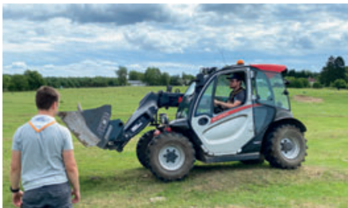
Pomoc od Fénixu na farmě v Plouznici na roverském táboře

Zlonín a ze Surikat na výpravě do Jizerských hor. Přespávali v malé dřevěné chatě „Muštelka“, topili v malých kamnech, čerpali vodu přímo z pramene a na programu bylo dosáhnout druhého nejvyššího bodu Jizerských hor, jímž je vrchol hory Jizera. Promočení a utahaní po 27 kilometru dlouhé trase povečeřeli poctivou bramboračku, utužili svá přátelství a v neděli se ve zdraví vrátili spokojeni a plní nových zážitků. V březnu proběhl pátý ročník