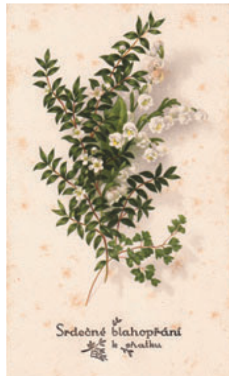
Blahopřání k sňatku

Na oltáři rozsvítily sluhové šest voskových svící a před stupně postavili klekátko. Jinak se vzezření kaple nezměnilo. Nejprve přiveden byl ženich, statný bezvousý mladík, jenž měl na sobě černé kalhoty a šedý kabát. Z očí jeho zářilo radostné rozehvěnění. Po chvíli vešla do kaple nevěsta, poněkud uplakaná. Oděna byla v hnědé vlněné šaty a kromě myrtového věnečku na hlavě neprozrazovalo u ní pranic nevěstu. Nevěsta jest velmi hezké děvče. Po prvním se kání v kanceláři soudcově přistoupila nyní již klidněji k ženichovi a připjala mu na prsa proutek rozmariny, na níž byla mašlička z bílé stužky. Pak společně klekli před oltář. Kaple jakož i předtím byly obecenstvem přeplněny, kde kdo mohl ze soudního personálu, dále žaláři a osoby, jež právě dlely v soudní budově, spěchali do kaple, by přítomni byli zvláštnímu sňatku. Důstojný pán Batha oslovil snoubence krátkou řečí, kterou počal slovy: „Po smutné a trapné zkoušce přistupujete jako snoubenci před oltář Páně, abyste dosáhli cíle